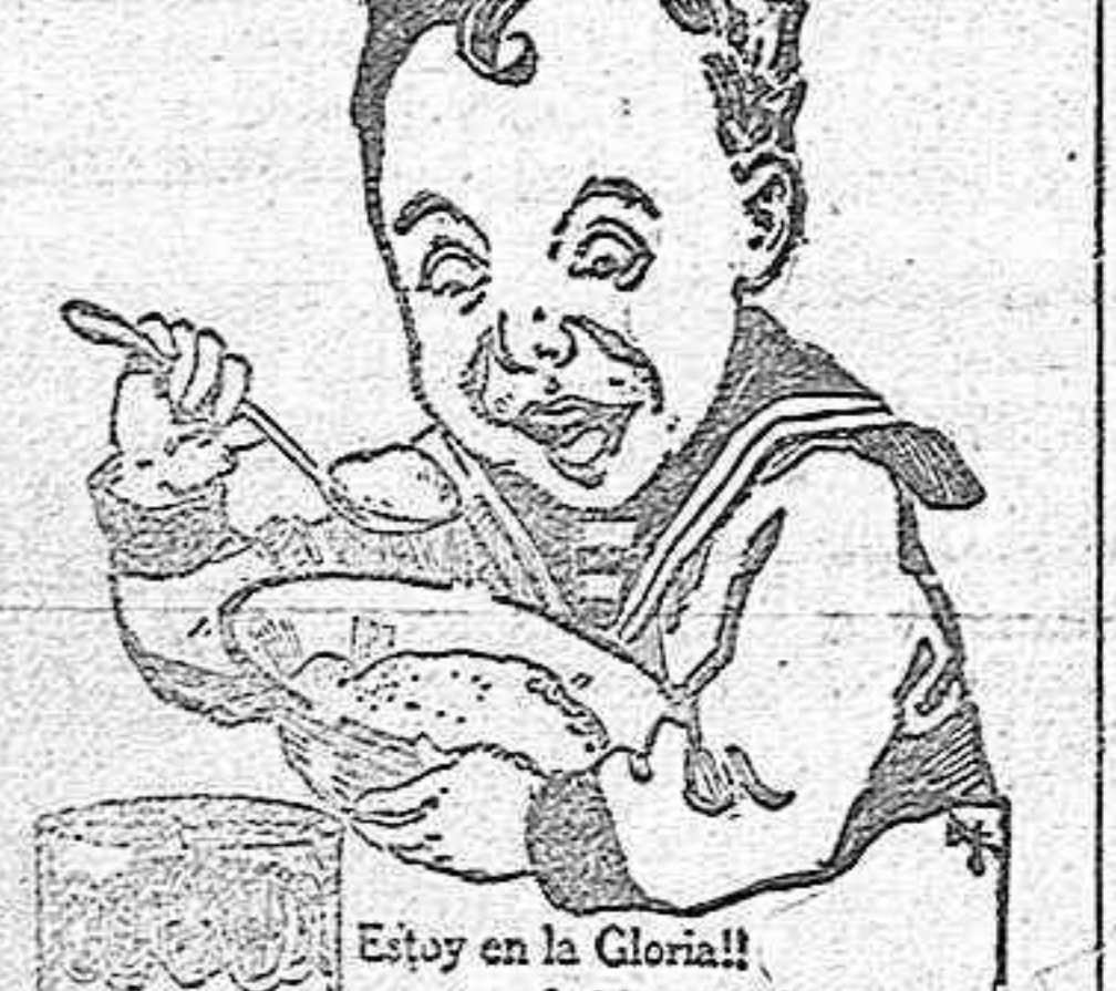
Estoy en la Gloriosa. Qué buena es la HARINA LACTEADA de Nestlé. Es el alimento que profesan los niños.

Se vende una perra recién nacida, por haber muerto la madre. Para tratar Clemente Dominguez, Lrs Ossa. 1-1-d. Se venden dos carros uno de dos caballos y otro de tres seminuevos, con aparatos y resas; se venden también sputos e se cambian. Para tratar con D. María Zamora.—Castill Ruiz. 1-1-p. Cal viva se vende en el monte de Torre- tario 3 pesetas fanega desde el 25 del corriente al 5 de Abril próximo. 1-2-d.