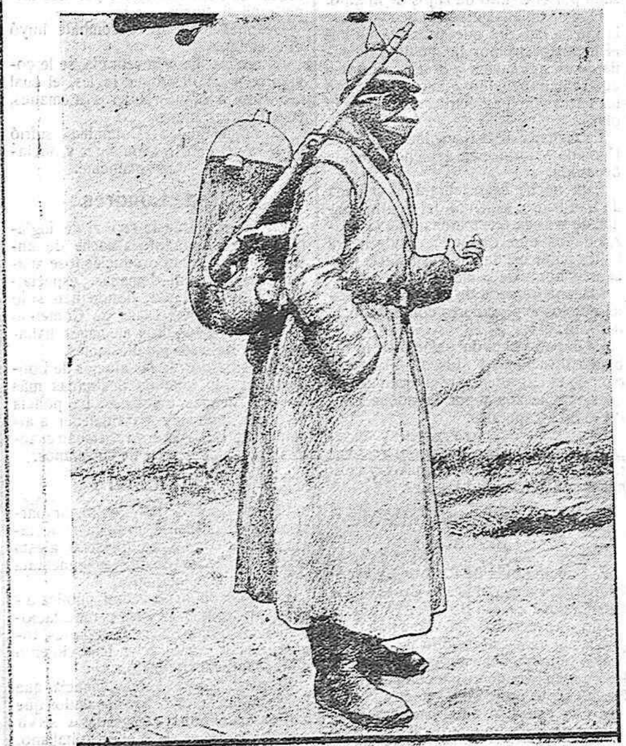
SOLDADO ALEMÁN DISPUESTO A EMPLEAR LOS GASES ASFIXIANTES Y PROTEGIDO CONTRA SUS MORTÍFEROS EFECTOS.