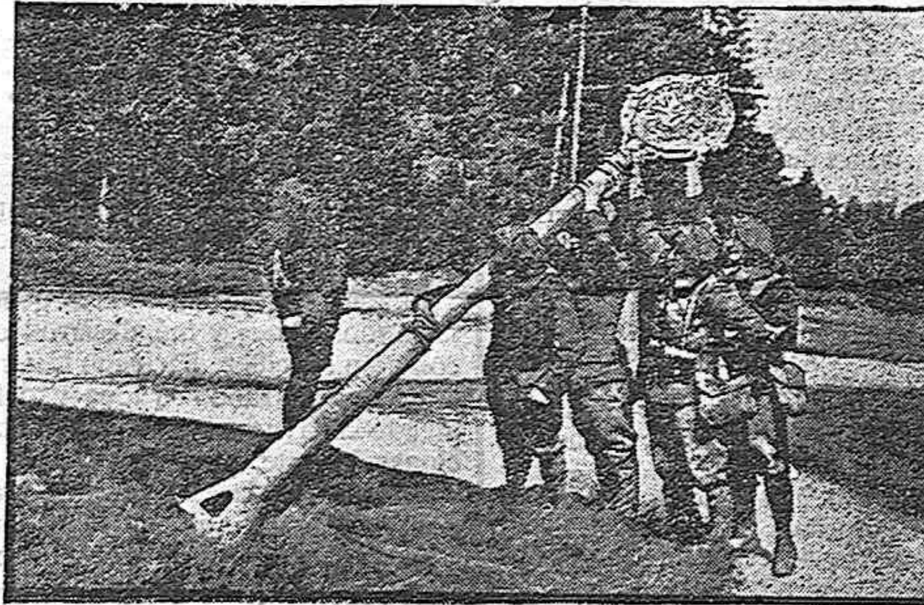
CAZADORES ALPINOS RETIRANDO LA COLUMNA QUE SEÑALA LA FRONTERA FRANCO-ALEMANA.

Lo único importante de la sierra es el barranco de la Muerte; barranco hondo, muy hondo. Desde lo alto al suelo hay distancias enormes. Los caminos que le bordean son estrechos y mal arreglados están; rara es la persona que los transita. Su historia negra data de varios siglos atrás. La cuentan con marcado terror los rabadanes para infundir pánico a los chicos y evitar que lleven por aquellos andurriales el ganado, pues fácil es su caída y desaparición.