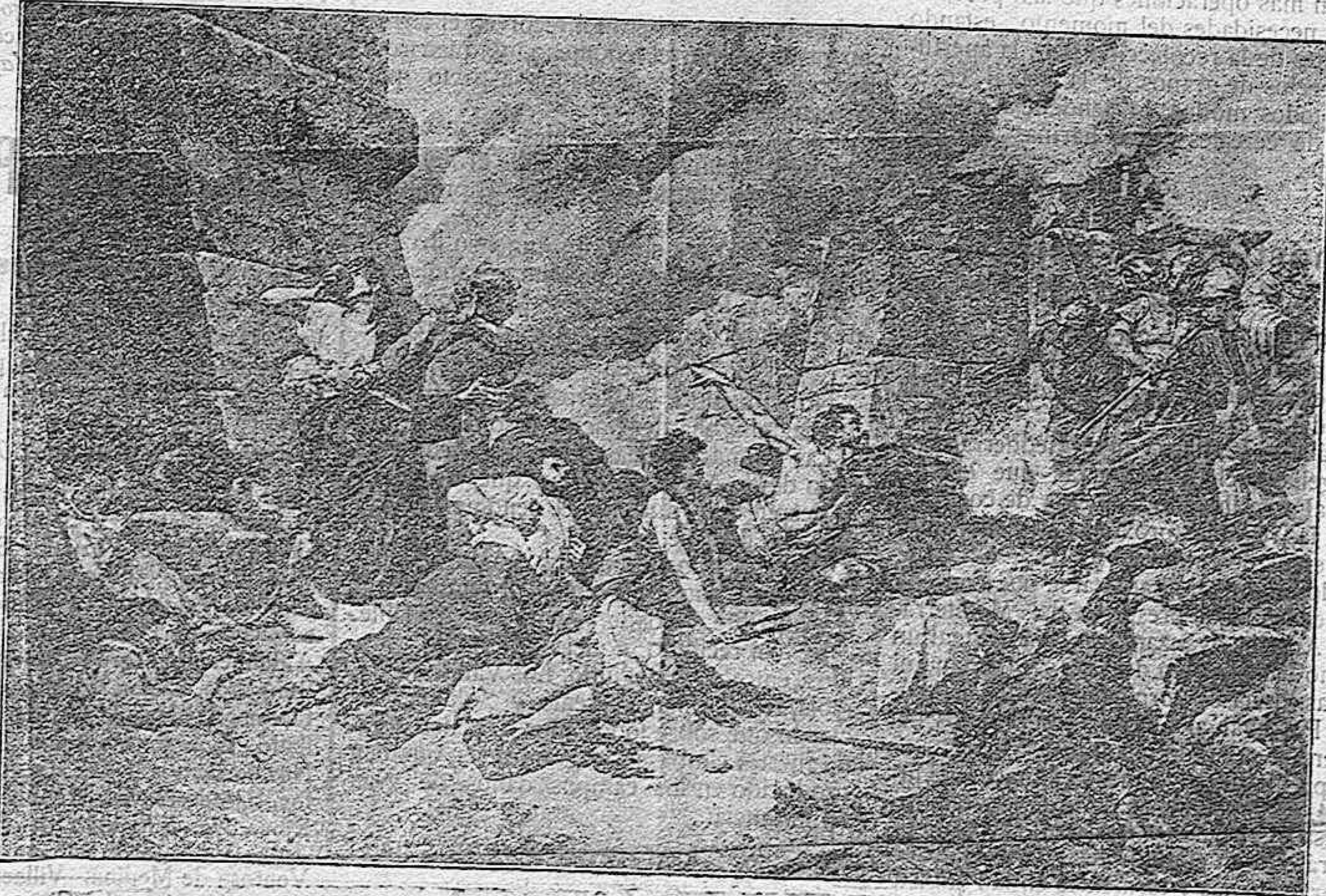
NUMANCIA! Copia del cuadro de don Alejo Vera, adquirido por el Estado. (Núm. 694, del Catálogo.)

Se ha operado importante concentración de moros enemigos en el camino de Tánger por la parte de Fondak, y en Uad-Rás. Sus avanzadas hacen diariamente disparos sueltos sobre los soldados que trabajan en las carrateras y sobre los destacamentos,