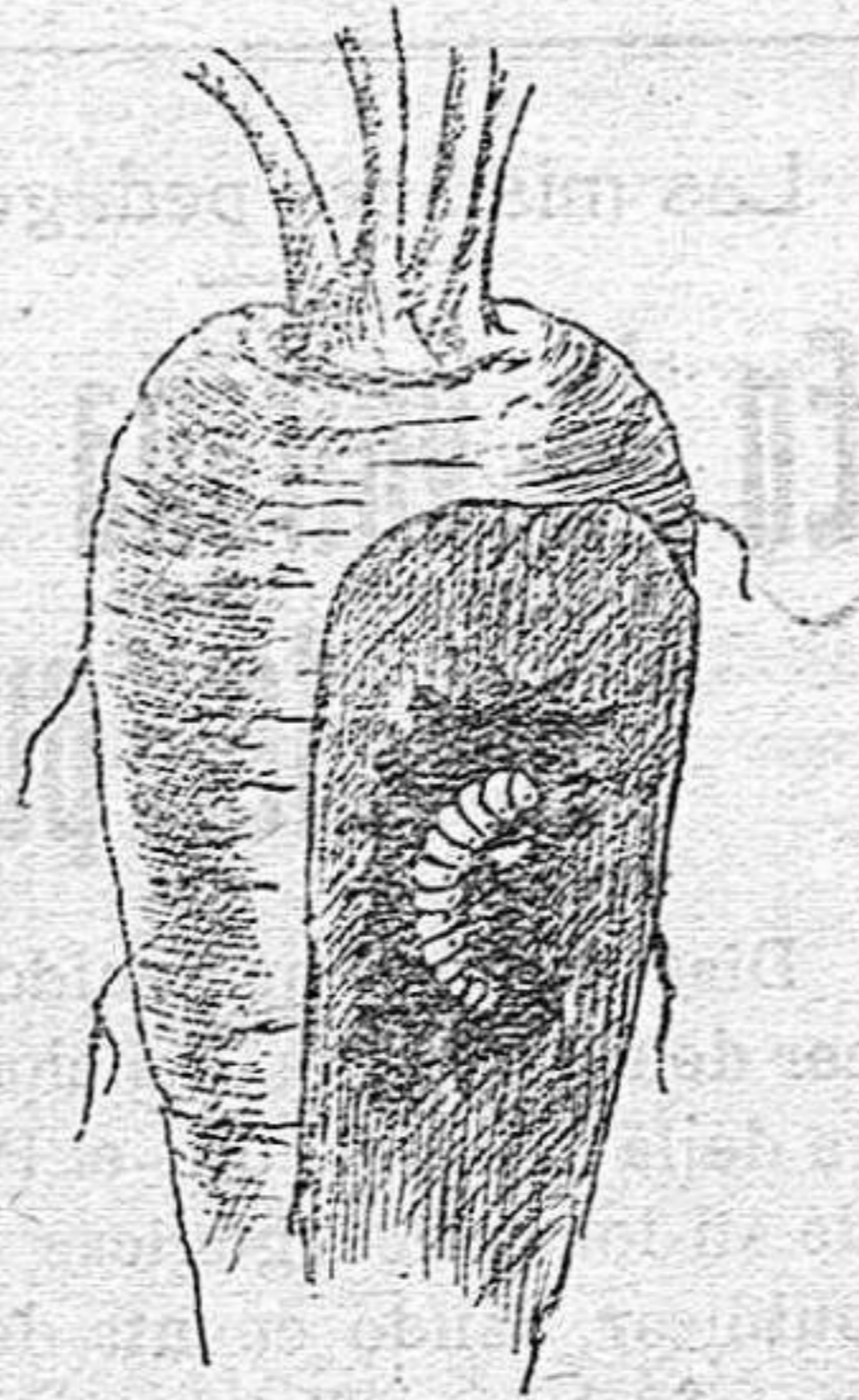
Raíz atacada por la larva de la mosca de la zanahoria

cuando y al anochecer, los palos, perchas y lugares en que las gallinas se posan, con sulfato de nicotina. Al siguiente día podrá comprobarse la existencia de unos piojos muertos, sea en el suelo o entre las plumas.