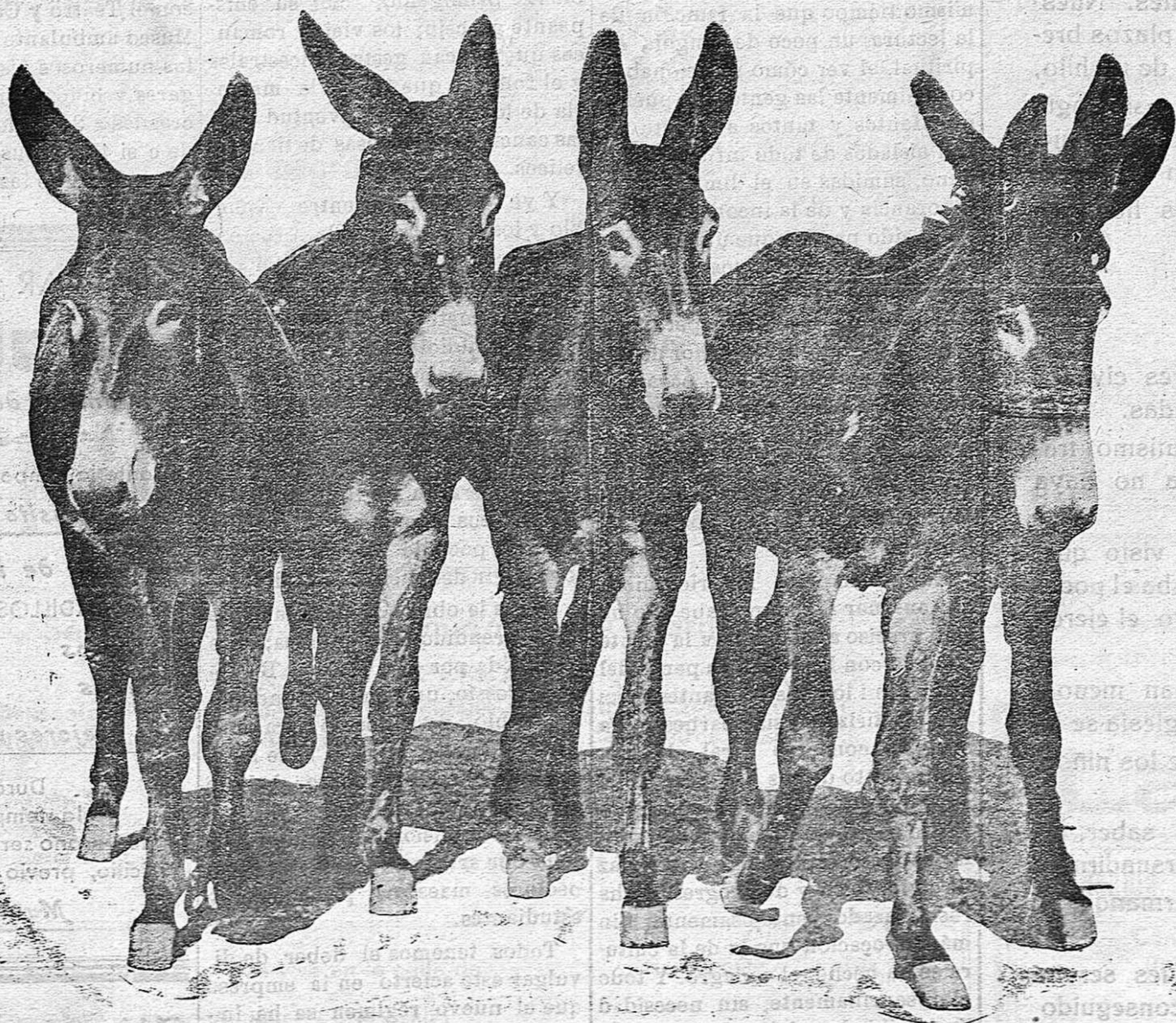
Este lote de burras catalanas, de excelente conformación y desarrollo han sido objeto de reciente contratación

Como el estiércol que se utiliza en nuestro país es de mediana calidad y se usa en cantidades insuficientes, su empleo no excluye el uso simultáneo de fertilizantes minerales, sino al contrario, debe completarse siempre con éstos, pues está demostrado que los mejores resultados se obtienen con el abono mixto, esto es, completando el estiércol con abonos químicos apropiados, sobre todo, fosfatados y potásicos.