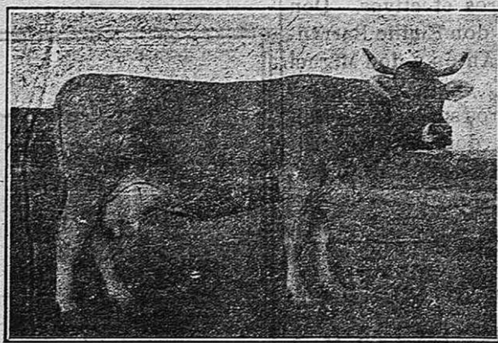
La vaca «Ella», que en 365 días dió 10.356.265 Kilos de leche con 4,28 por 100 de manteca.

años de la «batalla del trigo» 1926 al 33, un total medio de 65.801.575 quintales, rendimiento unitario medio de 13,4 quintales.