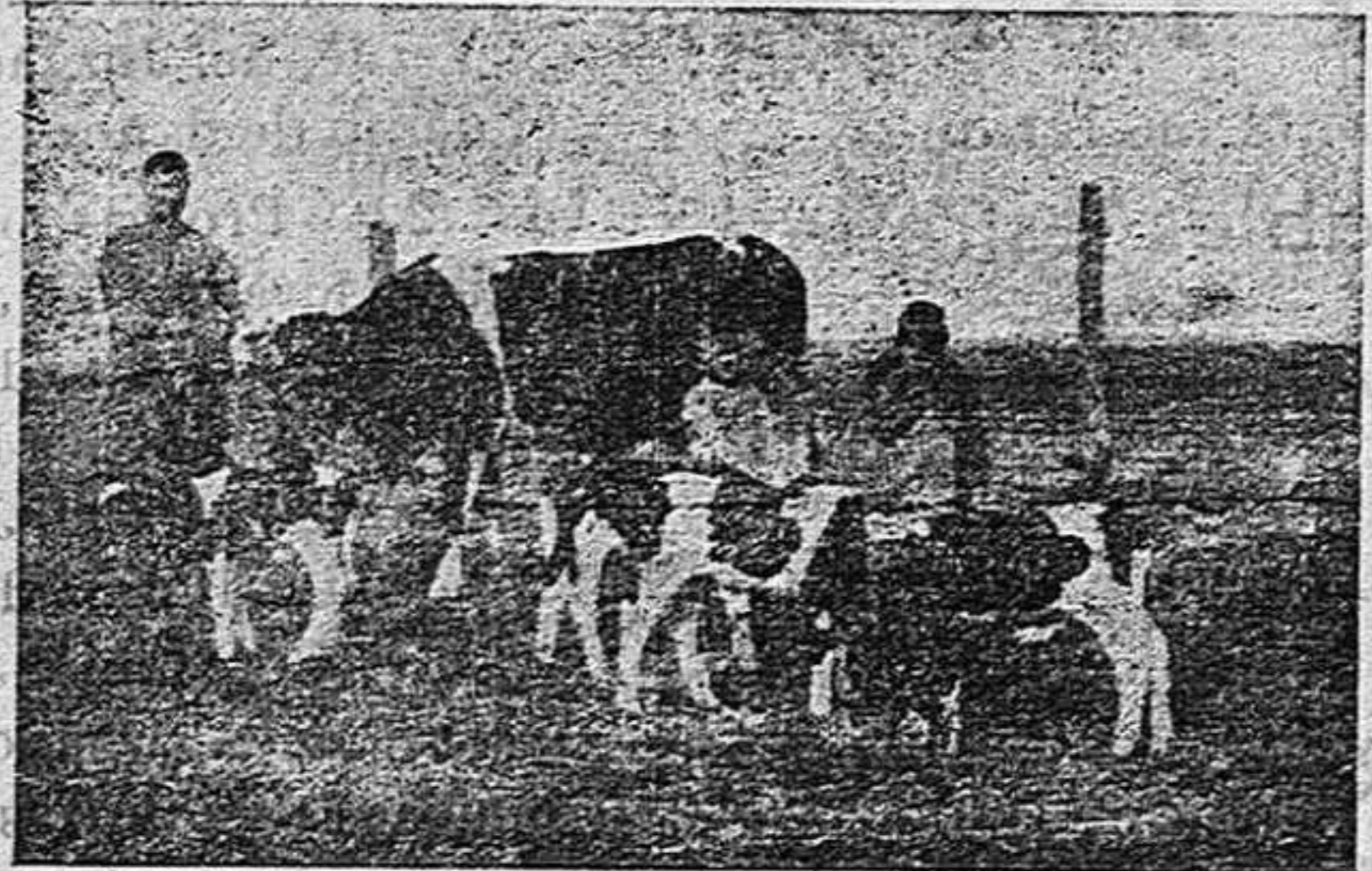
He aquí una magnífica vaca acompañada de los cuatro terneros que dió en el último parto hace unos meses.

No puede tolerarse que los intereses de especuladores de este producto estén por encima de los legítimos de nuestros campesinos, que se ven obligados a vender el dorado producto en bajas condiciones, después de los esfuerzos titá-