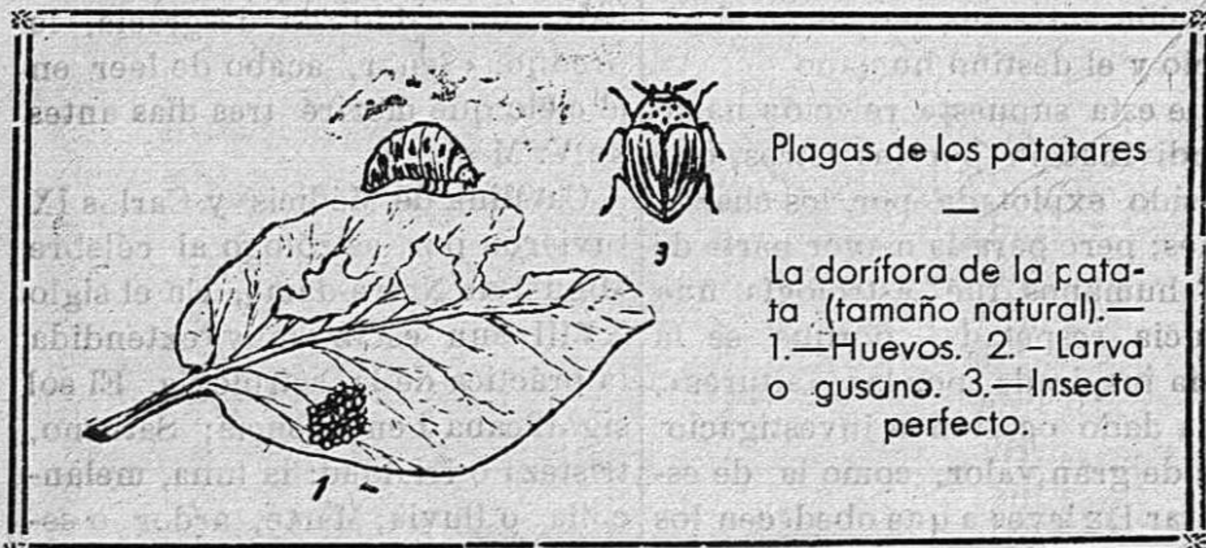
Plagas de los patatares