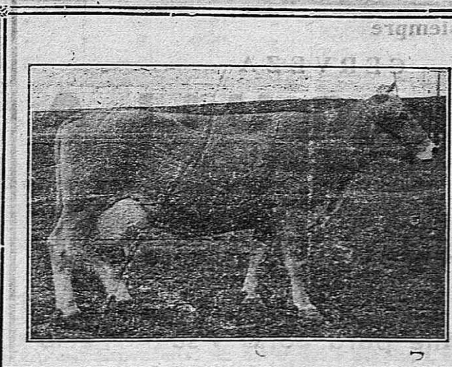
Corresponde a la presente silueta a la vaca Netty excelente ejemplar que en 365 días dió 10.768,715 kilos de leche con 4,012 por 100 de manteca