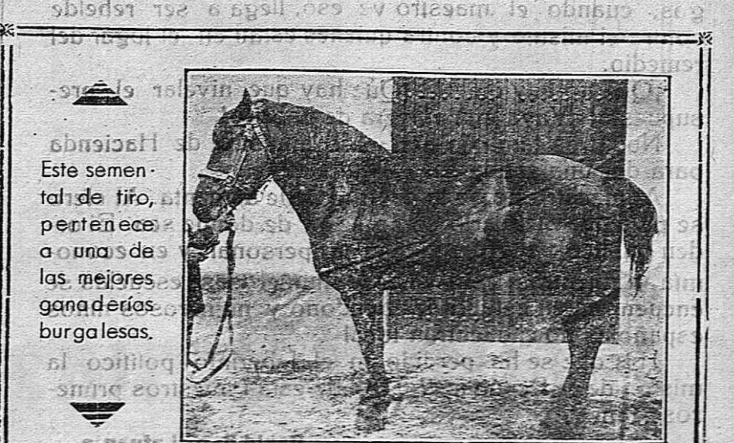
Este semental de tiro, pertenece a una de las mejores ganaderías burgalesas.

Propósito de ello, nosotros estaremos de los demás colegas mencionen nuestro periódico en iguales circunstancias.