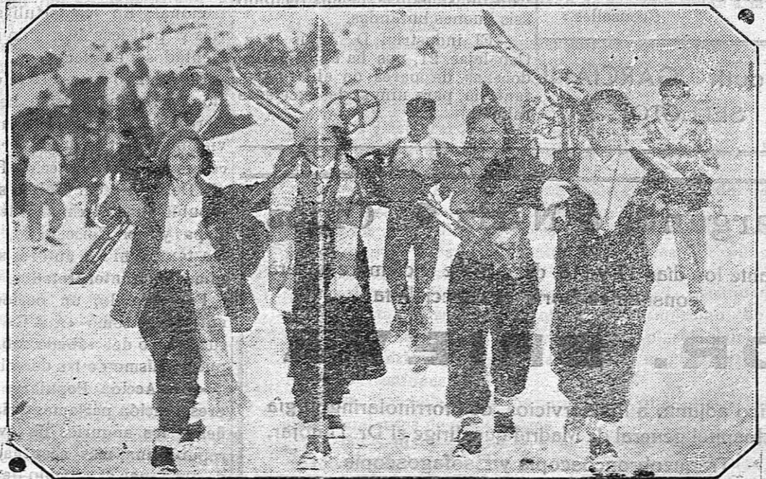
Los deportes de la nieve cuentan con una legión de entusiastas m jercitas que pertrechadas ad hoc escalan las cumbres seguidas, como puede verse, de algunos amateurs de la nieve y... de las intrépidas esquiadoras. Ellas, con su eterno femenino, matizan el «frío» ambiente de las alturas y prestándole el concurso de su belleza hacen más atractivo el arte de esquiar.

He aconsejado al Presidente de la República que se constituya un Gobierno de concentración republicana, presidido por el señor Lerroux, asegurándole que podría