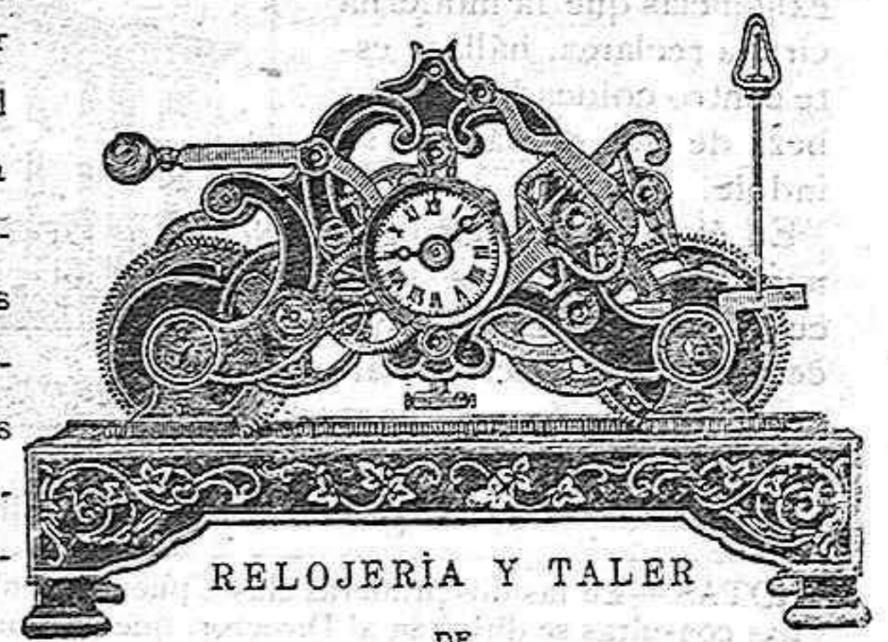
RELOJERÍA Y TALER DE

22 Grande error es el escatimar el precio de un trabajo que no conocéis, pero todavía es mayor encomendarlo á quien, quizá es tan incapaz como vosotros para ejecutarlo.