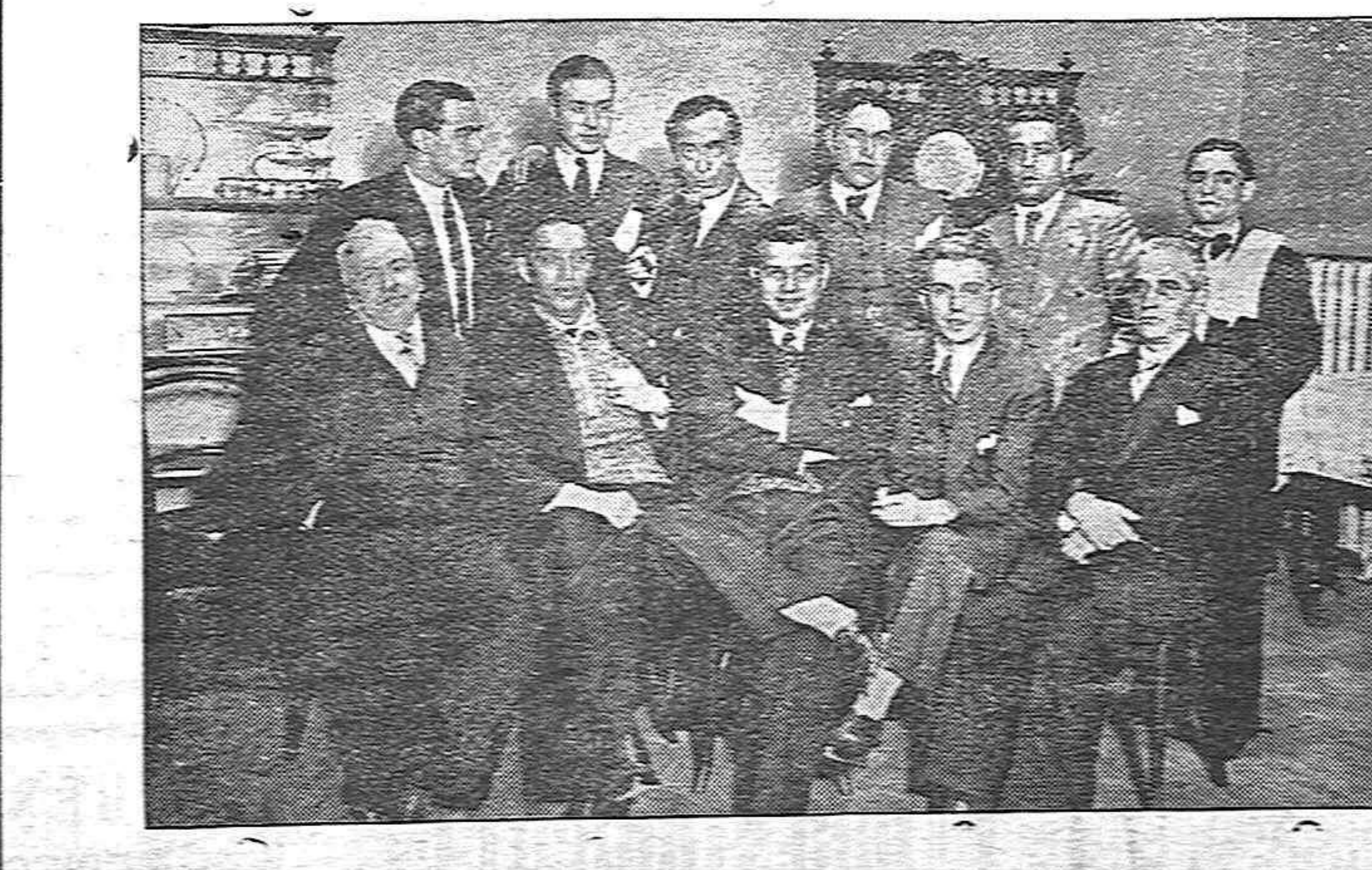
Periodistas y empleados de administración de los diarios locales, reunidos anteayer en fraternal comida íntima, después de la Junta celebrada por la Asociación de la Prensa

Del suceso se dio cuenta al Juzgado correspondiente.