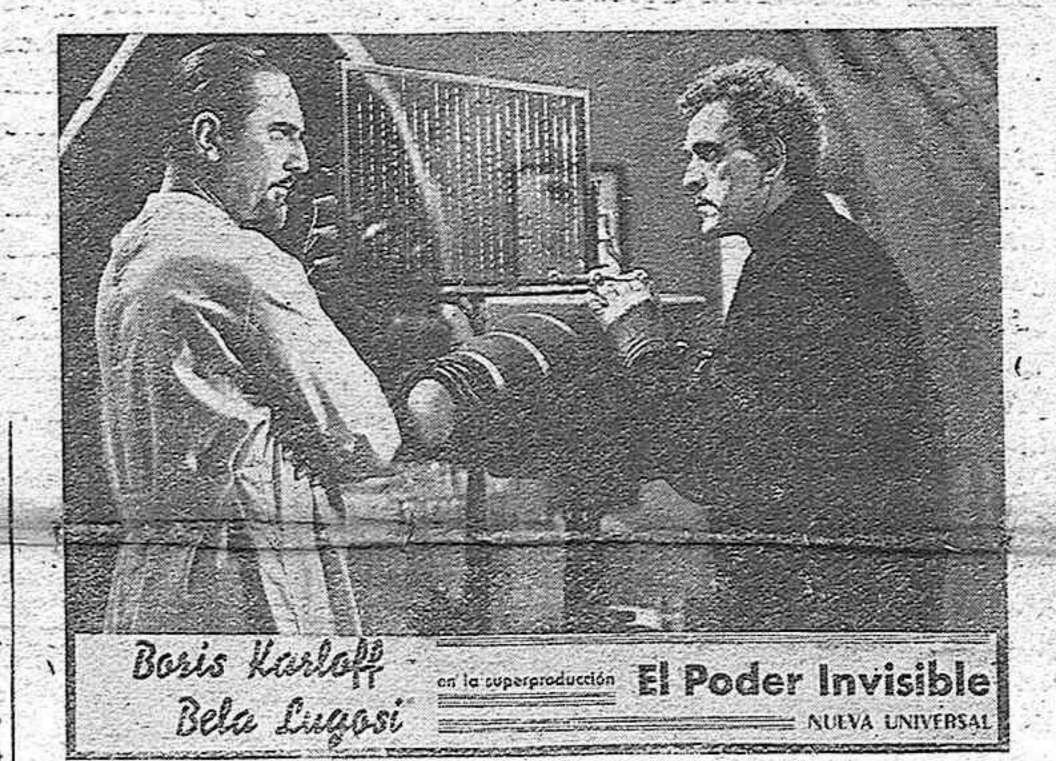
Boris Karloff Bela Lugosi EN EL «ORTEGA»