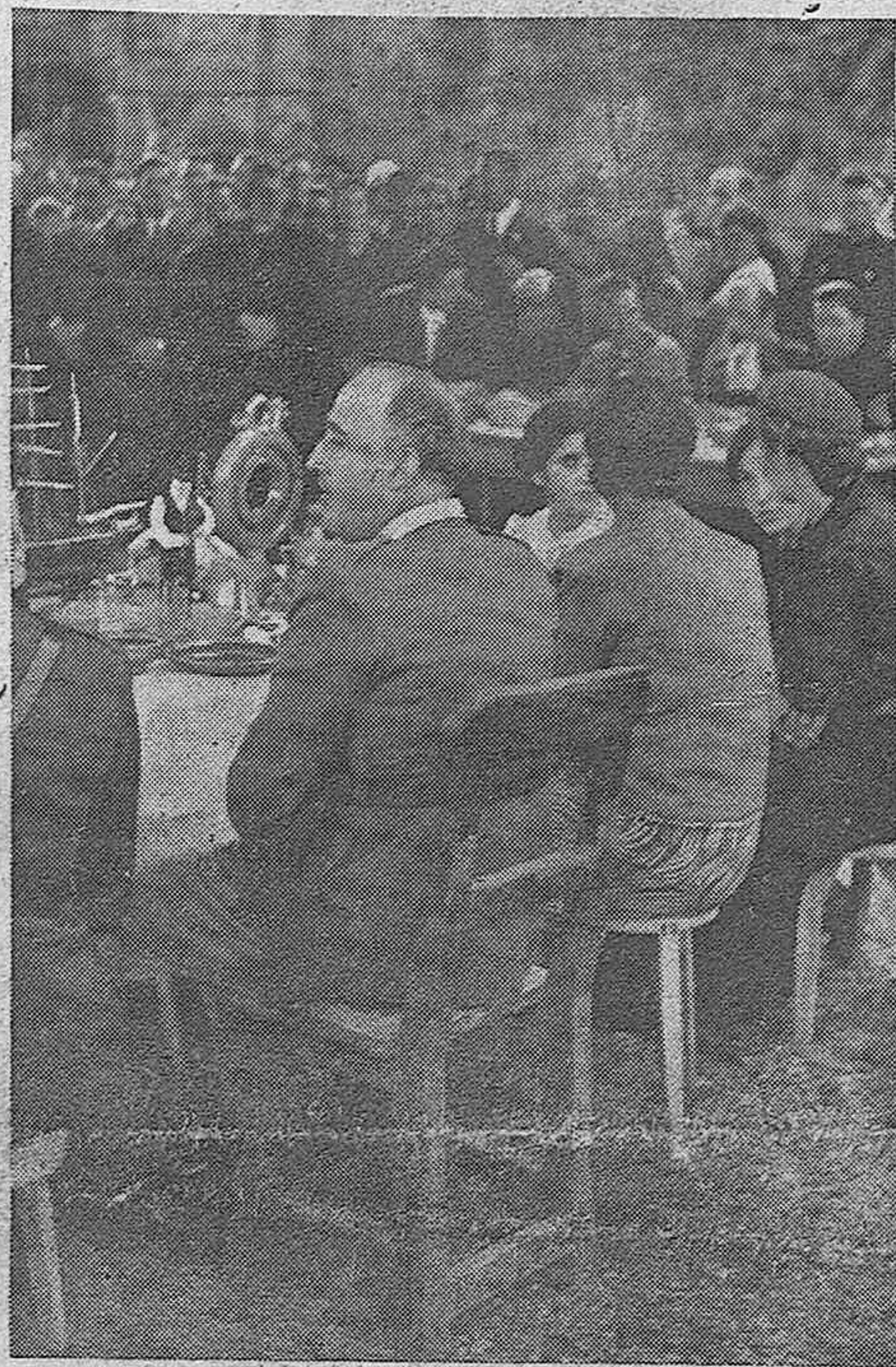
Una de las etapas del viaje triunfal del Caudillo por Galicia ha sido la visita al humilde pueblo pesquero de Cayón, en donde S. E. aceptó una merienda típica, con que le obsequiaron los pescadores.