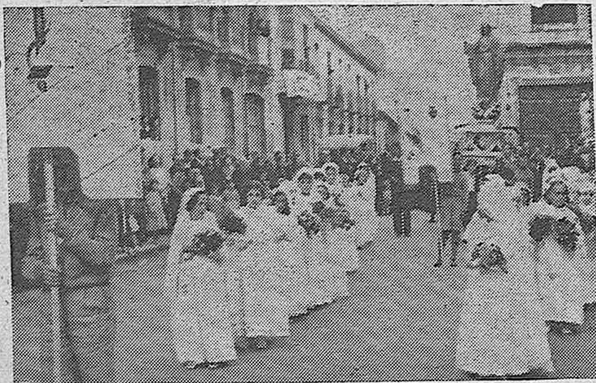
Un aspecto de la procesión en su recorrido por nuestras calles