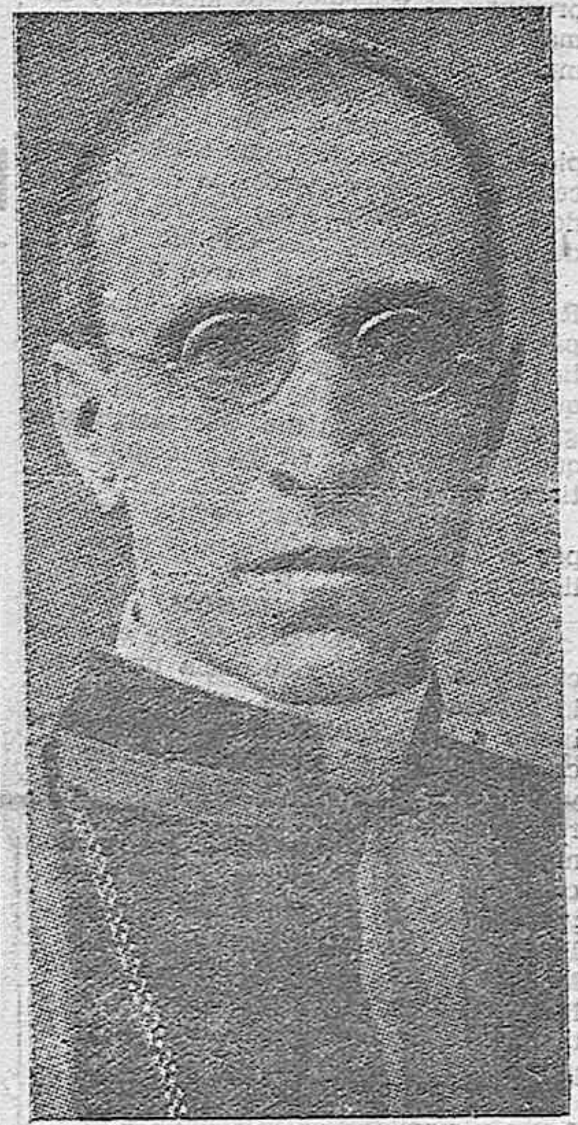
(información en cuarta plana)

FUE COMUNICADO AYER POR TELEGRAMA DEL MINISTRO DE ASUNTOS EXTERIORES A LA SECRETARIA DE AQUEL ORGANISMO BURGOS, 9 (1 madrugada).—En el día de hoy, el Ministro de Asuntos Exteriores de España, ha cursado a la Sociedad de Naciones, en Ginebra, el telegrama siguiente: «En nombre del Gobierno Español, tengo la honra de comunicarle que España notifica por el presente telegrama su retirada de la Sociedad, de conformidad con el artículo 1.º párrafo 3.º del Pacto. Firmado, Jordana, Ministro Asuntos Exteriores».