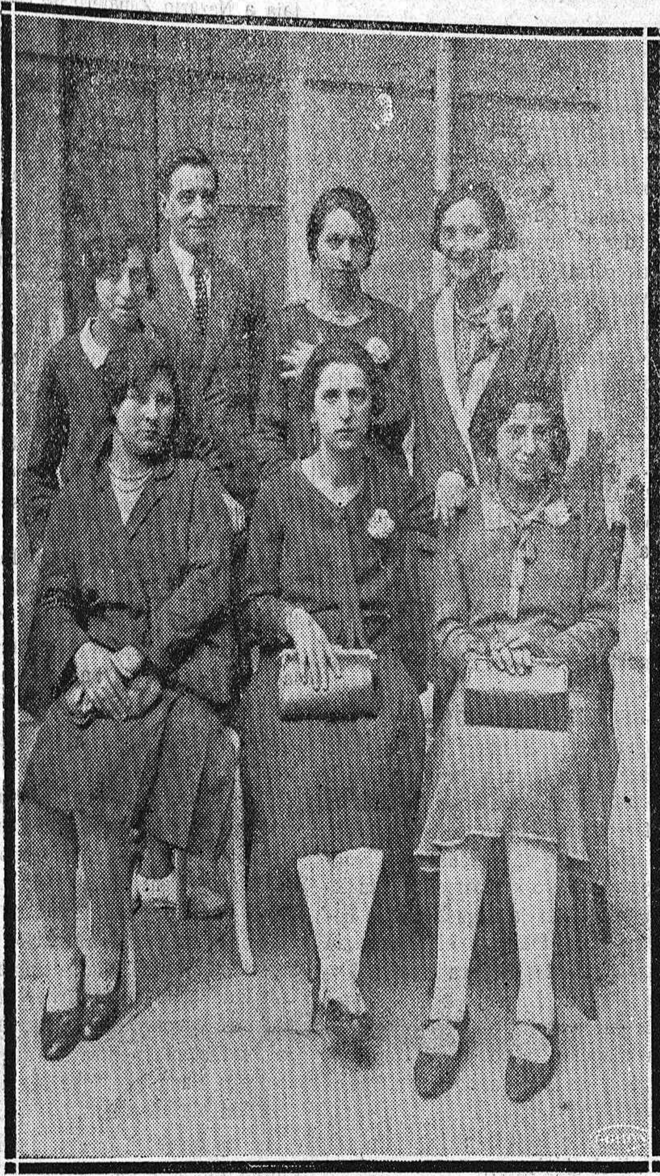
Grupo que integra el simpático cuadro artístico de los Sindicatos Católicos