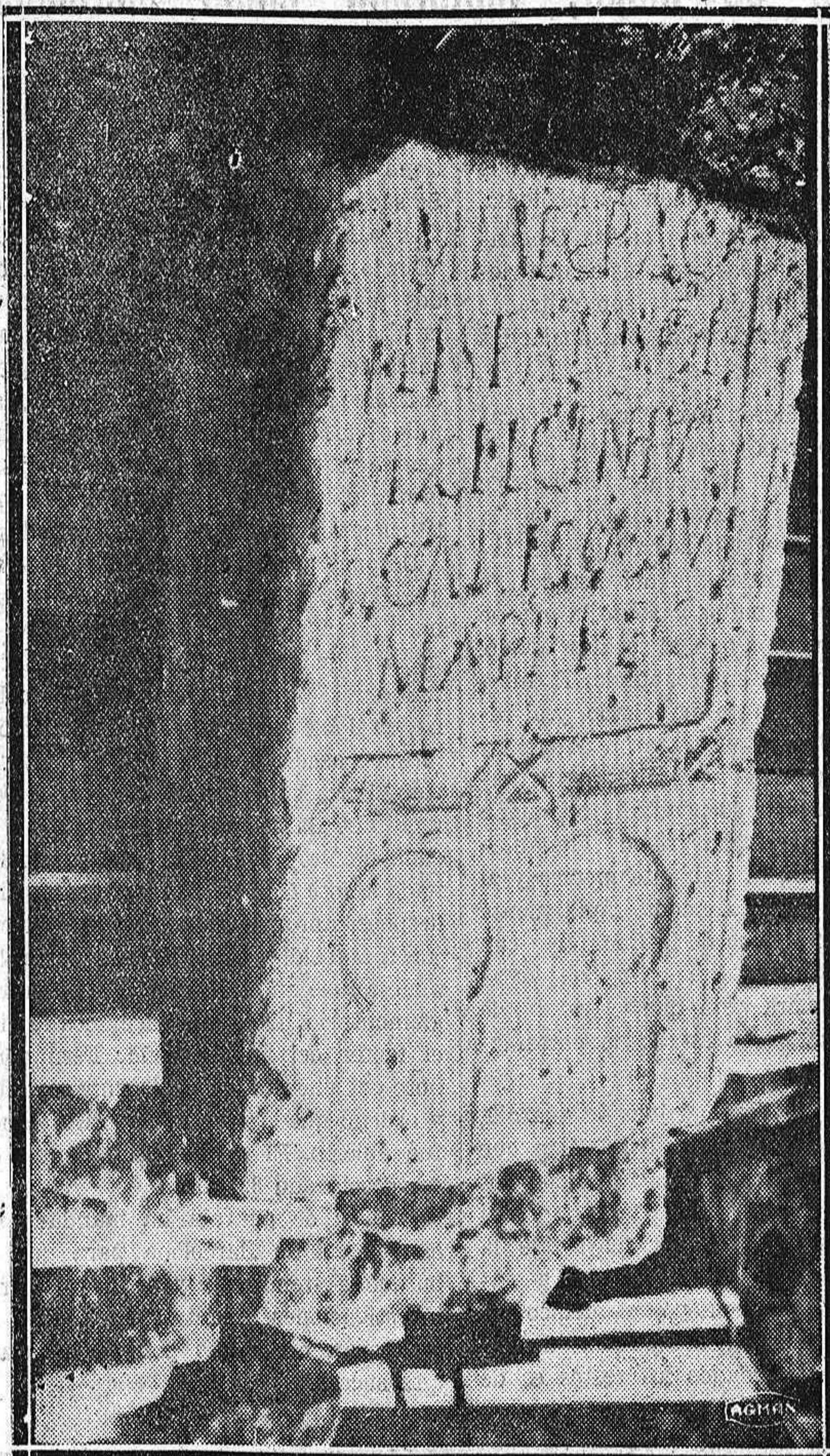
Lápida de origen romano, hallada en las recientes excavaciones verificadas en esta capital y sobre la cual publicamos un sustancioso artículo de interpretación, de nuestro distinguido colaborador R. S.

Esta vía provisional debió haber sido levantada una vez realizados los aludidos transportes, pero por orden de la Alcaldía barcelonesa, se dejará hasta el día 7, por si se necesitara el transporte