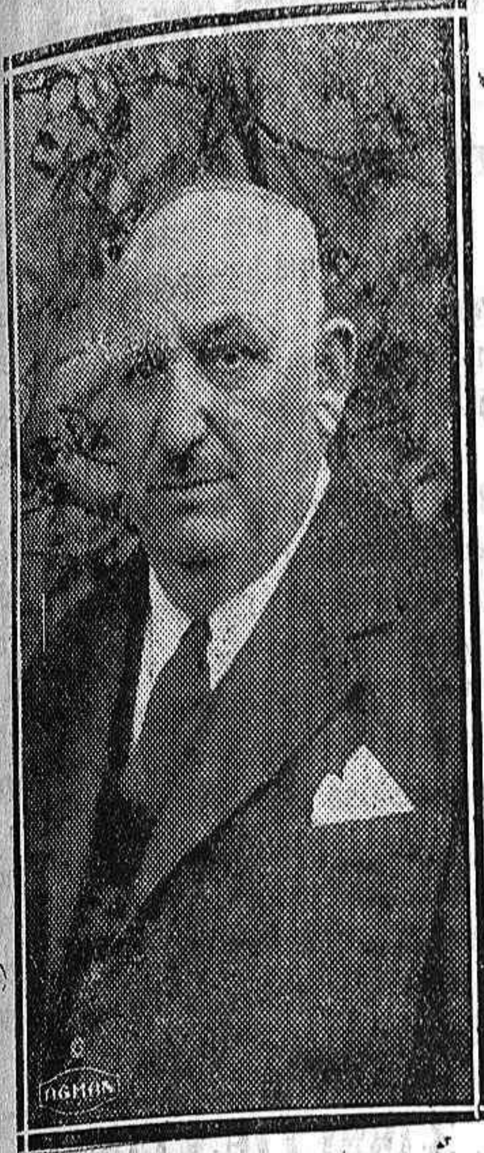
El activo y popular alcalde de Herrera de Pisuergra

Al habla con el señor alcalde.--Obras importantes que se han realizado.--Por un empréstito local, que importará 224.000 pesetas, se va a construir el alcantarillado y se hará la acometida de agua a las casas