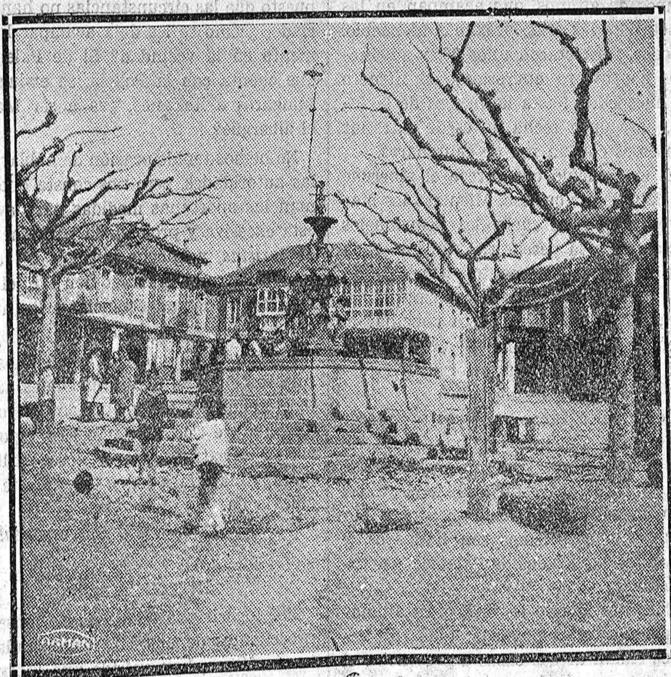
Herrera de Pisuergra.—Una plaza