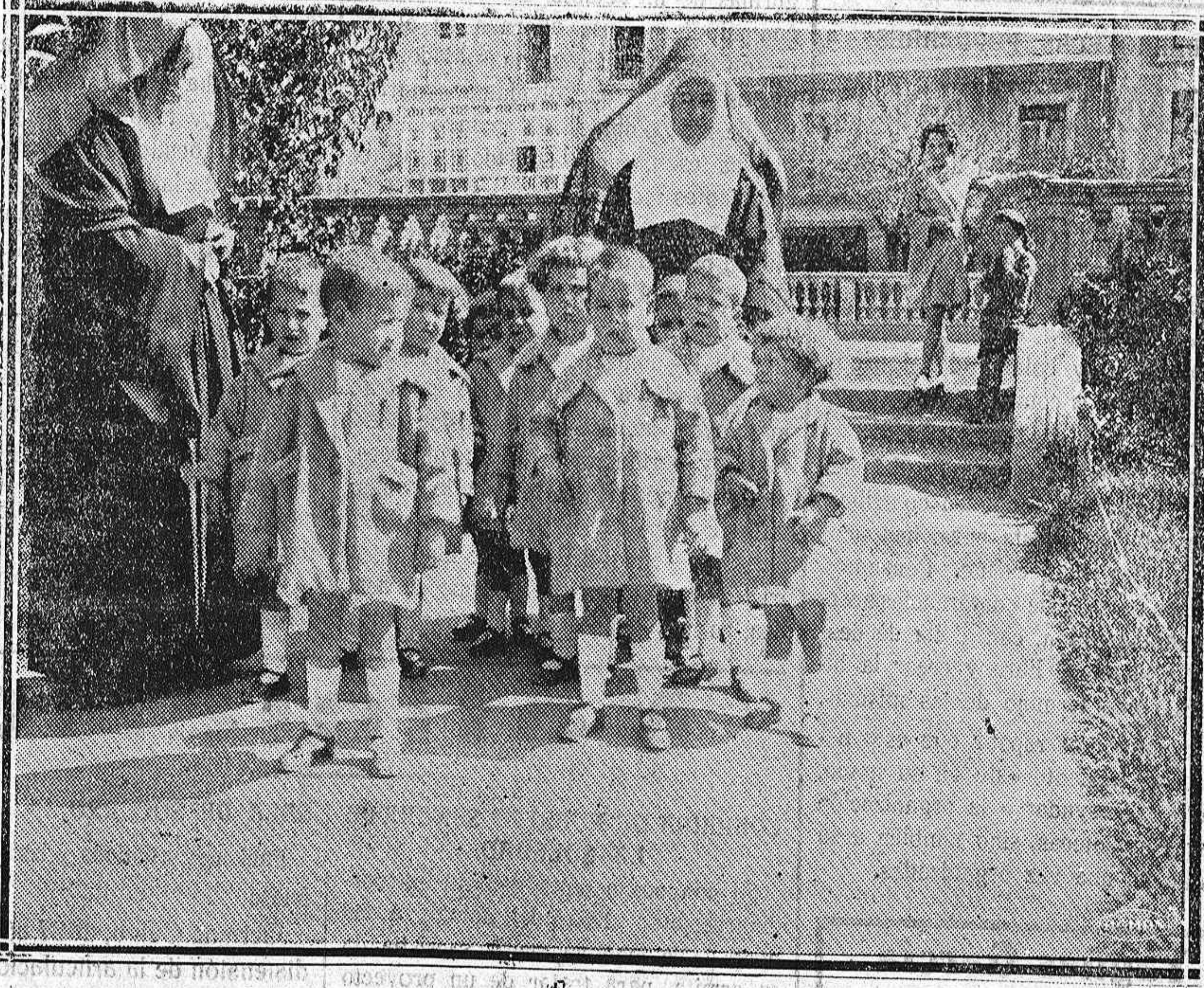
En el Hospicio.—La parvada de ángeles