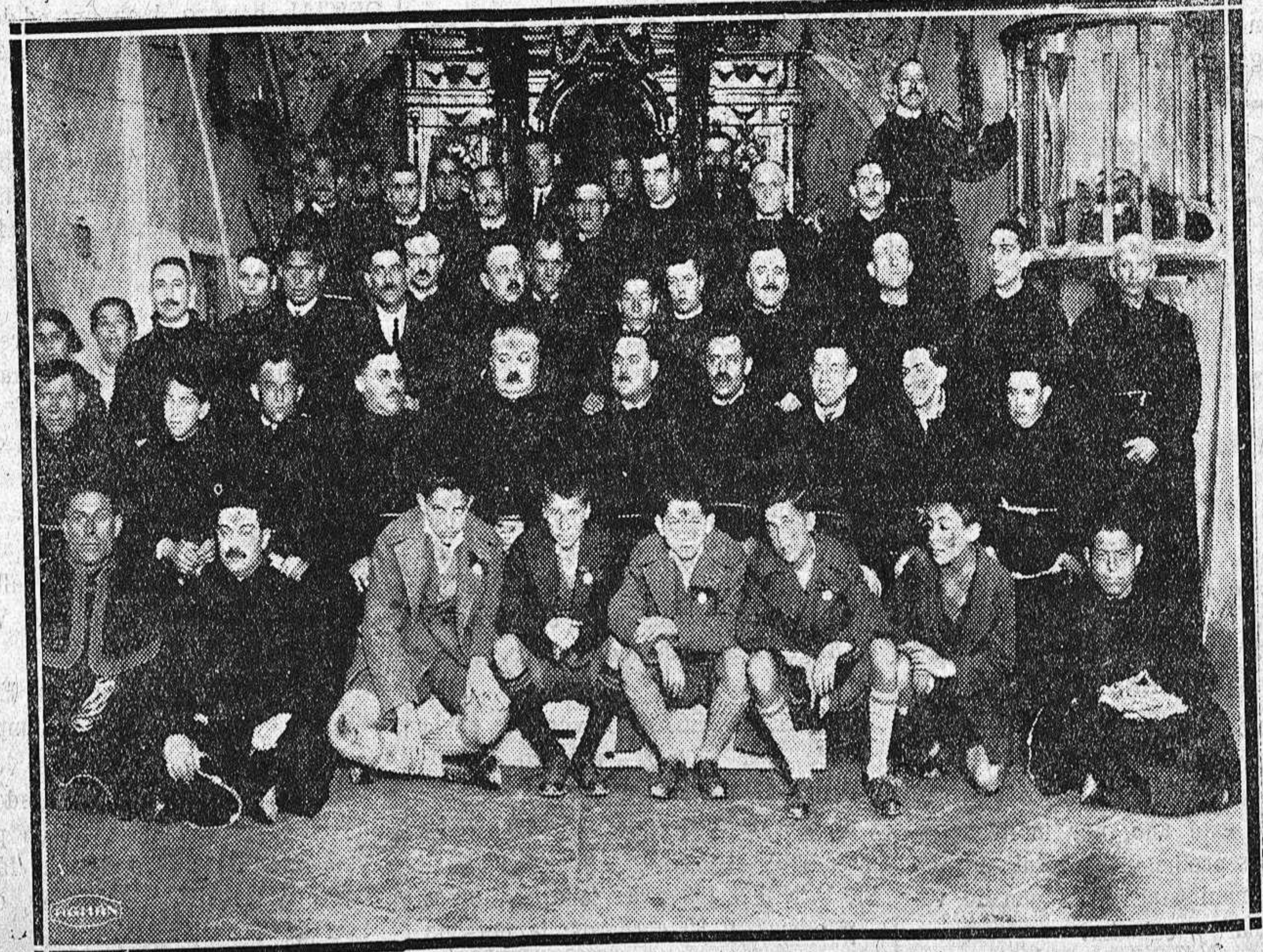
Las cofradías de Palencia.—La del Santo Sepulcro

La peña taurina de Marcial Lalanda, de la vecina ciudad, ha prometido asistir en pleno a nuestra corrida.