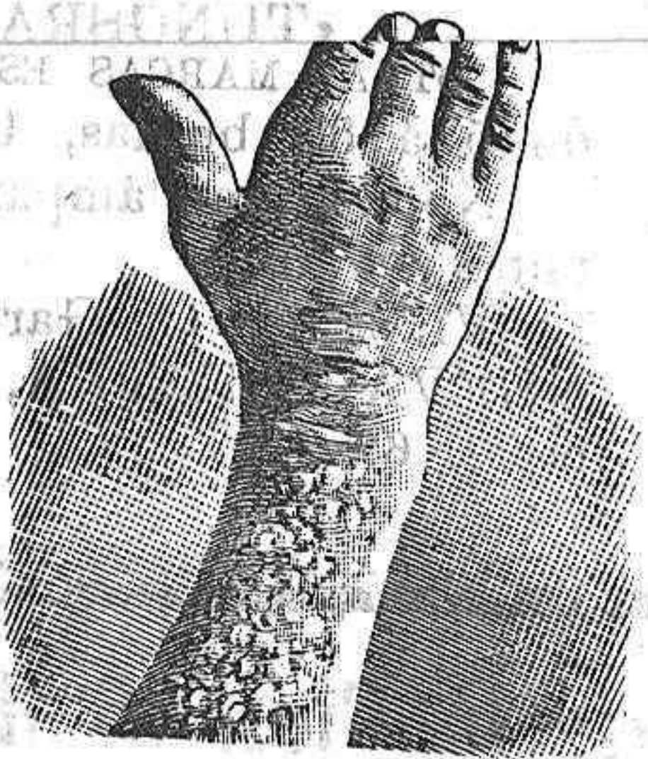
Antes de la curacion