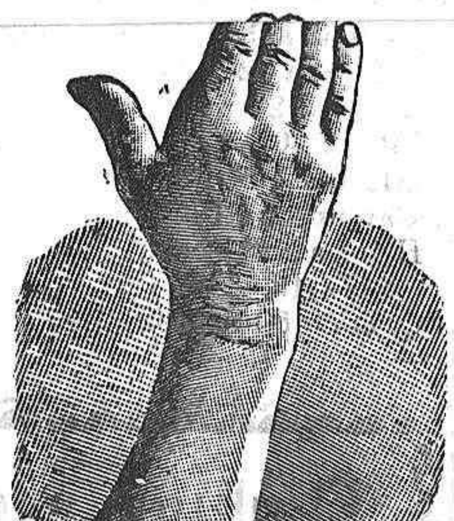
Después de tratamiento