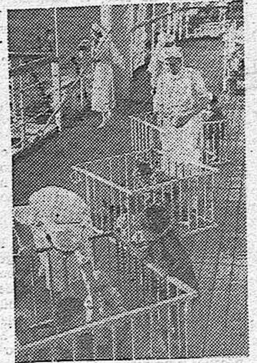
A bordo del «Sardegna», que lleva a Libia a las familias de los colonos italianos, los niños son atendidos amorosamente por damas enfermeras.