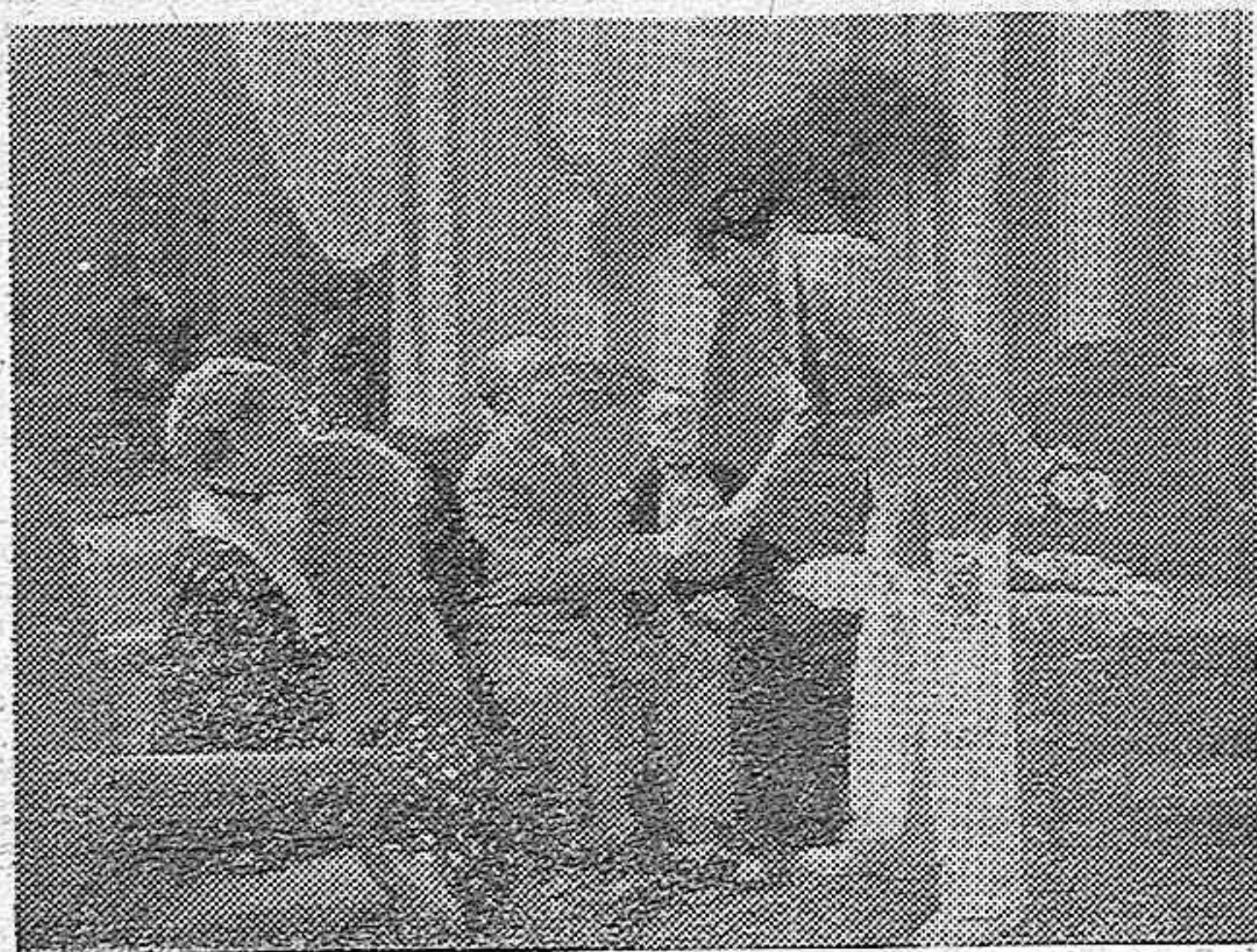
«No quiero, no quiero...» constituye un éxito de la productora nacional «Cifesa»