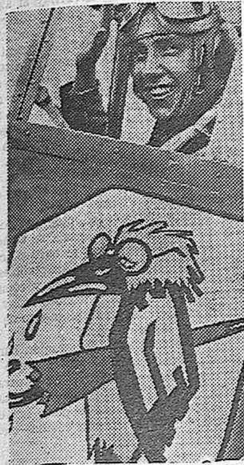
Este joven aviador alemán lleva en su aparato un dibujo jocosos, que quiere representar al señor Chamberlain con su famoso paraguas.

BUCAREST, 14.—El Rey Carol ha convocado al Parlamento, para el día 25 de noviembre en sesión extraordinaria. El ministro de Negocios Extranjeros, Gafenco, informará a sus colegas sobre la situación internacional.—EPE.