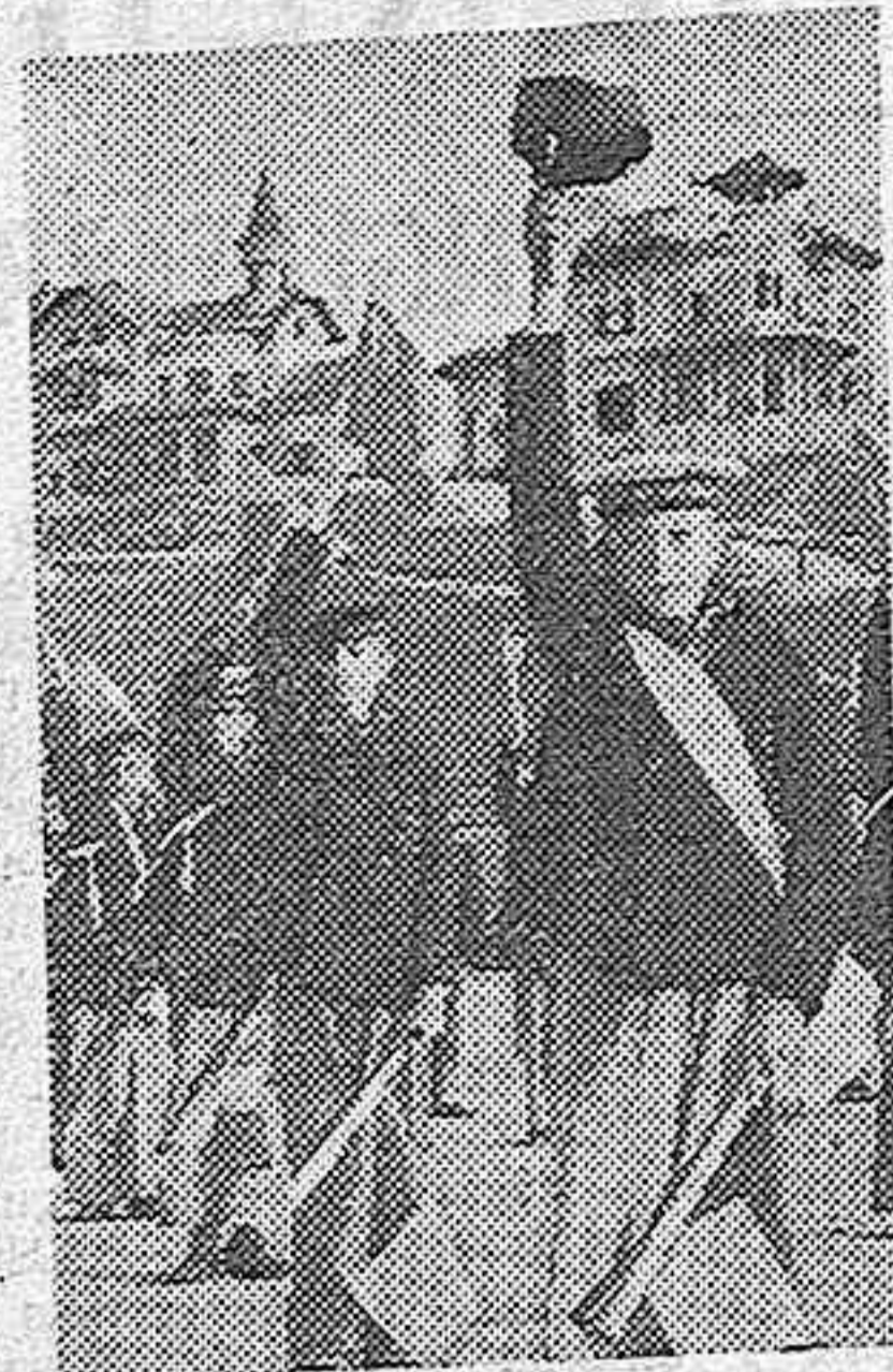
En los altos del Hipódromo en Madrid los flechas navales practican los ejercicios de banderas, que realizarán en la II Demostración de Organizaciones Juveniles