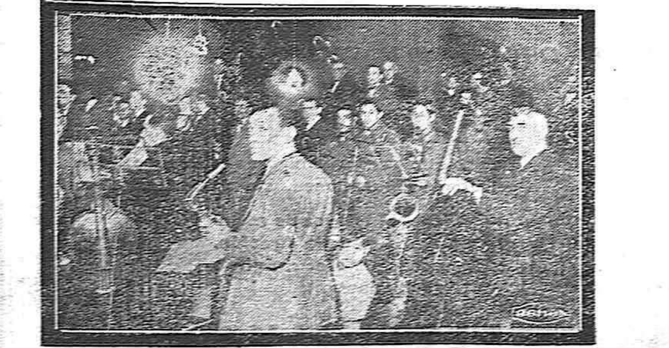
Orquesta y coro formado por la Capilla de la Catedral y elementos de la Coral Palentina que cantaron la misa de Sta. Cecilia

EL DINERO DEL CAMPO DEBESER PARA DAR VIDA Y PROGRESO, REDENCION ECONOMICA Y SOCIAL AL CAMPO