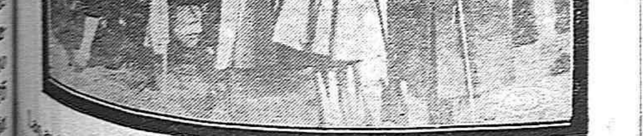
Las autoridades palentinas dirigiéndose a la iglesia de San Francisco, para asistir a la fiesta de Santa Cecilia