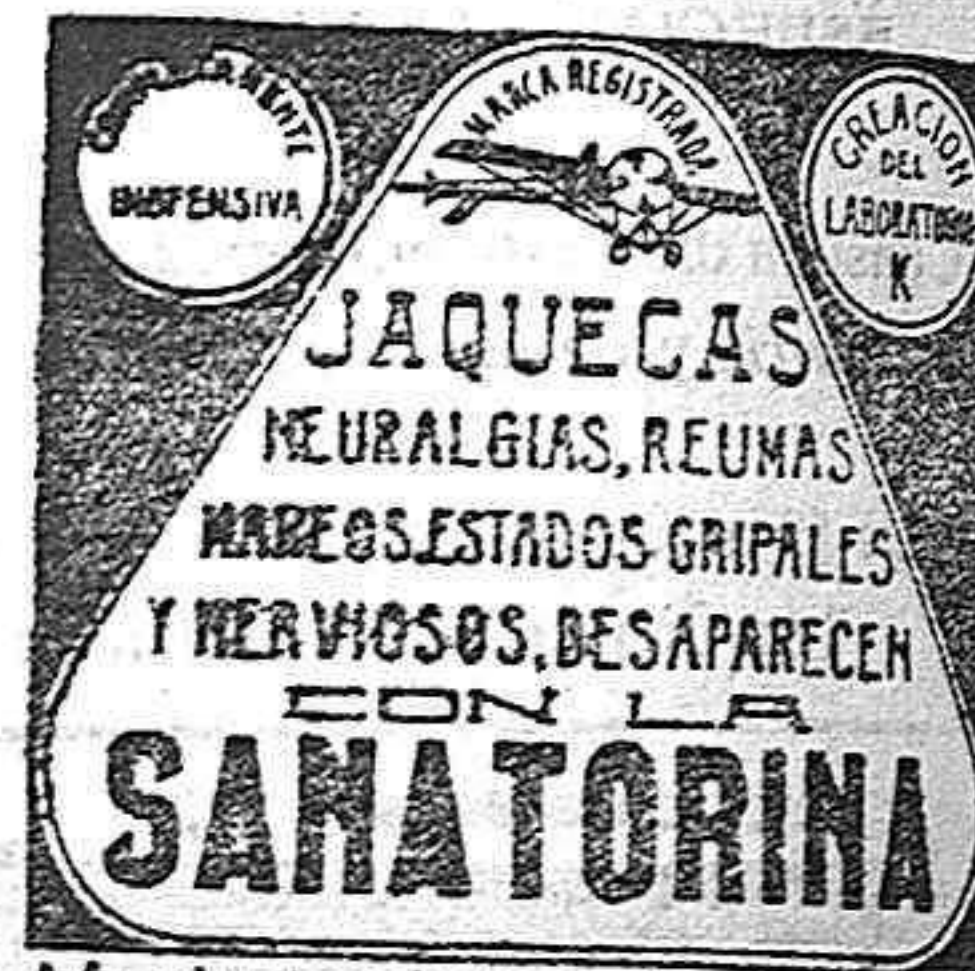
En Compañía y Repartición. Por mayor y menor. En todas las farmacias y droguerías. En la Editorial Gráfica Española, Fuencarral, 26, Madrid.

Las mujeres circasianas (las más bellas del mundo) y las de la Grecia antigua, lograron aquellas bellezas inmortales empleando solamente los procedimientos del doctor Oscar Krösz. Las fórmulas del doctor Oscar, detalladas en la notable obra «Las siete alegrías de la vida», han dado la vuelta al mundo, y su precio económico (5 pesetas), las pone al alcance de todas las fortunas. Dicho importe deberá remitirse por giro postal en sellos de 0'15, añadiendo 35 céntimos para el franqueo certificado. Los pedidos deberán dirigirse a nombre del Sr. Director de la Editorial, Fuencarral, 26, Madrid.