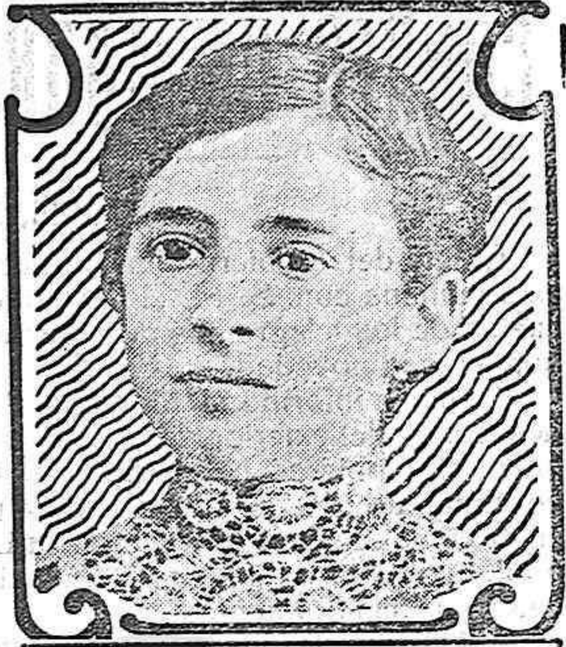
Santa Concepción Soria

A las madres inquietas por el estado de sus hijas, las Píldoras Pink restituyen la tranquilidad. En efecto, las Píldoras Pink son el sostén de las jóvenes en la edad nubil, en la formación, en el crecimiento. Las sostienen dándoles sangre rica y pura que se esparce por todas las venas y vasos, llevando a los más recónditos sitios del organismo la fuerza, la salud y la vida.