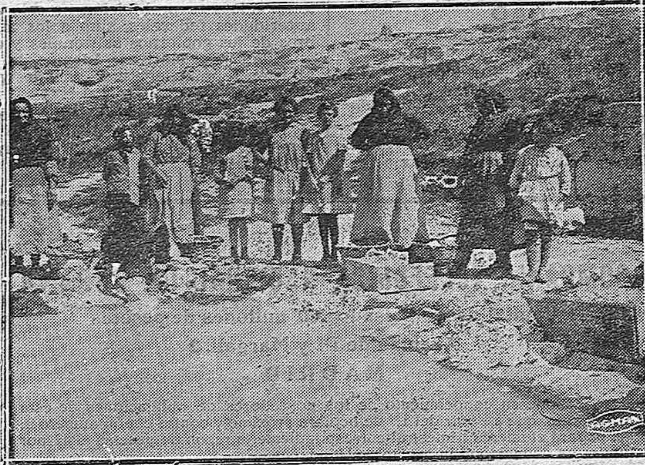
Autilla del Pino.—La hora de lavar

a la Madre Directora del Centro Filipense, calle Sto. Domingo, 6, Teléfono 263, Palencia.