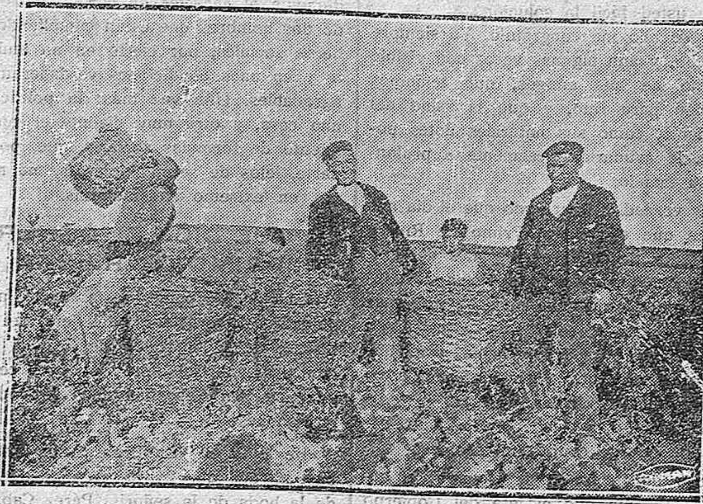
Paredes de Nava.—En la vendimia.