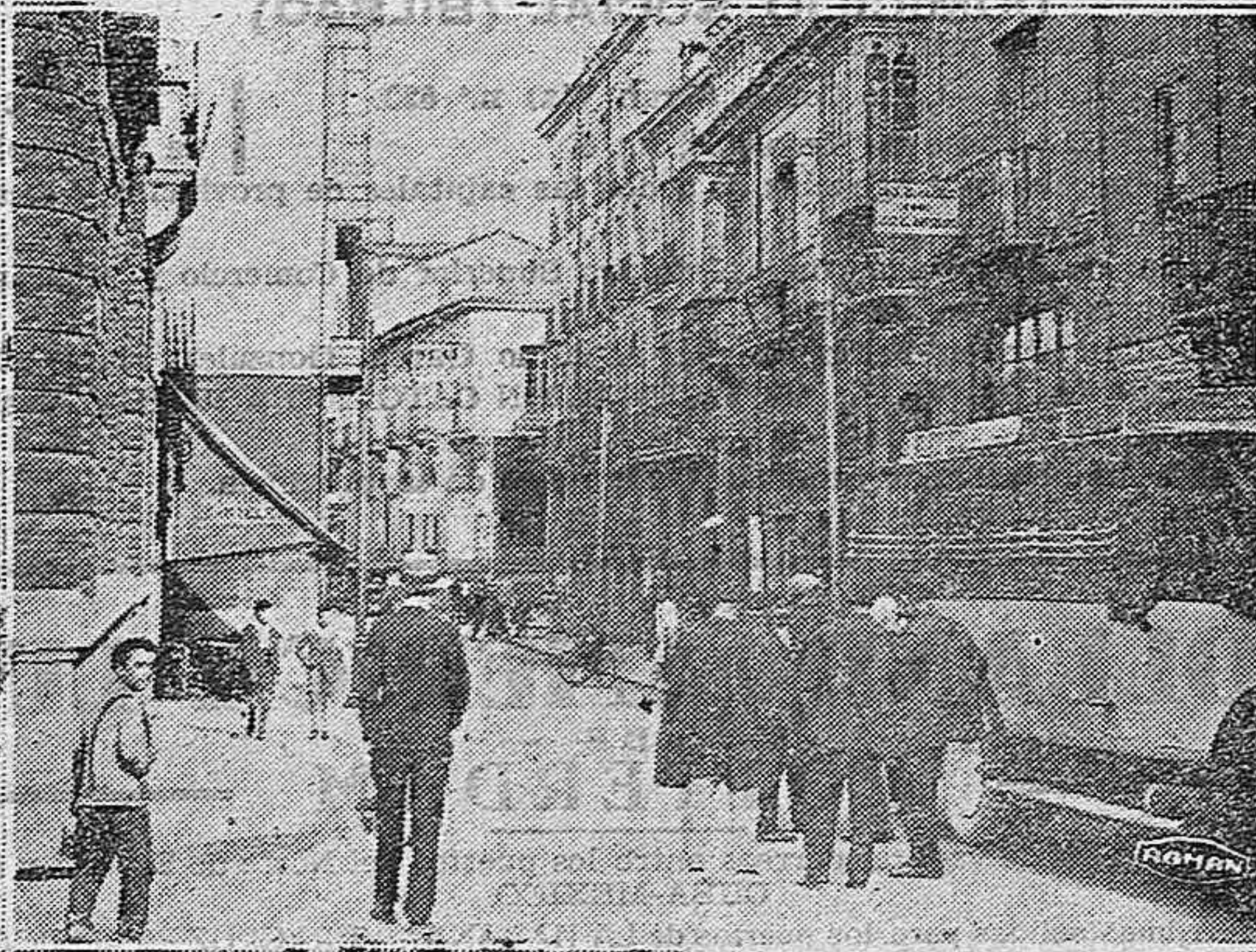
Calle del Conde Garay

Las campanas de la Compañía cobijan bajo su manto de bronce la vida de esta calle... San Paulino de Nola, que