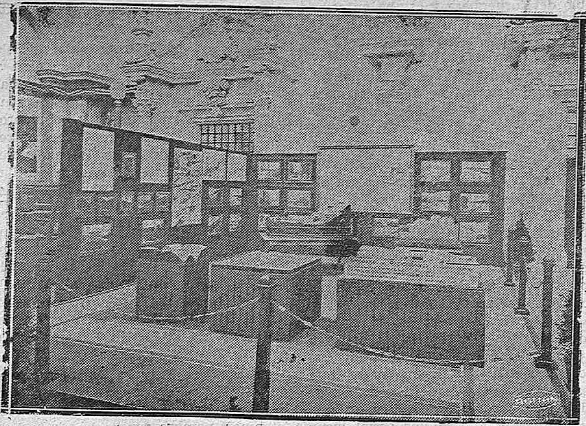
Instalación de la Confederación del Duero en la Exposición de Barcelona

Después de la operación se facilitó el siguiente parte oficial: