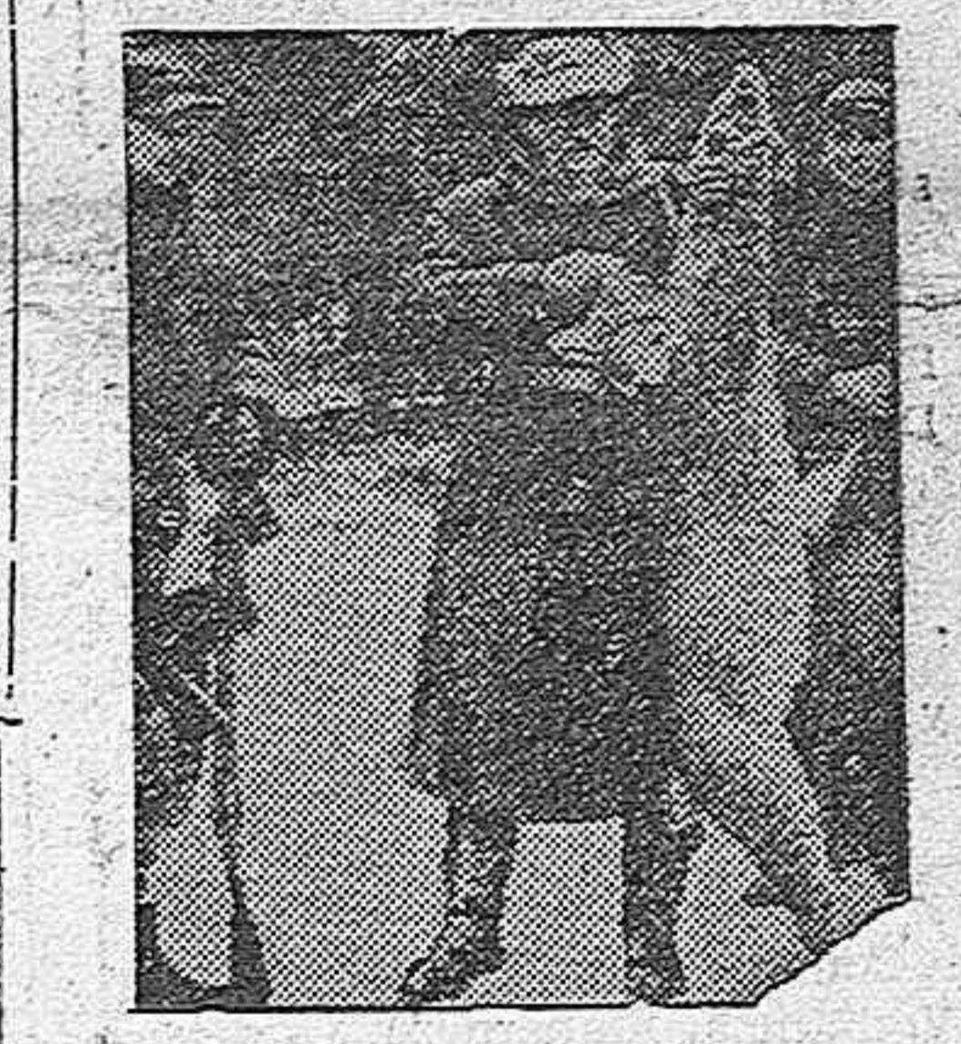
EN LA PRESENTE FOTOGRAFIA MUESTRA UN GRAN EJEMPLAR DE LINCE RECUPERADO POR SU MAGNIFICA ESCOPETA

PARIS, 7.—Los periódicos oficiales subrayan que la huida de los constituyentes del "Gobierno" rojo ha sido la señal del fin de la guerra civil en España, puesto que el paso de estos individuos por la frontera ha sido como dimisionarios.