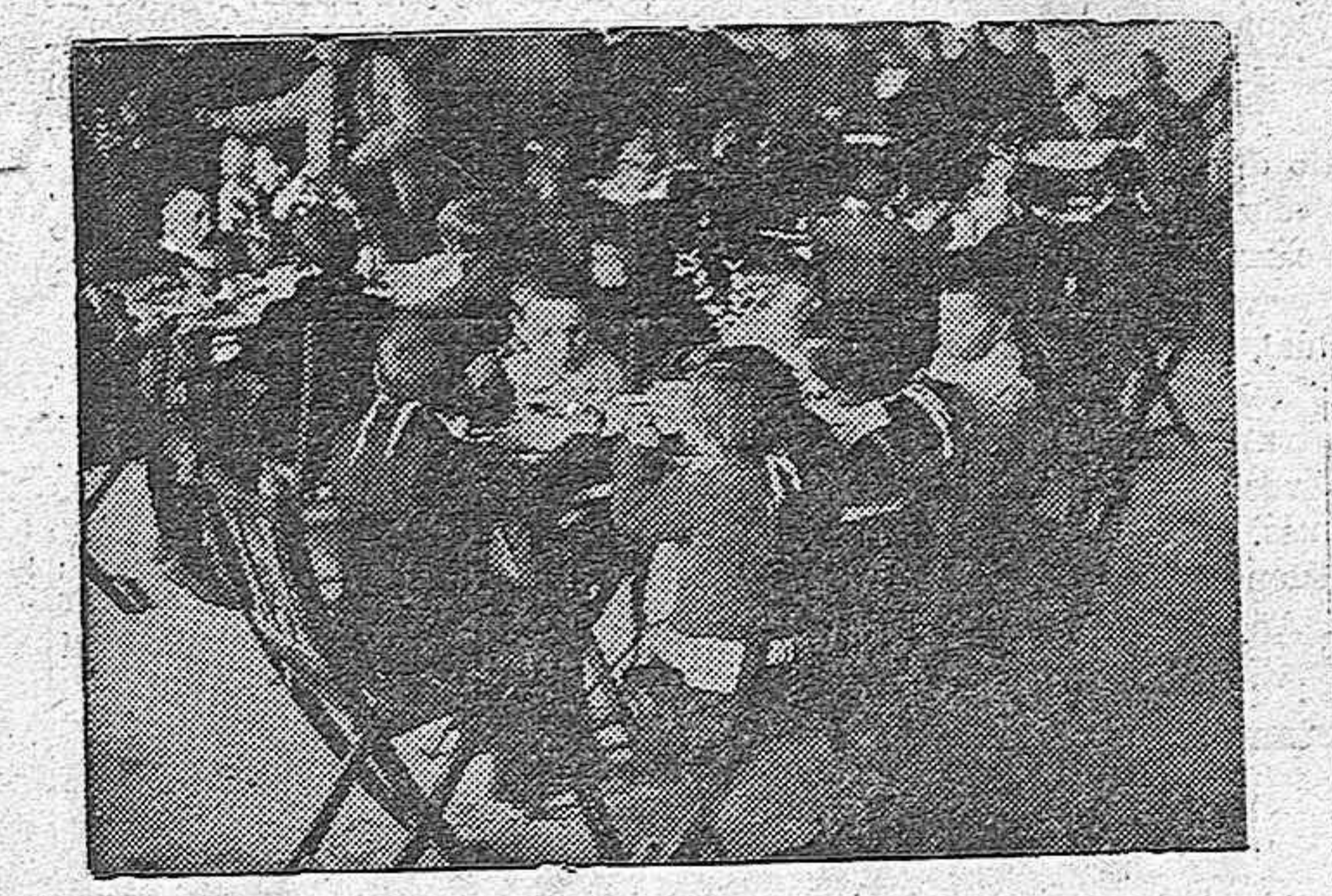
LA FALANGE LLEVA, CON LA PATRIA, EL PAN Y LA JUSTICIA DE FRANCO POR TIERRAS DE CATALUNA. LOS NIÑOS BARCELONESES YA RECIBEN LAS CARICIAS DE "AUXILIO SOCIAL"

PERPINAN, 8 (2 madrugada).—El ambiente en los medios políticos cambia a cada hora, en sentido de franca hostilidad a los republicanos y de simpatía por Franco. Hasta entre los mismos milicianos y dirigentes no se recala el hecho de que la causa de Franco gana cada hora simpatías y apoyo en todo el mundo, después del gran triunfo obtenido por sus tropas en Cataluña.—Logos.