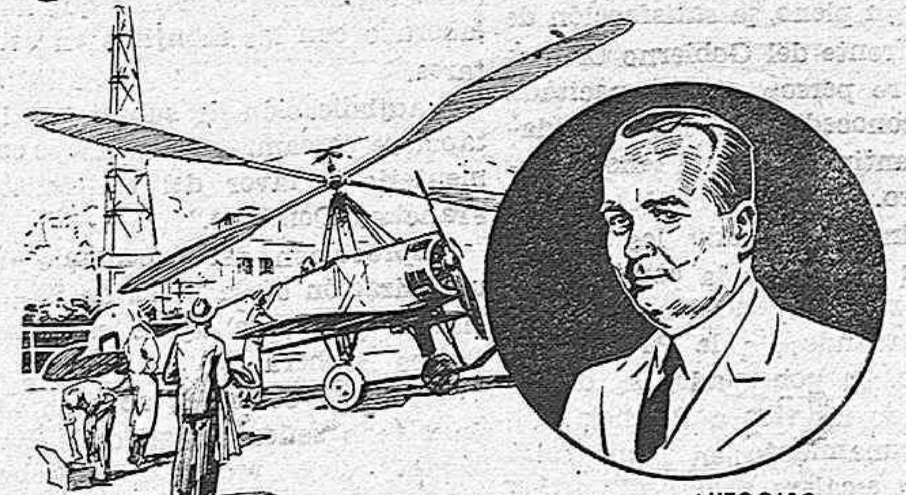
AUTOGIRO INVENCIÓN ESPAÑOLA JUAN DE LA CIERVA 1895-1936

Todos los grandes inventos son fruto de ideas luminosas. Existen en el universo materias y energías, que utilizadas con el acierto de una feliz idea producen efectos asombrosos. He aquí el secreto de la INSTANTINA, combinación especial de eficacísimos elementos terapéuticos, inocuos y seguros, que cortan con la máxima rapidez los resfriados y sus consecuencias así como toda clase de dolores.