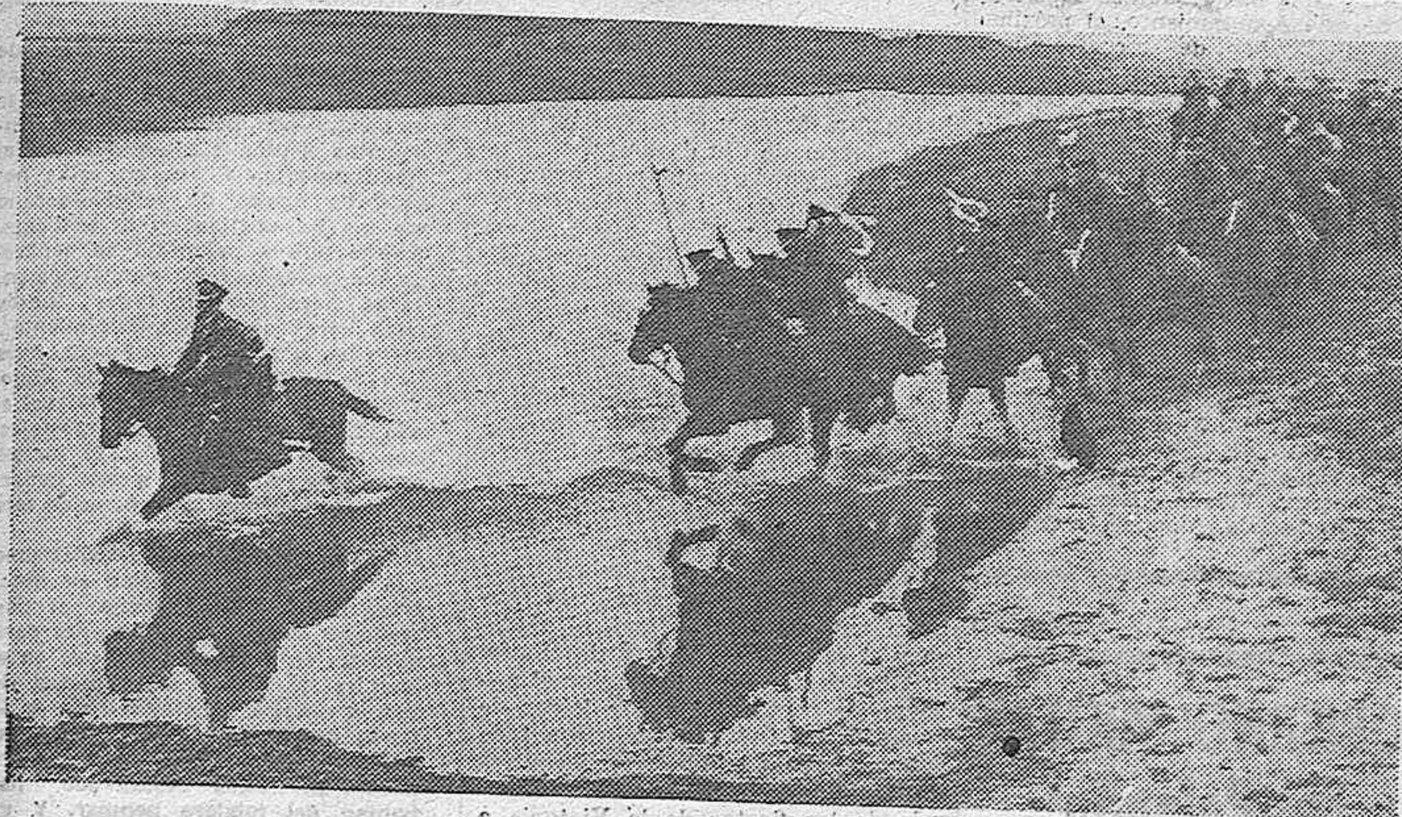
La caballería polaca acaba de actuar en el frente de la Alta Silesia. He aquí un escuadrón de esta arma vadeando un río durante el desarrollo de un "ataque" en las maniobras militares recientemente celebradas.

Aconsejan a los países no produzcan incidentes que les haga cambiar esta política