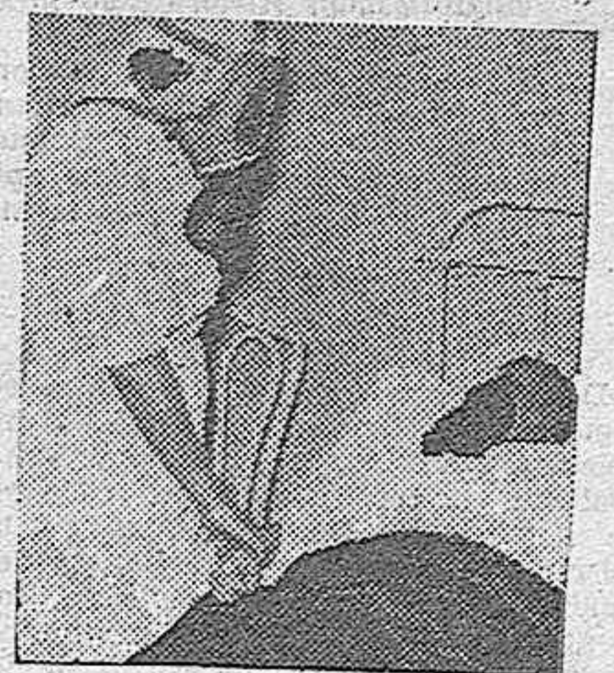
En los hospitales de París se realizan prácticas de intervenciones quirúrgicas con máscaras contra gases. Esta enfermera, provista de su correspondiente careta, de fabricación especial y dotada de gran visualidad, toma el pulso al enfermo, protegido igualmente contra el peligro de los gases.

Dice la nota que, no obstante los informes que ha publicado la Prensa extranjera, Japón no observará una política de neutralidad, sino la de no intervención, lo mismo que Italia está observando, por lo cual el Gobierno de Tokio solicita de los diplomáticos extranjeros que pidan a sus gobiernos que eviten toda posibilidad de incidentes que puedan conducir a Tokio a cambiar esa política de no intervención.