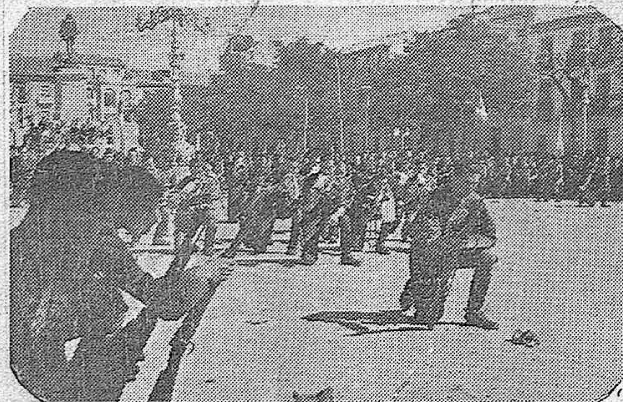
El solemne momento de alzar a Dios en la misa con que los jinetes militares españoles, de guarnición en Alcalá, celebraron la fiesta de su glorioso Patrón Santiago. (Foto Bersans).