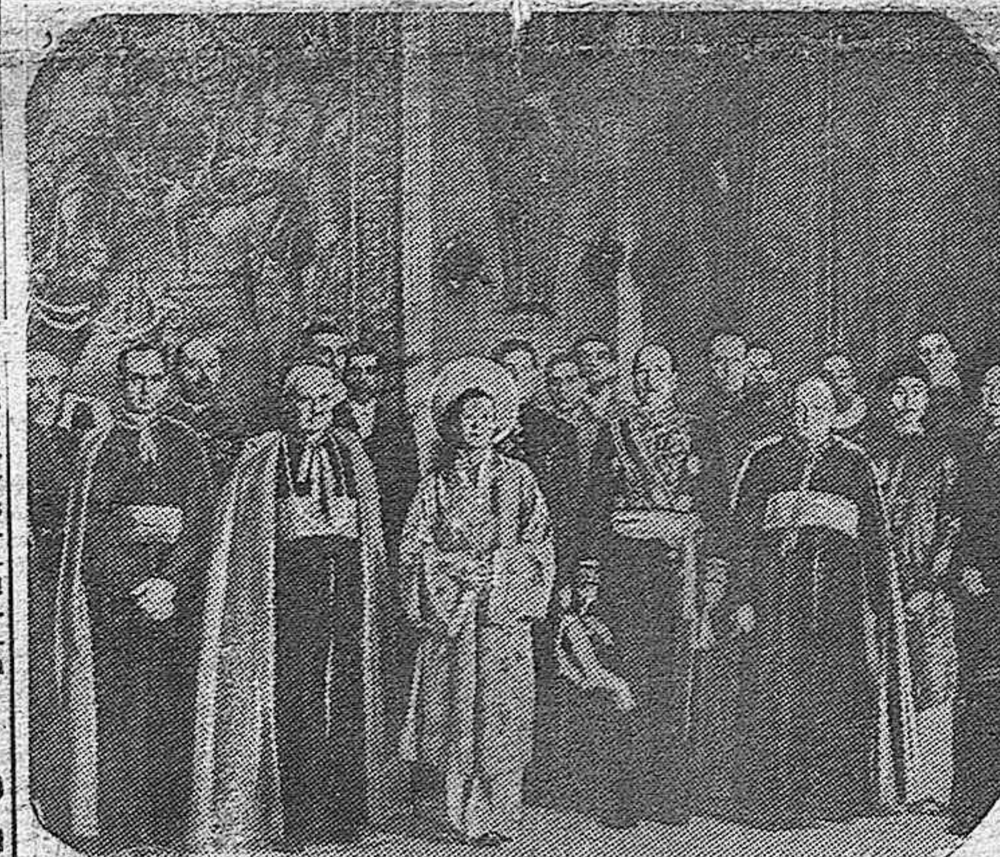
S. M. Nam-Phuong, Emperatriz de Anán, rodeada de monseñor Maglione, secretario de Estado, y de otras personalidades, fotografiados después de haber sido recibida la Soberana por Su Santidad Pío XII