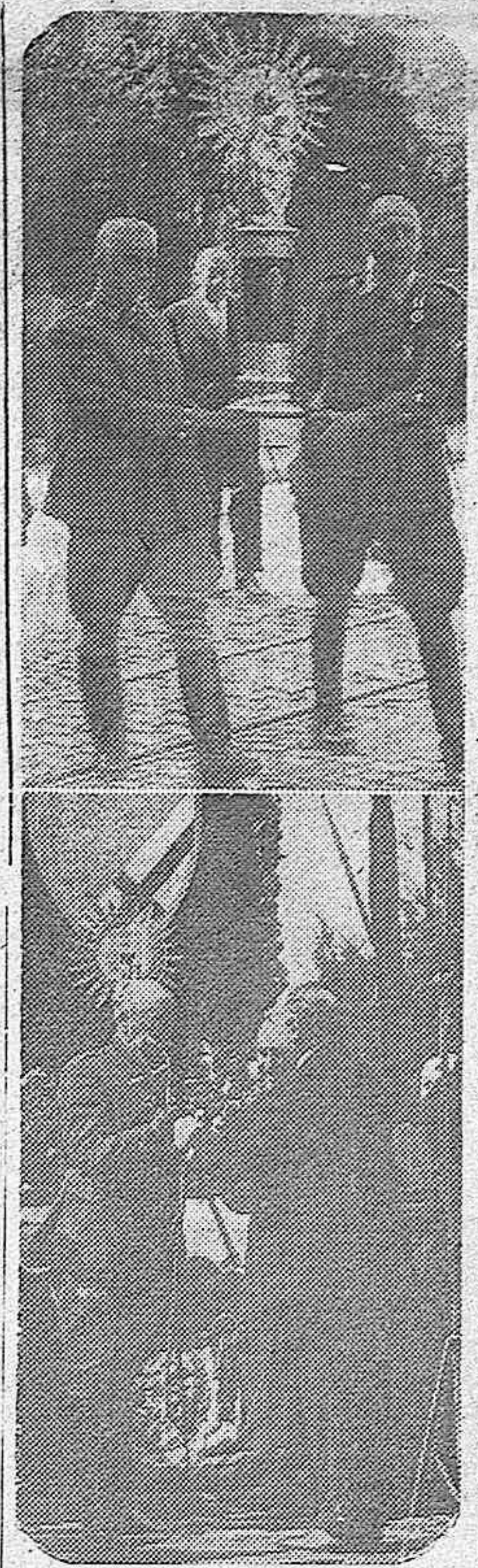
El general Marzo y el coronel Adrades conducen la imagen de la Virgen del Pilar al altar donde se celebró la misa de campaña. En la otra fotografía, el presidente de la Diputación de Zaragoza, don Miguel Allue entrega el sable de honor que Aragón regala al heroico general Moscardó.