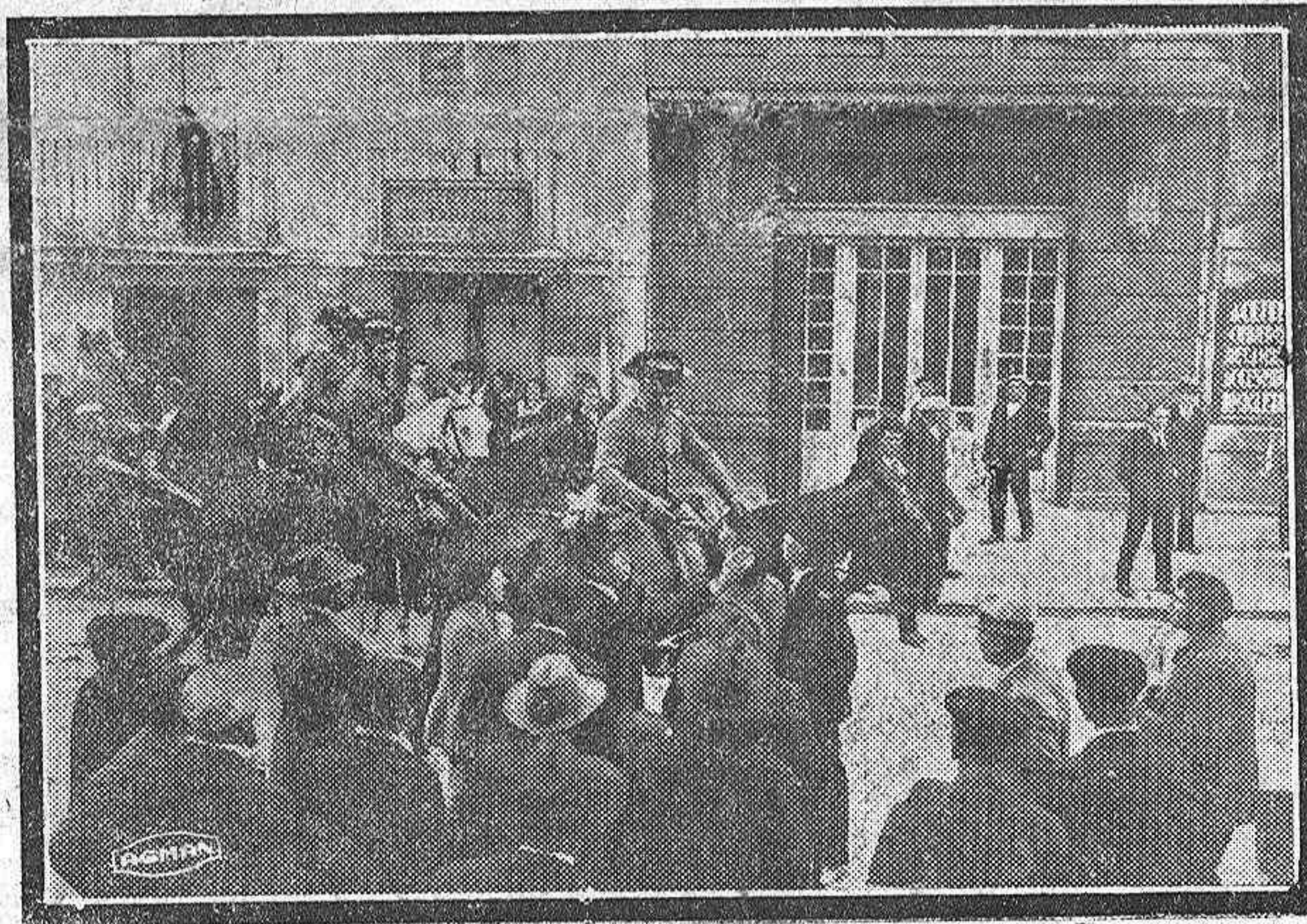
Grupos de labriegos protestan ante la actitud de los guardias de Seguridad y son apaciguados por la guardia Civil

unidos, de impedir el tránsito rodado, haciendo volverse o circular por las calles de Canalejas y Pedro Espina a los vehículos que trataban de hacerlo por ser su paso obligado por la calle Mayor Principal, en el trozo comprendido entre las dos citadas.