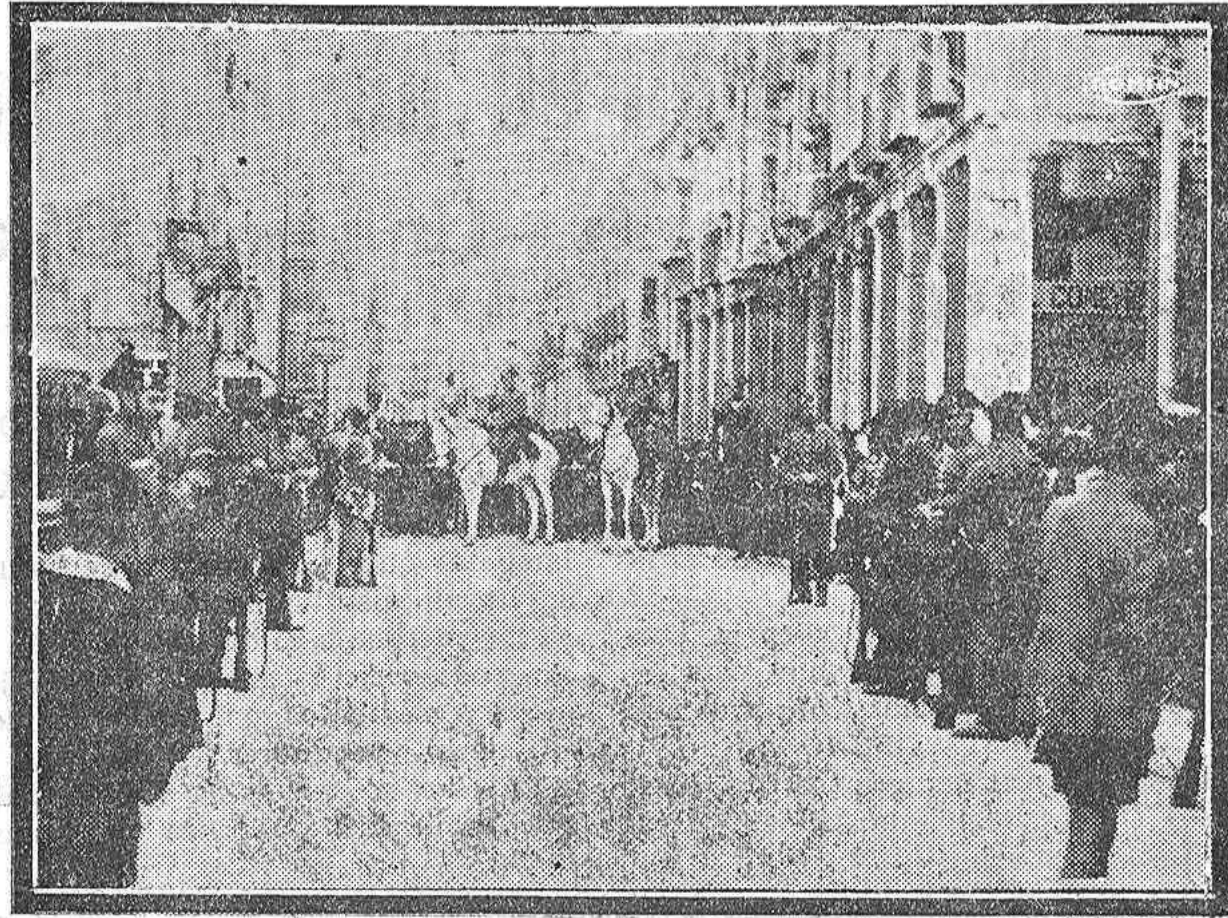
DE LA MANIFESTACION DE AYER. - Las puertas del Gobierno Civil aparecían acordadas por parejas de la guardia Civil