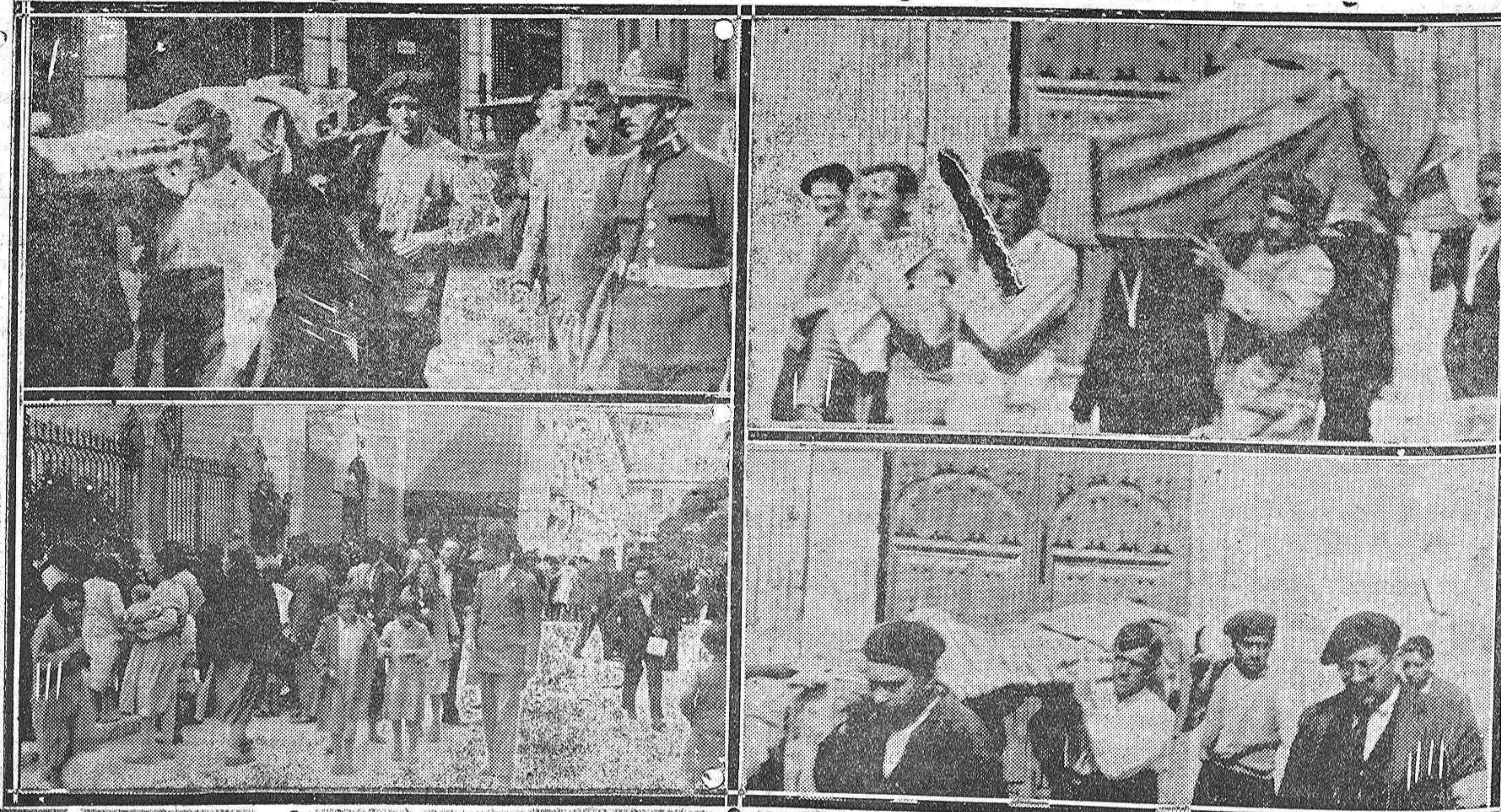
EL SUCESO DE ESTA TARDE. - Algunas escenas del traslado de los heridos y el público estacionado en la Casa de Socorro