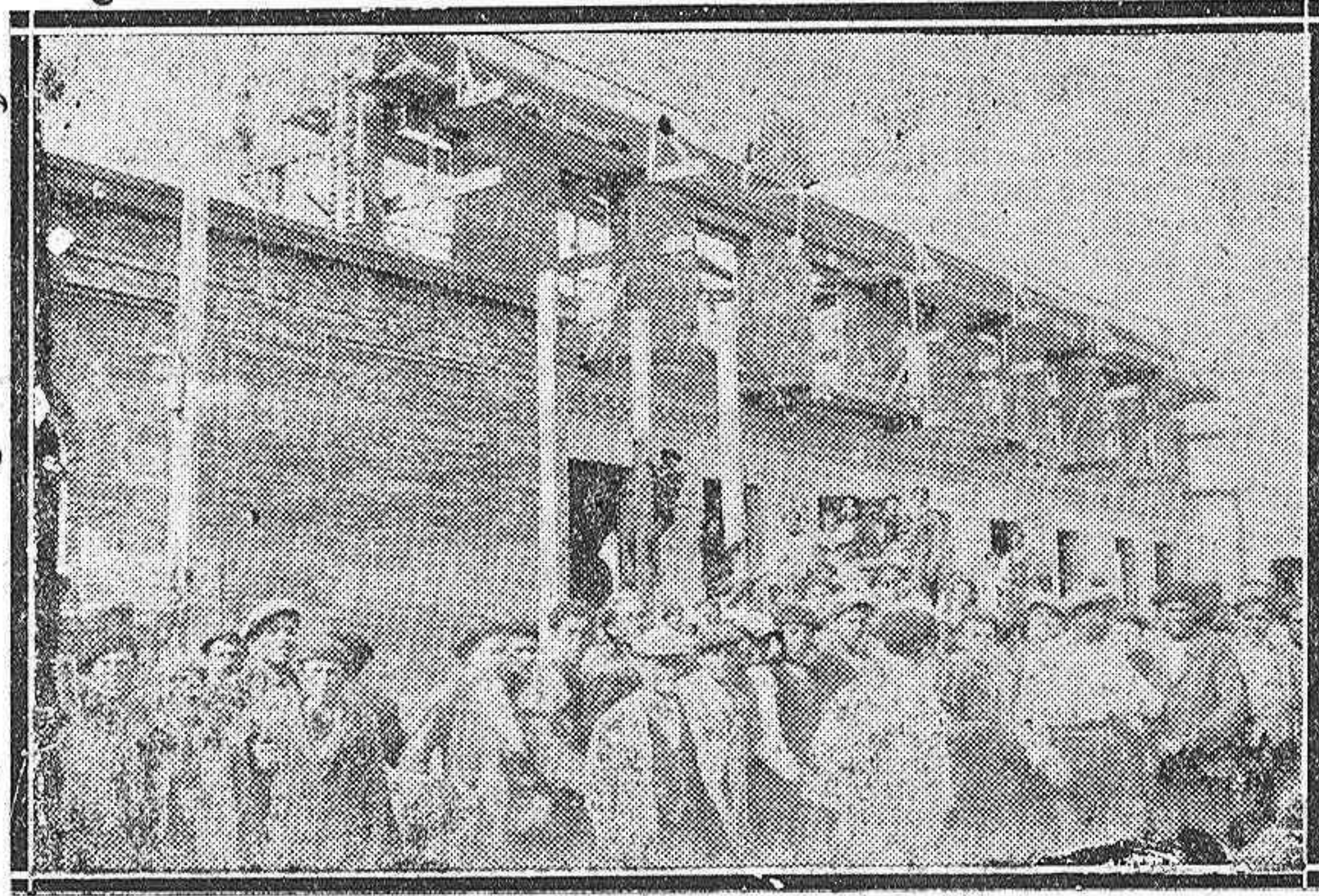
DEL ACCIDENTE DE HOY.—Uno de los pabellones del manicomio de mujeres

En este acto preliminar que se celebrará mañana, deben, pues, encontrarse presentes todos los palentinos, que de este modo darán una vez más pruebas de completa identificación con la idea de la erección del monumento a Cristo Rey, que ya ha cristalizado en una realidad maravillosamente encarnada por un ilustre escultor palentino.