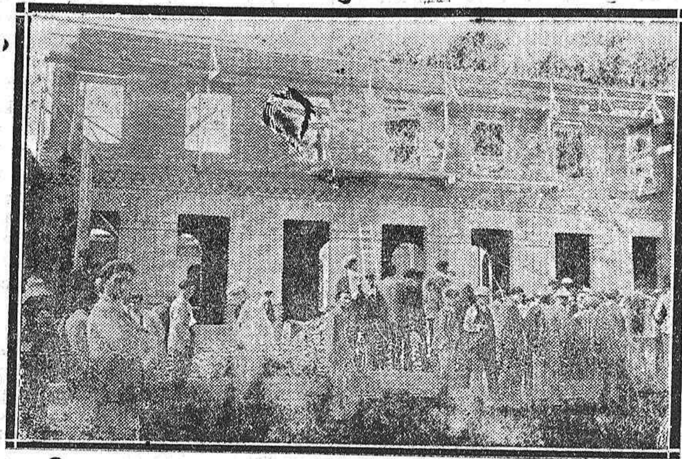
DEL ACCIDENTE DE HOY.—Los obreros congregados en el lugar del accidente de esta tarde, momentos después de ocurrido éste.