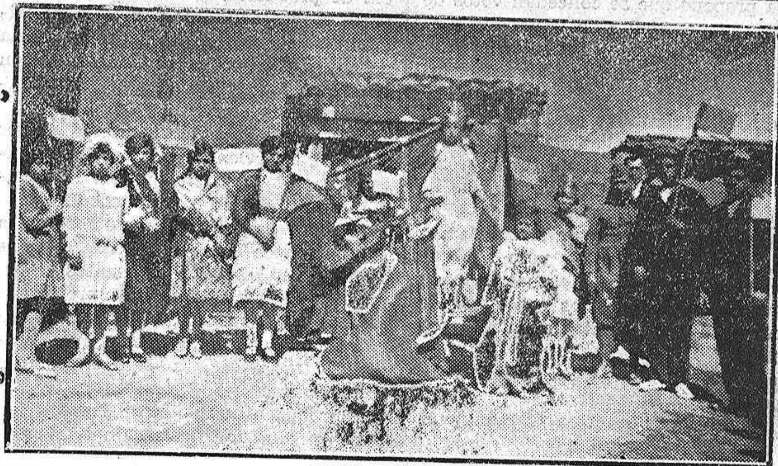
VILLANAÑO DE VALDAVIA.—Grupo de jóvenes que interpretaron, días pasados, la revista «España forestal y sus regiones»

Con la confianza que tenemos en la diligencia de usted para evitar estos males, quedamos suyos, etc.”