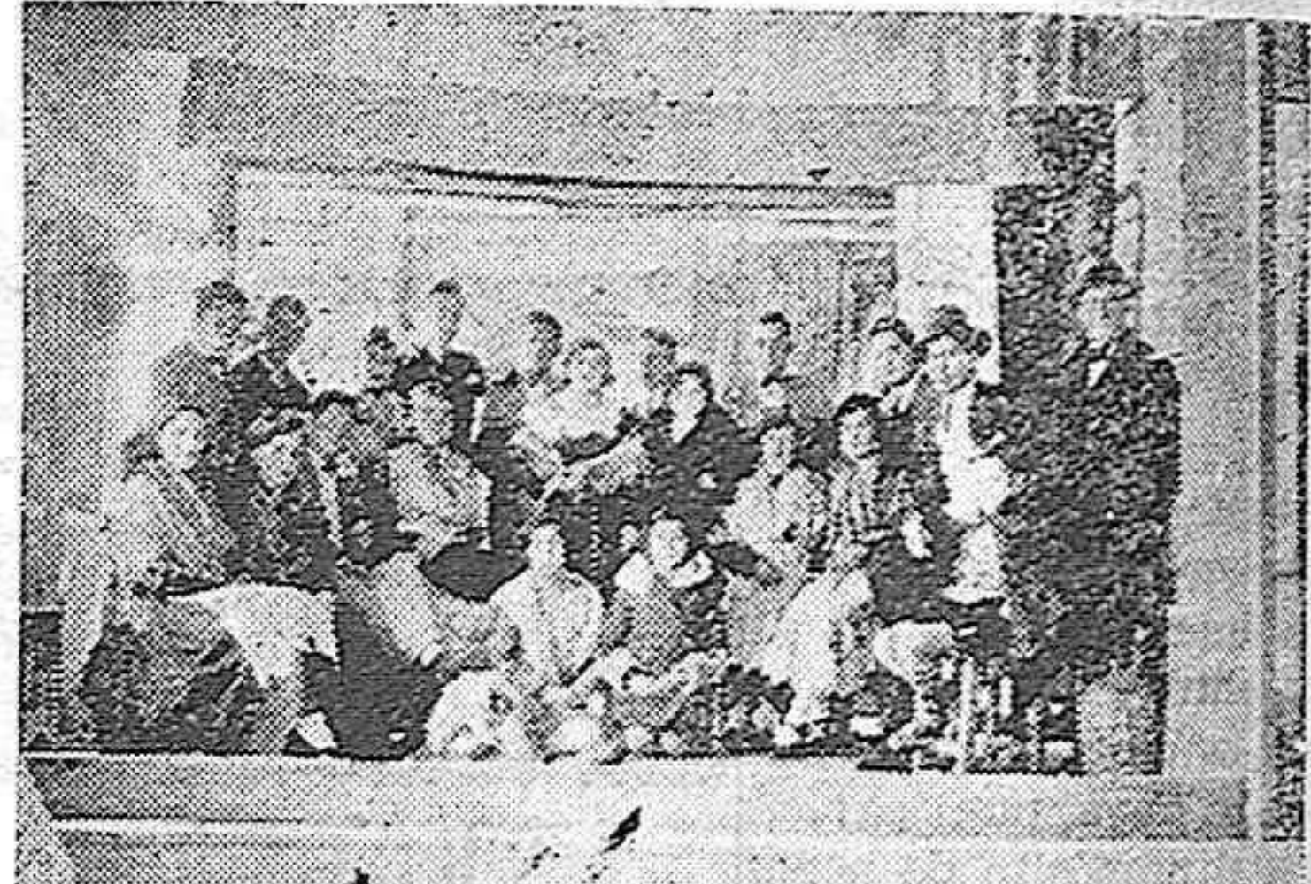
FRECHILLA.—El cuadro artístico co de Frechilla, que en breve pondrá en escena la zarzuela "Los Gavilanes".

DEL DINERO IMPUESTO EN NUESTROS SINDICATOS DE RESPONDE EL CAPITAL DE RETOS Y EL DE SUS DIEZ MIL SOCIOS