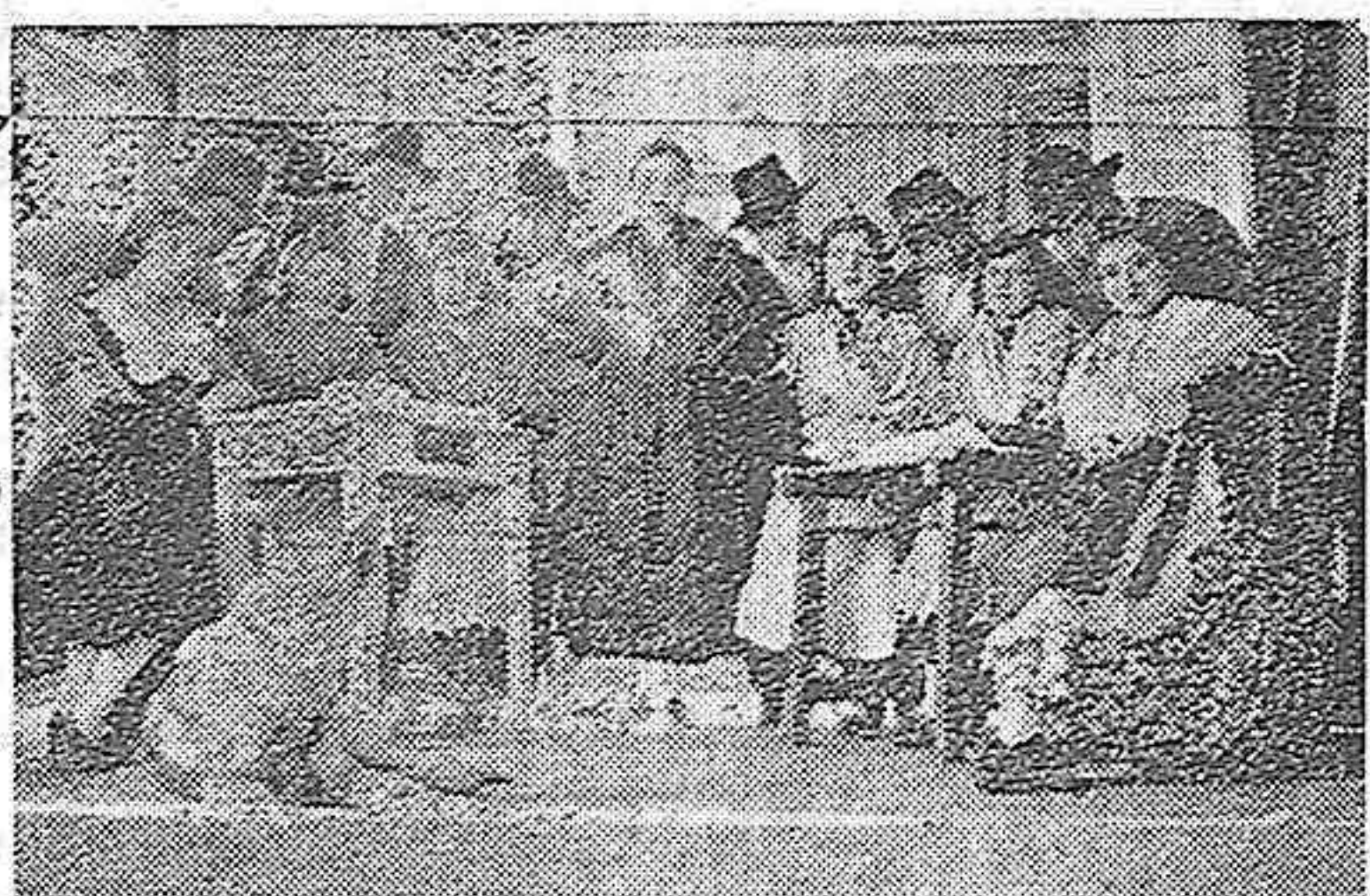
FRECHILLA.—Una escena de la zarzuela "La rosa del azafrán", interpretada por el cuadro artístico frechillense

Médico de la Armada. Especialista en Garganta, Nariz y Oídos. Patio Castaño