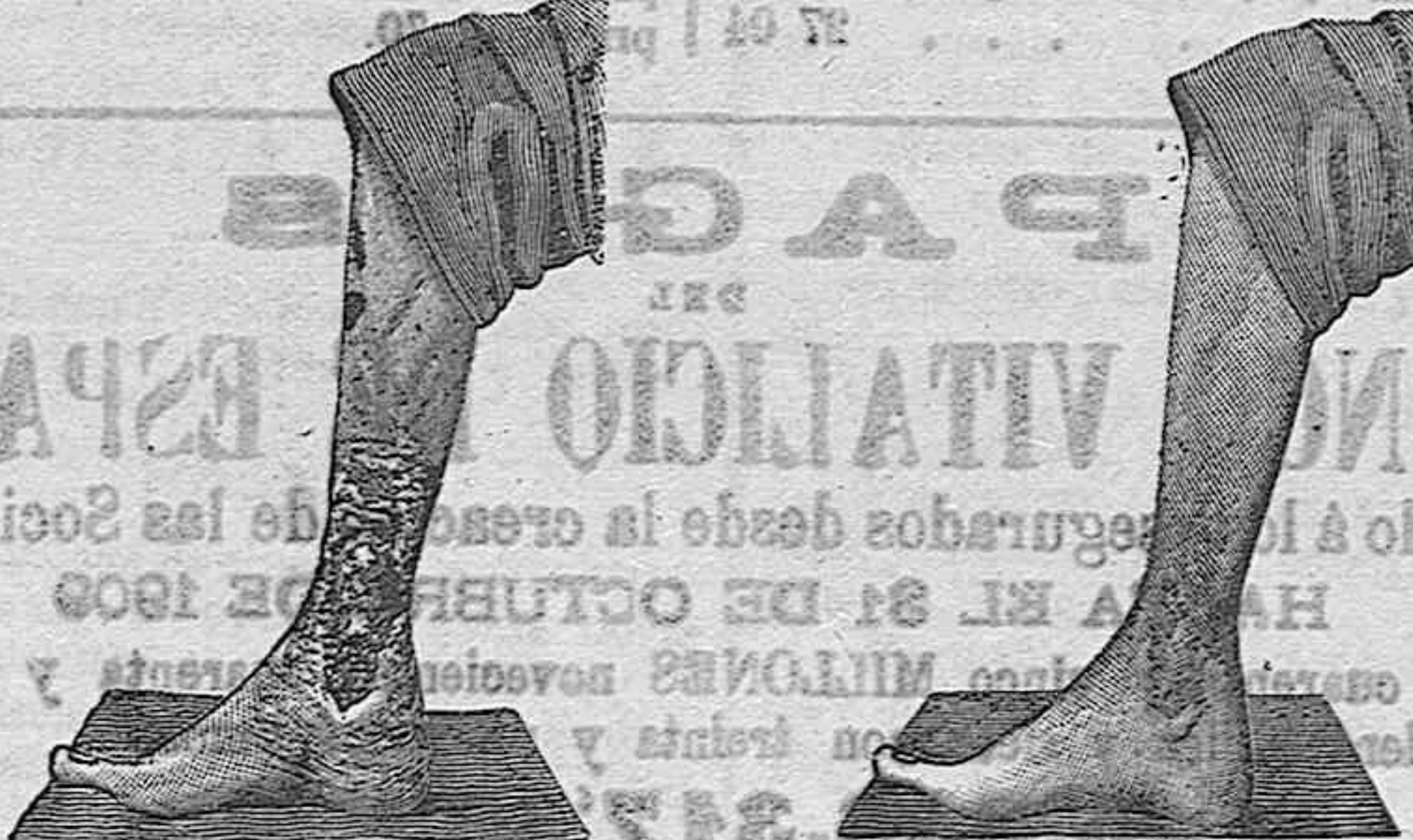
Antes de la curación Después de 15 días de tratamiento