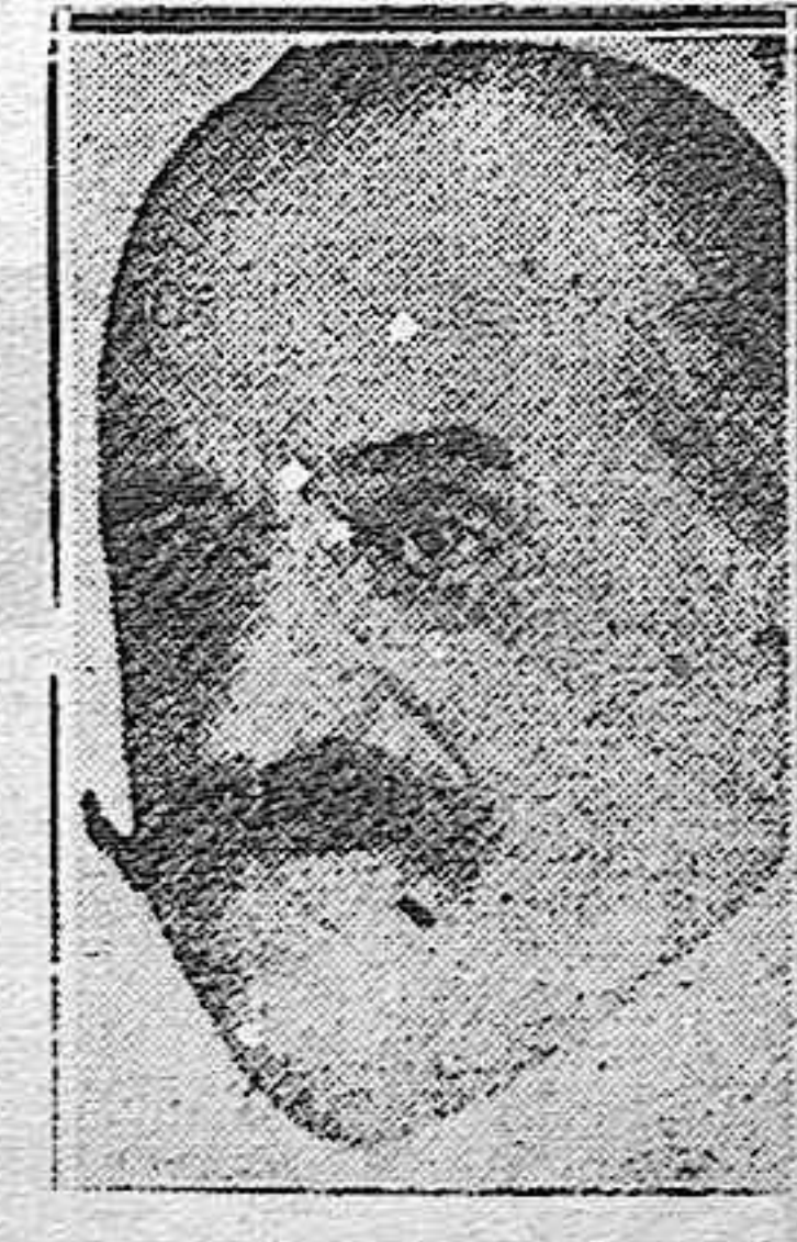
EL CONDE DE ROMANONES, ministro de Estado

MADRID.—El presidente del Consejo de ministros, almirante Aznar, recibió esta mañana las visitas del capitán general de Madrid, al fiscal del Supremo y otras personalidades.