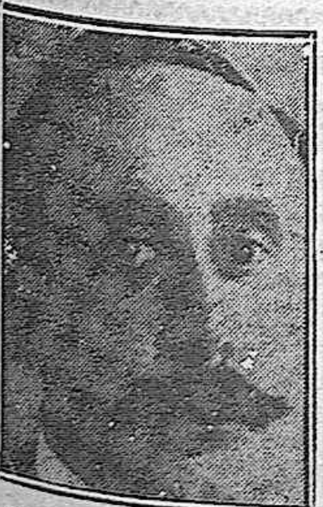
EL SEÑOR VENTOSA, ministro de Hacienda