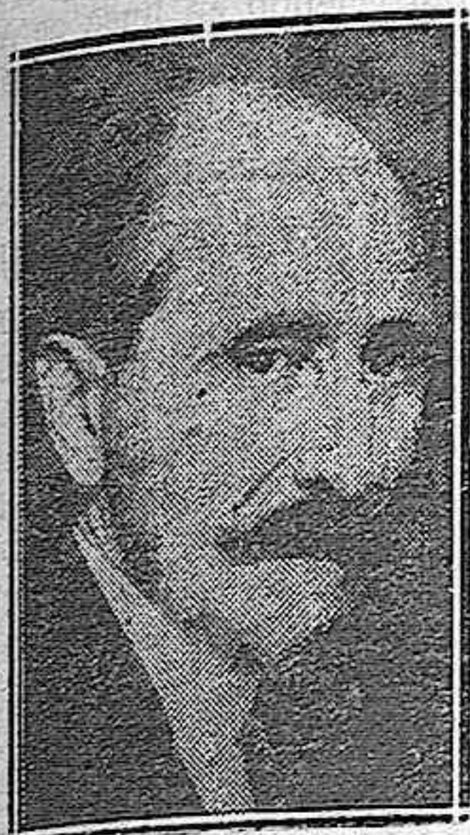
EL MARQUES DE HOYOS, ministro de la Gobernación

También es su propósito proceder a una amplia revisión de toda la obra de la Dictadura