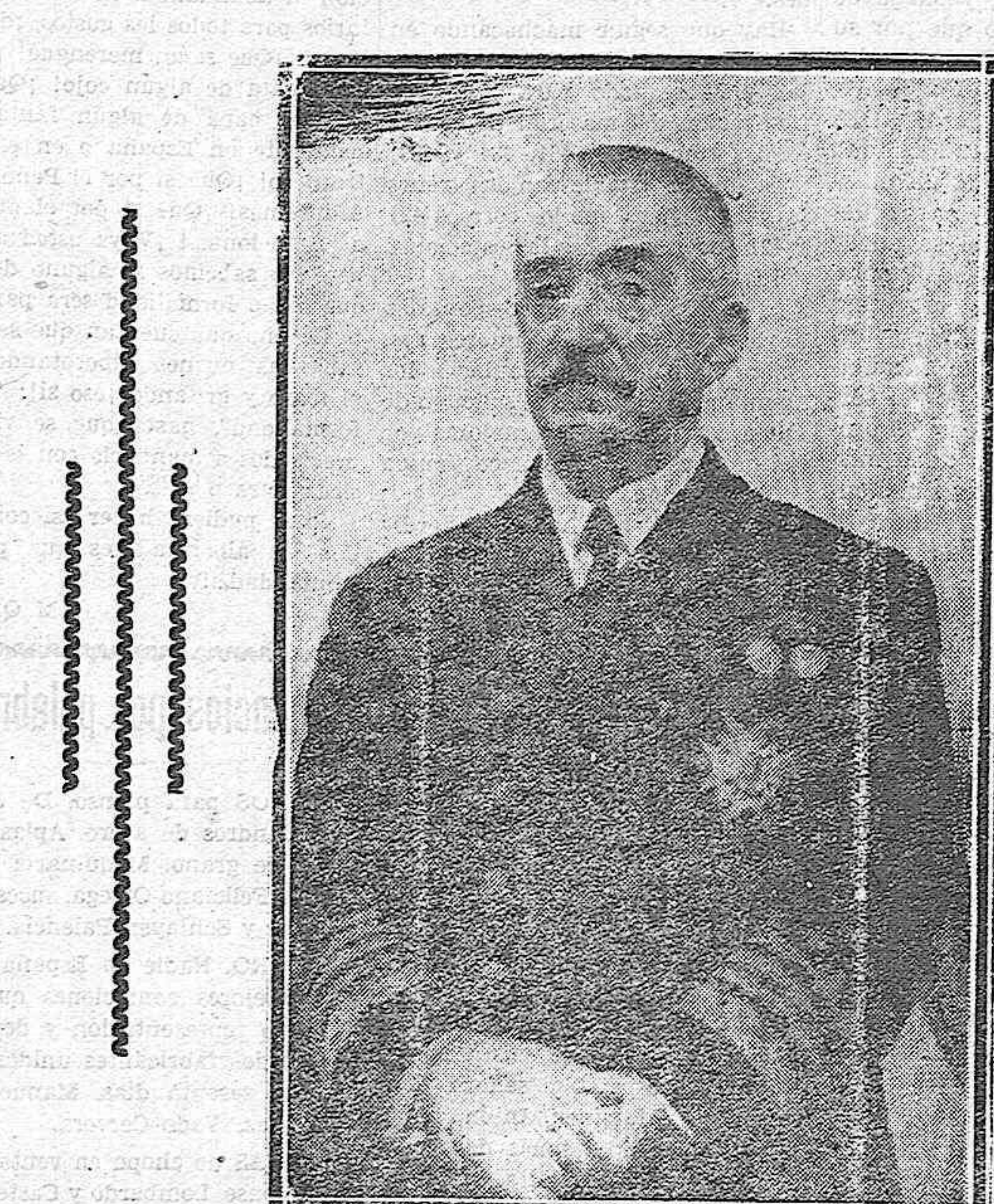
EL ALMIRANTE AZNAR, Presidente del Consejo de Ministros

En cuanto al problema de los cambios, se remite a la carta que envió al Consejo Superior Bancario. No puede decir nada referente al tipo de estabilización, porque depende de las circunstancias, y opina que para conseguir la revalorización hay que dar sensación de orden. En el problema de la peseta no tiene criterio exclusivista, y no es partidario de prohibir la exportación de capitales. Su pensamiento en relación con las obras urgentes y con los proble-