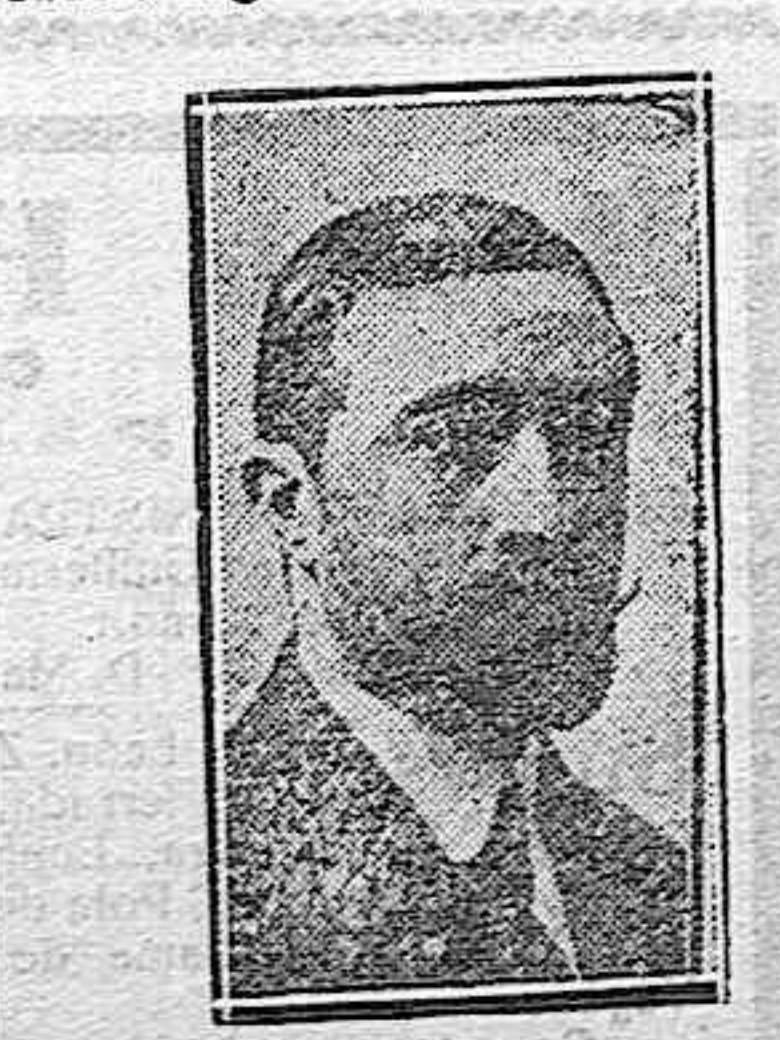
GASCON Y MARIN, ministro de Instrucción pública