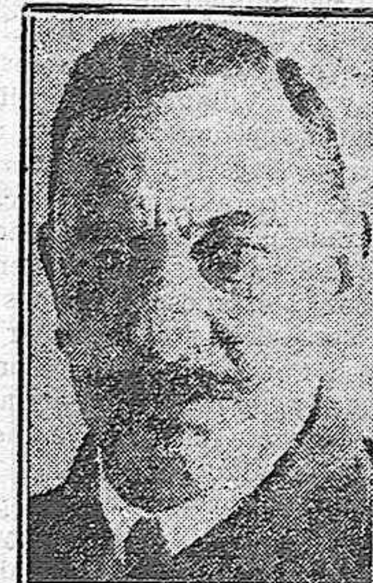
EL MARQUES DE ALHUCEMAS, ministro de Gracia y Justicia

También se propone el Gobierno la revisión de las disposiciones dictadas por la Dictadura, por medio de decretos