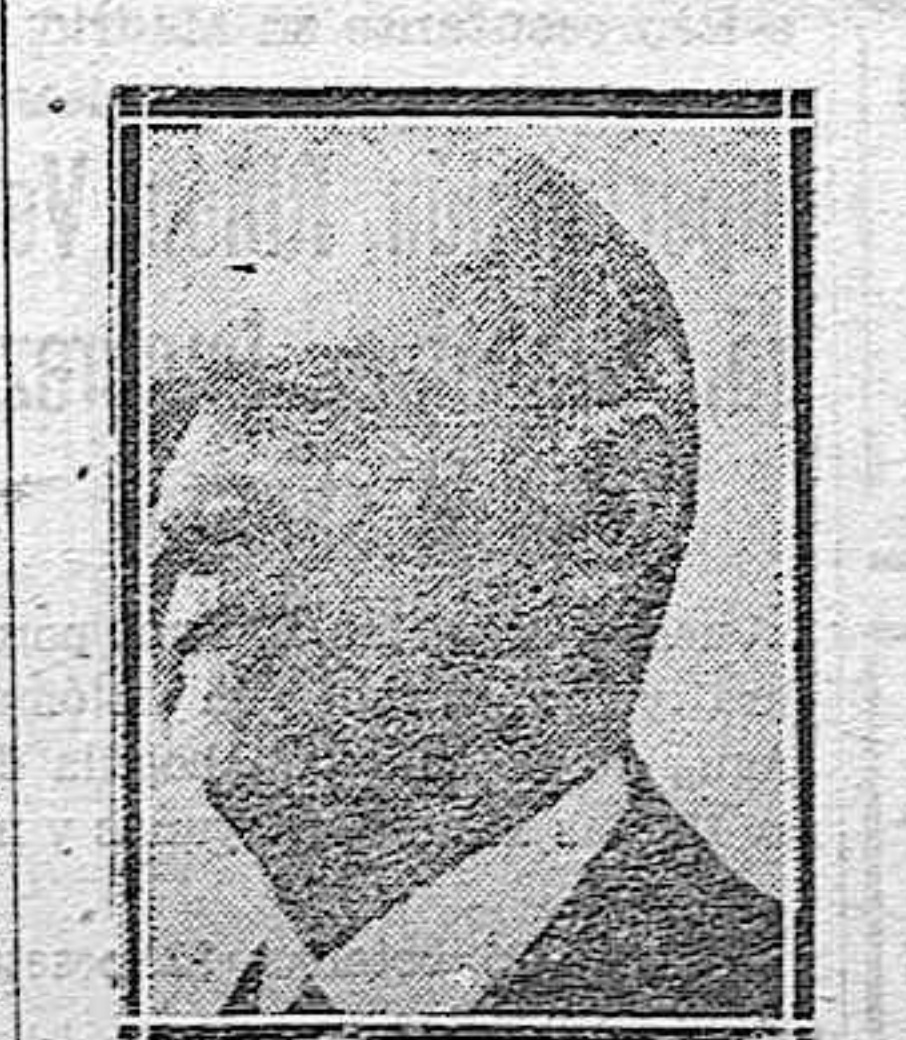
EL CONDE DE BUGALLAL, ministro de Economía