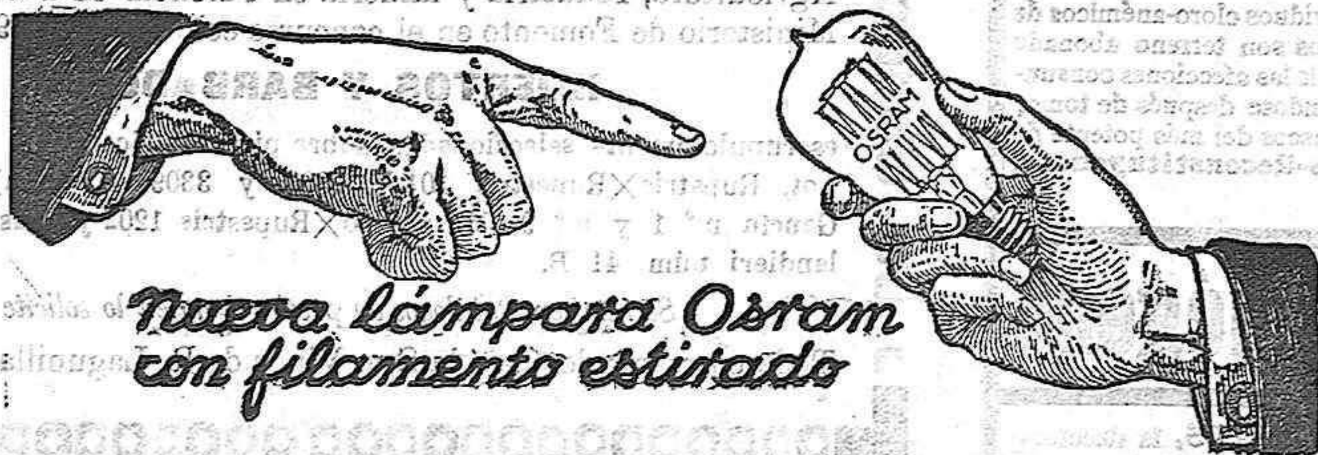
Nueva lámpara Osram con filamento estirado

Aventadoras, Gradas, Rodillos, Norias, Bombas