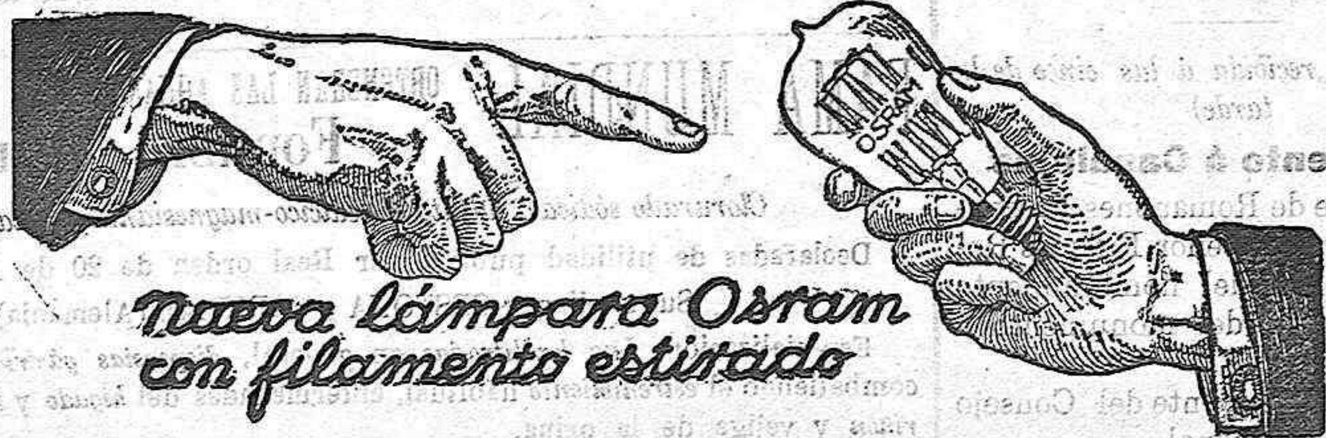
Nueva Lámpara Osram con filamento estirado

Aventadoras, Gradas, Rodillos, Norias, Bombas