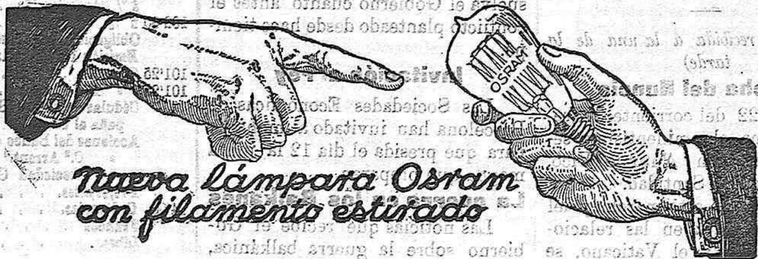
Nueva Lámpara Ostram con filamento estirado

Aventadoras, Gradas, Rodillos, Norias, Bombas