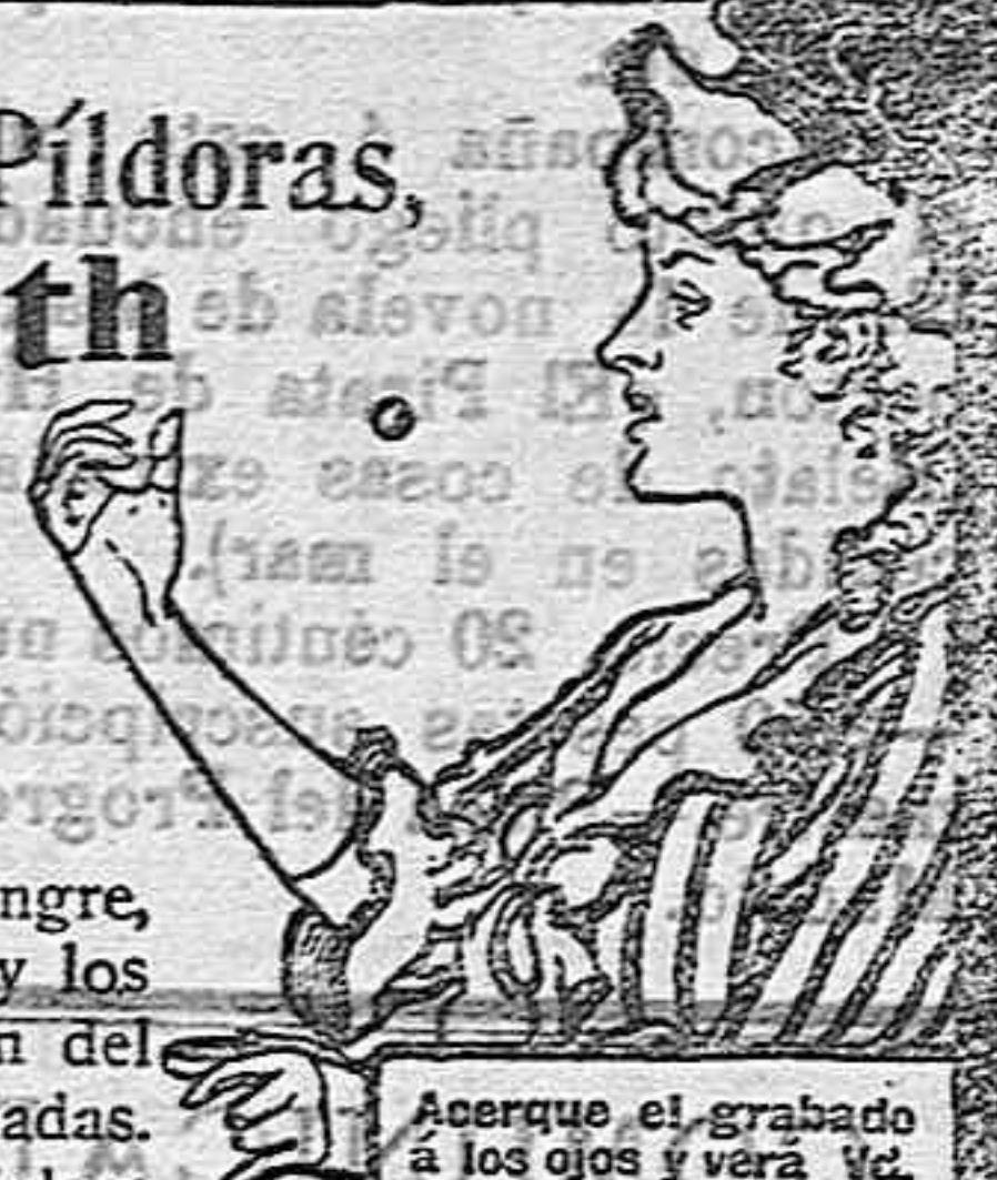
Acerque el grabado á los ojos y verá cómo la píldora entra en la boca.