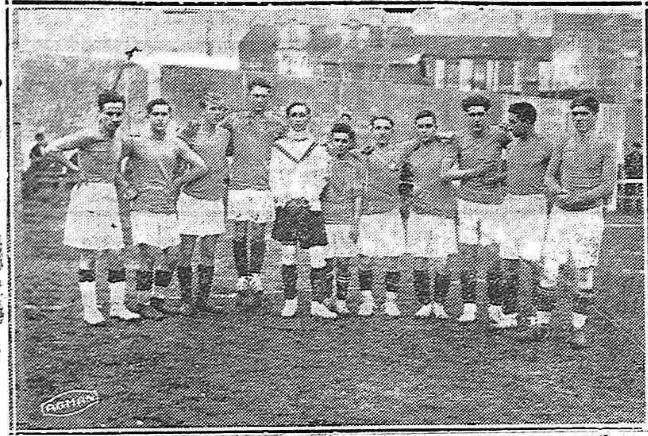
Del partido del domingo en León.—El equipo palentino en el campo leonés