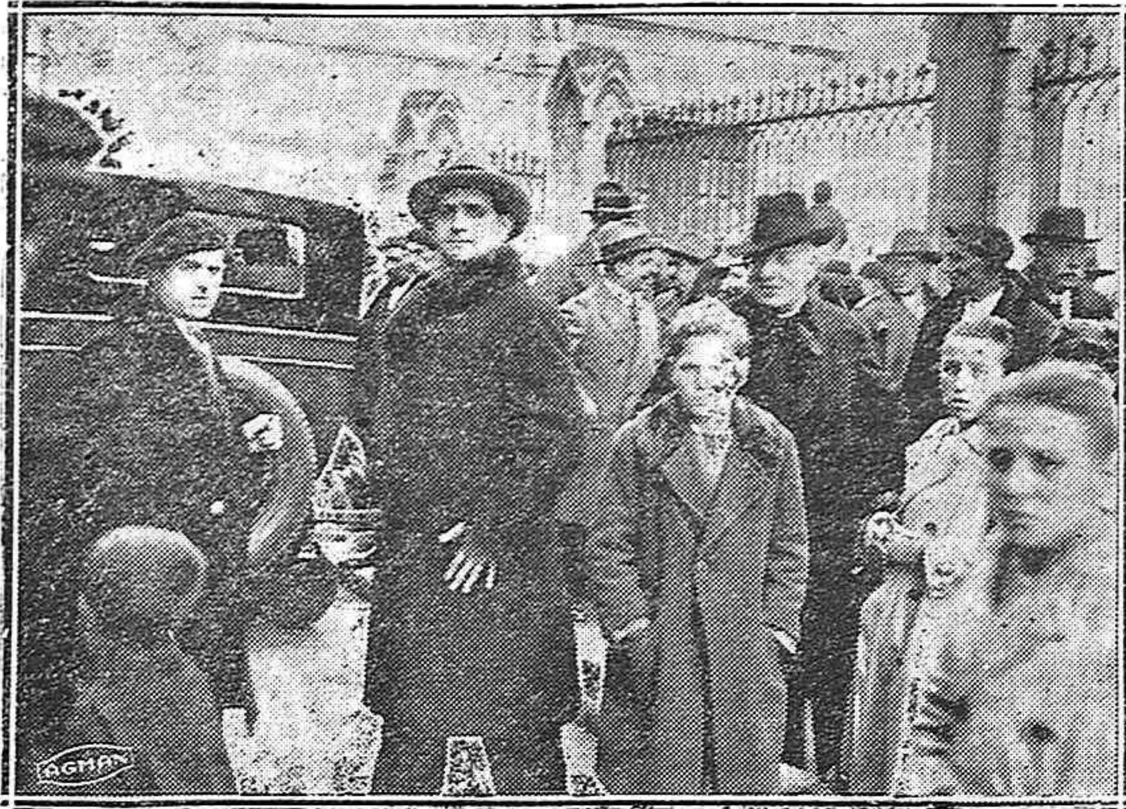
La Directiva de nuestra Coral saliendo de San Francisco

Ni tampoco la de Chile. La de los primeros, porque el afán desmedido de revalorizar a tipos superiores al valor intrínseco de la moneda ocasiona crisis indus-