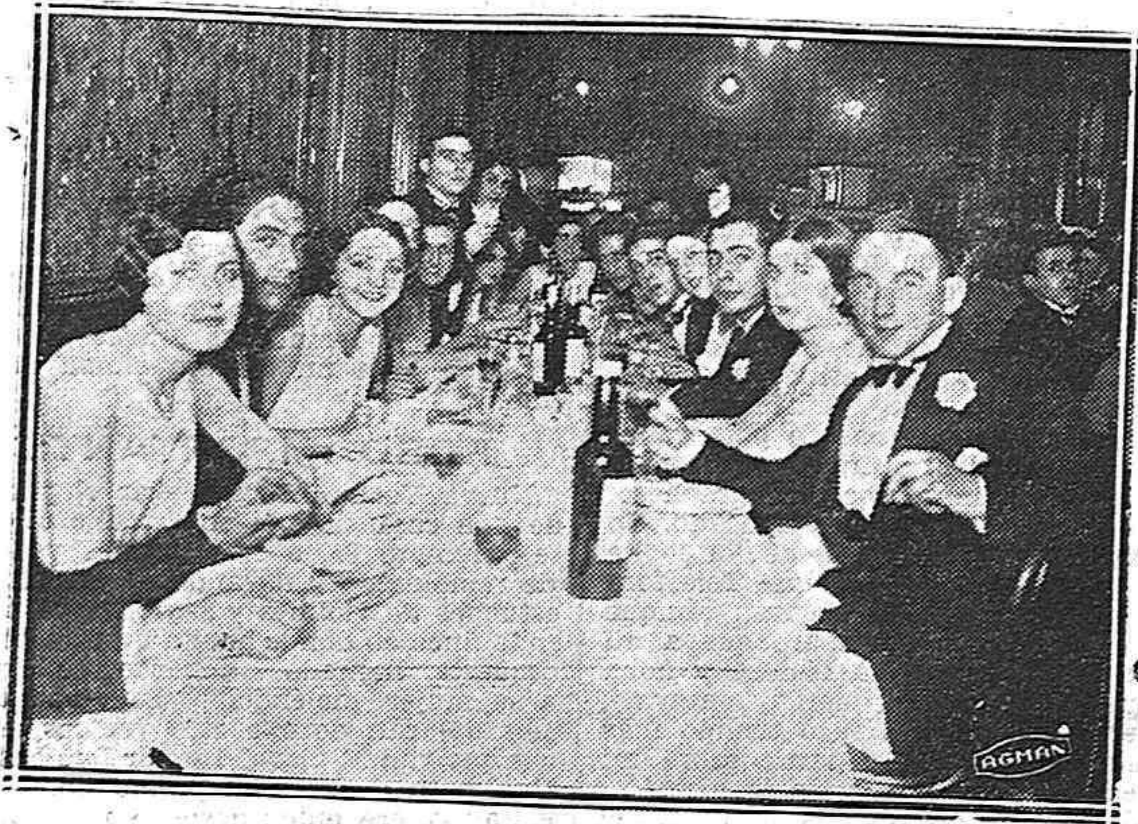
Una mesa donde la franca alegría reinó en todo momento.

Fué tan espantosa la explosión, que los edificios de la población sufrieron desperfectos considerables.