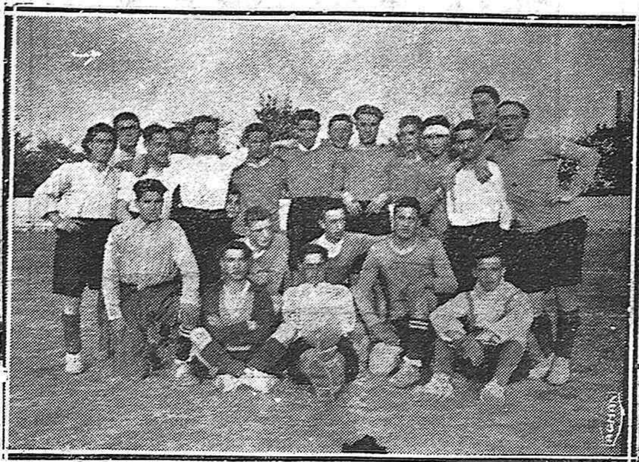
DE FUTBOL.—Los dos equipos que se enfrentaron el domingo, reunidos antes de empezar el partido