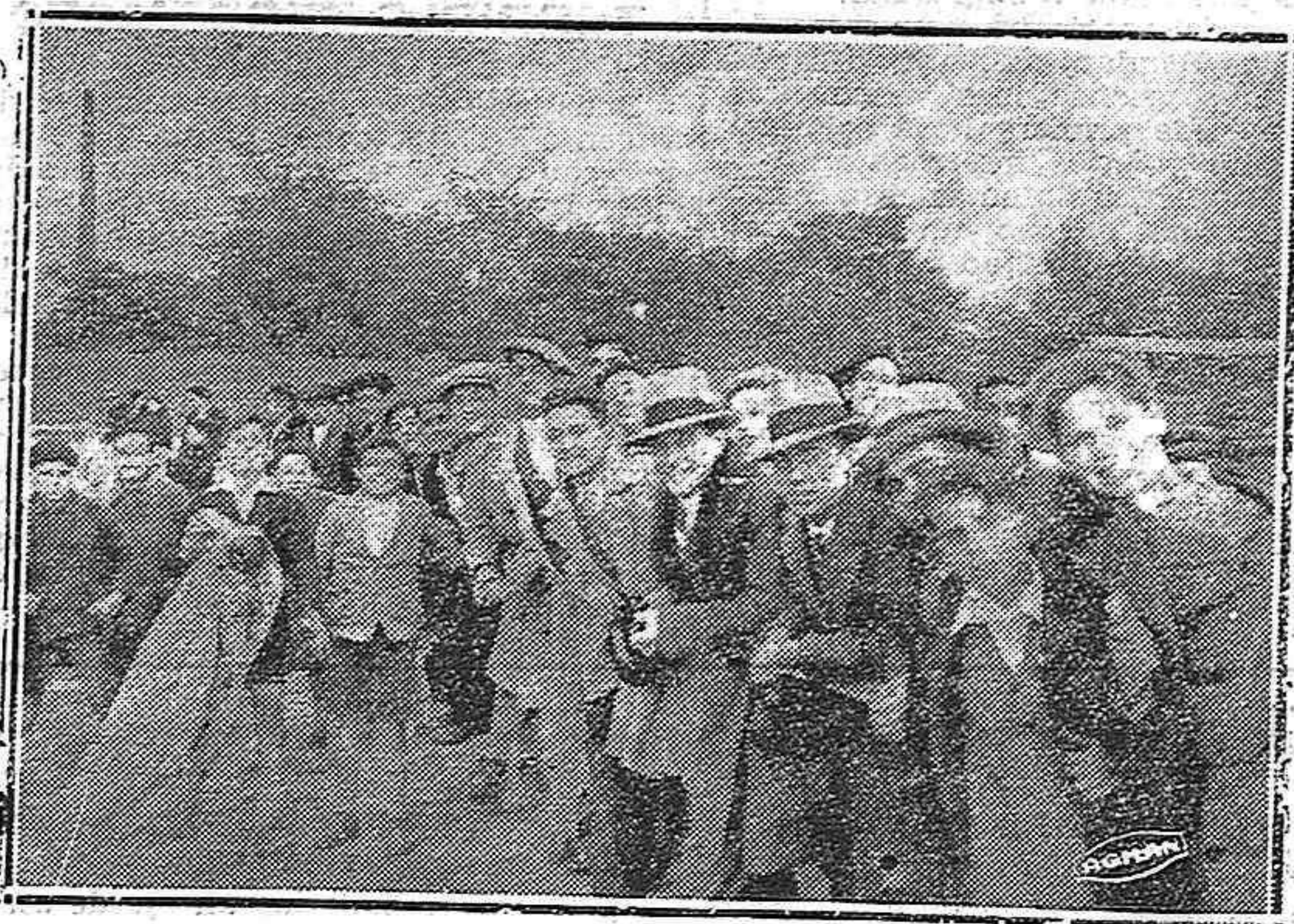
DE FUTBOL.—Un aspecto de la tribuna porteril