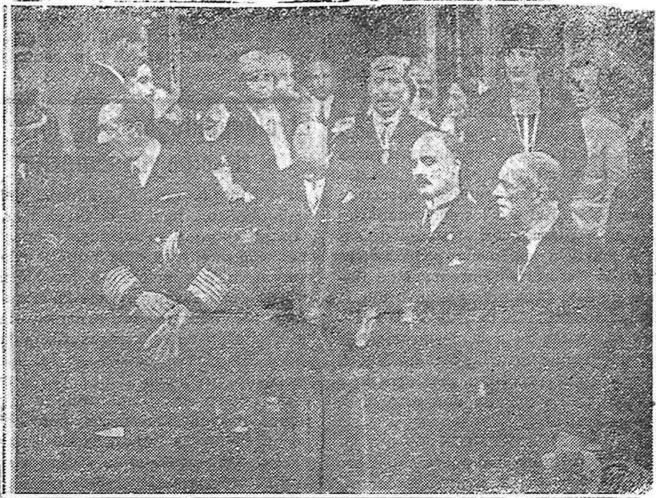
SS. MM. los Reyes e Infantes, acompañados de los Presidentes de las Diputaciones de Castilla y León, saliendo de inaugurar el pabellón de Castilla la Vieja y León

El señor Clementel estuvo nuevamente en el Eliseo a las seis de la tarde, y a la salida dijo a los periodistas que había ido a conferenciar con el presidente de la República. No hará ya más gestiones hasta mañana, y creía que todo quedaría ultimado. Definitivamente, ha aceptado el encargo de formar Gobierno. Mañana a las seis de la tarde volverá al Eliseo a dar cuenta de sus gestiones.