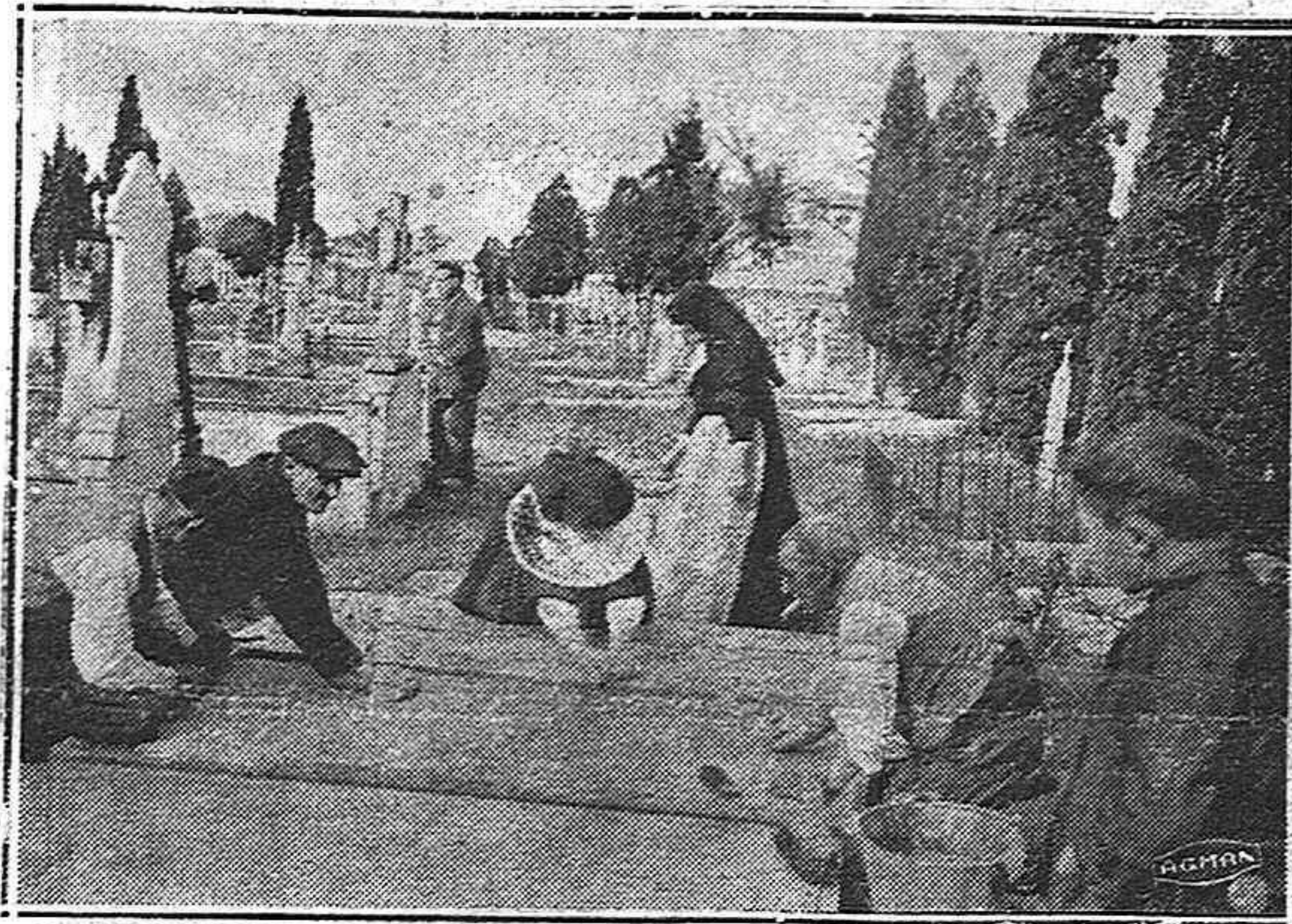
Almas piadosas se acuerdan de los olvidados de todos, hasta de sus propias familias, a veces, y cuidan de sus tumbas en los días dedicados a los muertos

en el que según las crónicas, nos cuentan, se distinguió sobre manera, hasta el punto que en el campo de lucha halló la muerte, esa muerte tan esperada algunas veces, y tan temida, tan odiada otras.