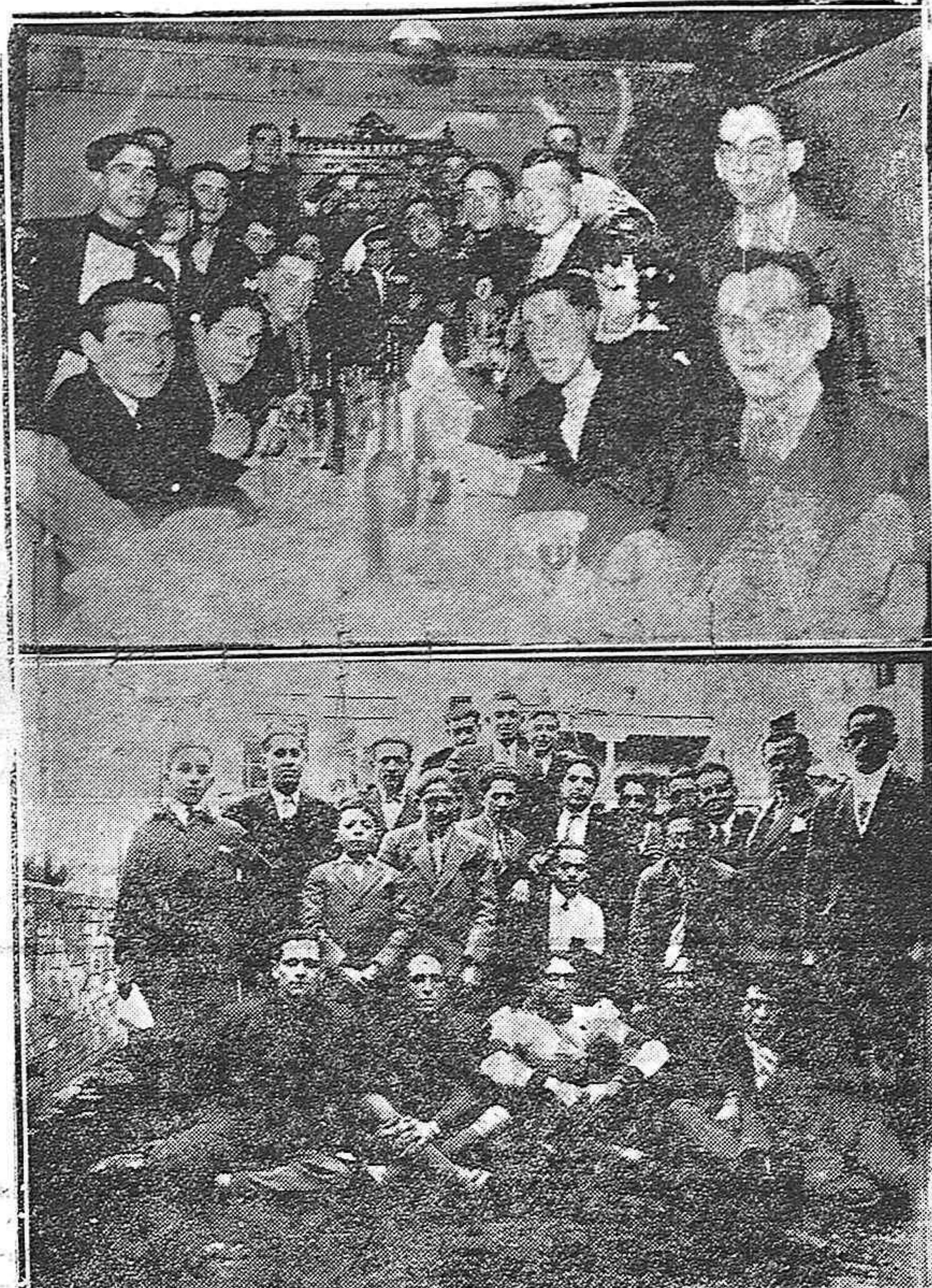
Arriba: Aspecto que ofrecía el banquete que los ciclistas celebraron para despedir la temporada de 1929, donde después se entonó el "Adiós, Muchachos".—Abajo: Un grupo de ciclistas.—(Foto Guzmán de Rego)

También por unanimidad se designa al concejal don José Paisán, como delegado del Ayuntamiento, para ampliar