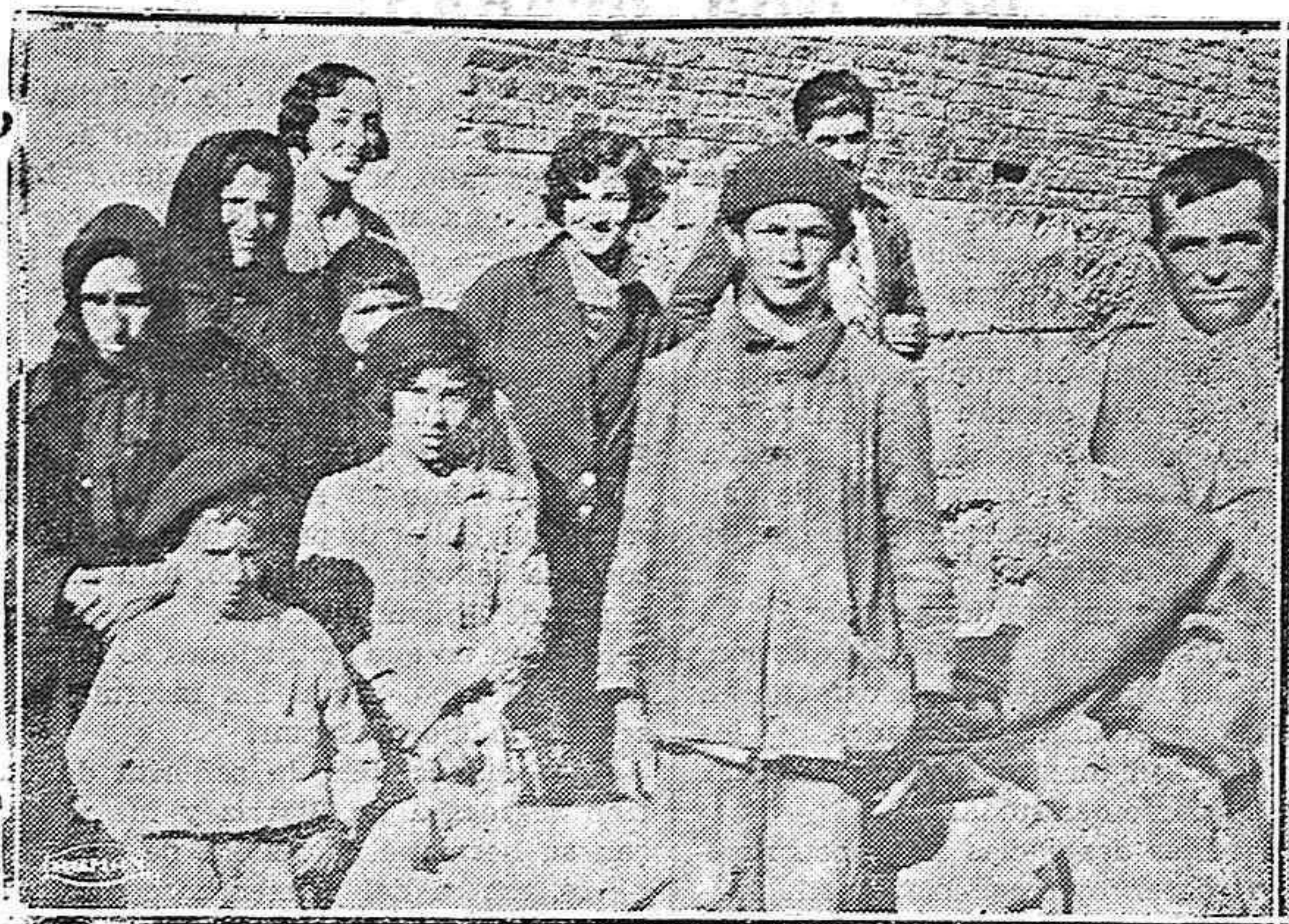
Del mercado de hoy.—Desde las primeras horas de la mañana empiezan los vendedores a exponer sus productos al público.

Ha manifestado el señor Herriot que la idea ha sido bien acogida en casi todas cuantas poblaciones ha visitado. Negó también que esta Federación vaya contra Norteamérica, como por algunos se ha dicho.