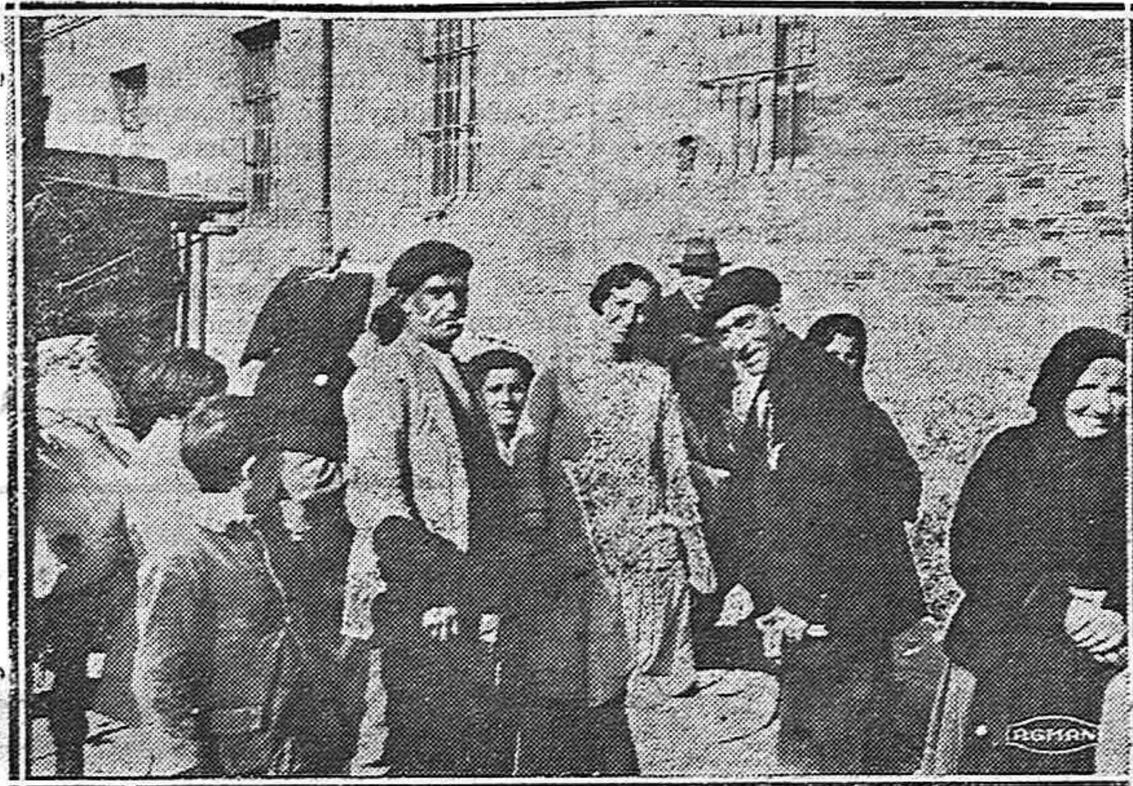
El mercado de hoy en la plaza de Abilio Calderón.—Grupos de compradores y vendedores discuten precios, y después regatean como los «buenos».