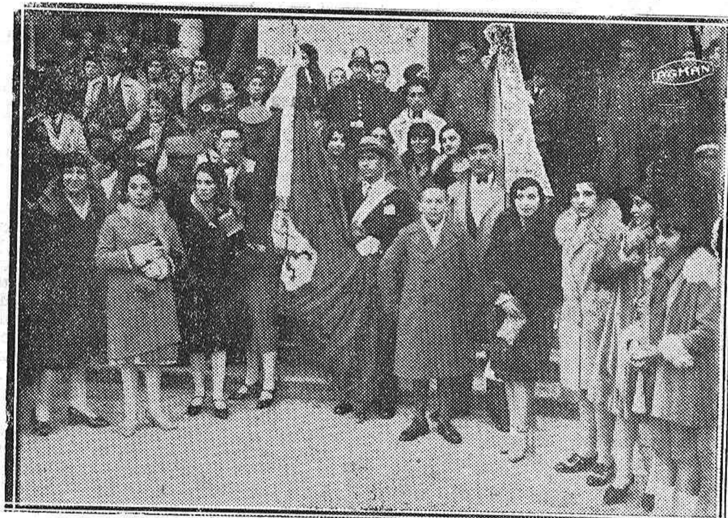
El Orfeón y la Coral saliendo del Ayuntamiento

dicado a la mujer palentina, que en los labios del señor Roa adquiere caracteres de un delicado madrigal. La ovación fué tan estruendosa como merecida.