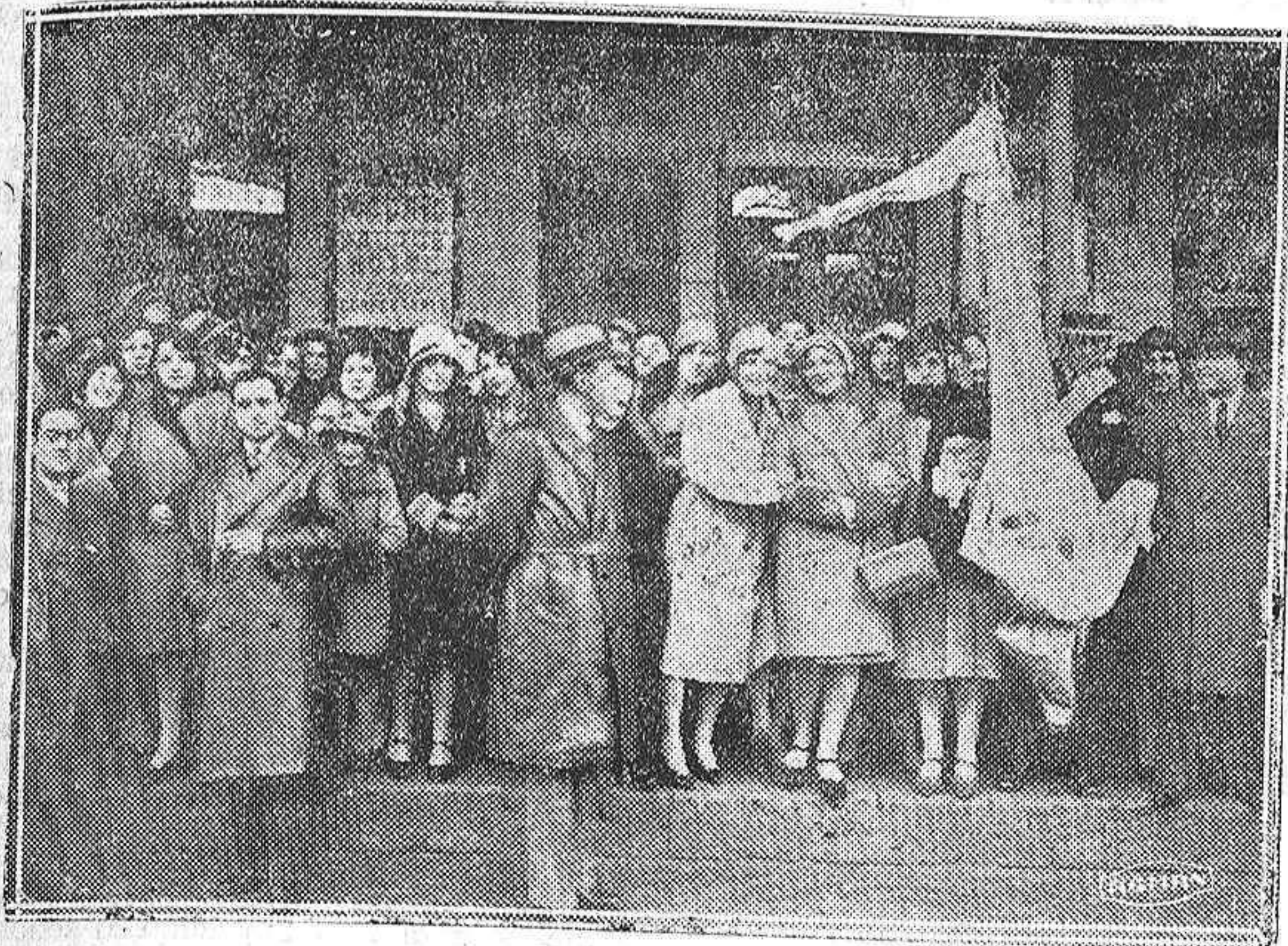
La Coral palentina espera la llegada del tren del Orfeón leonés