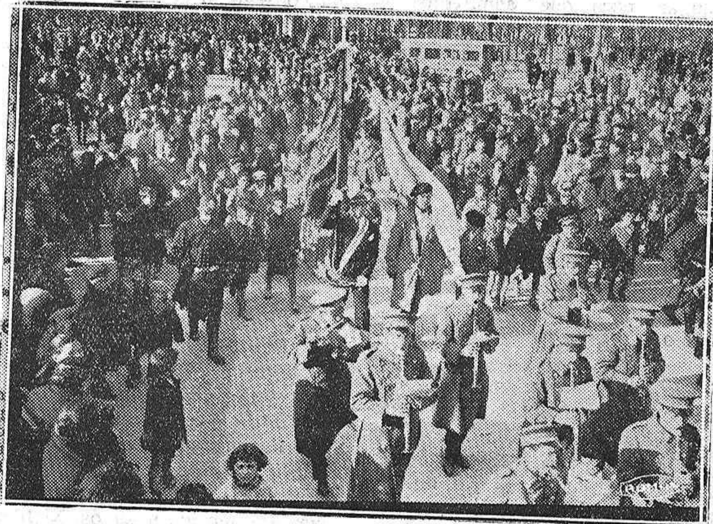
El Orfeón leonés y la Coral palentina desfilan con la banda municipal