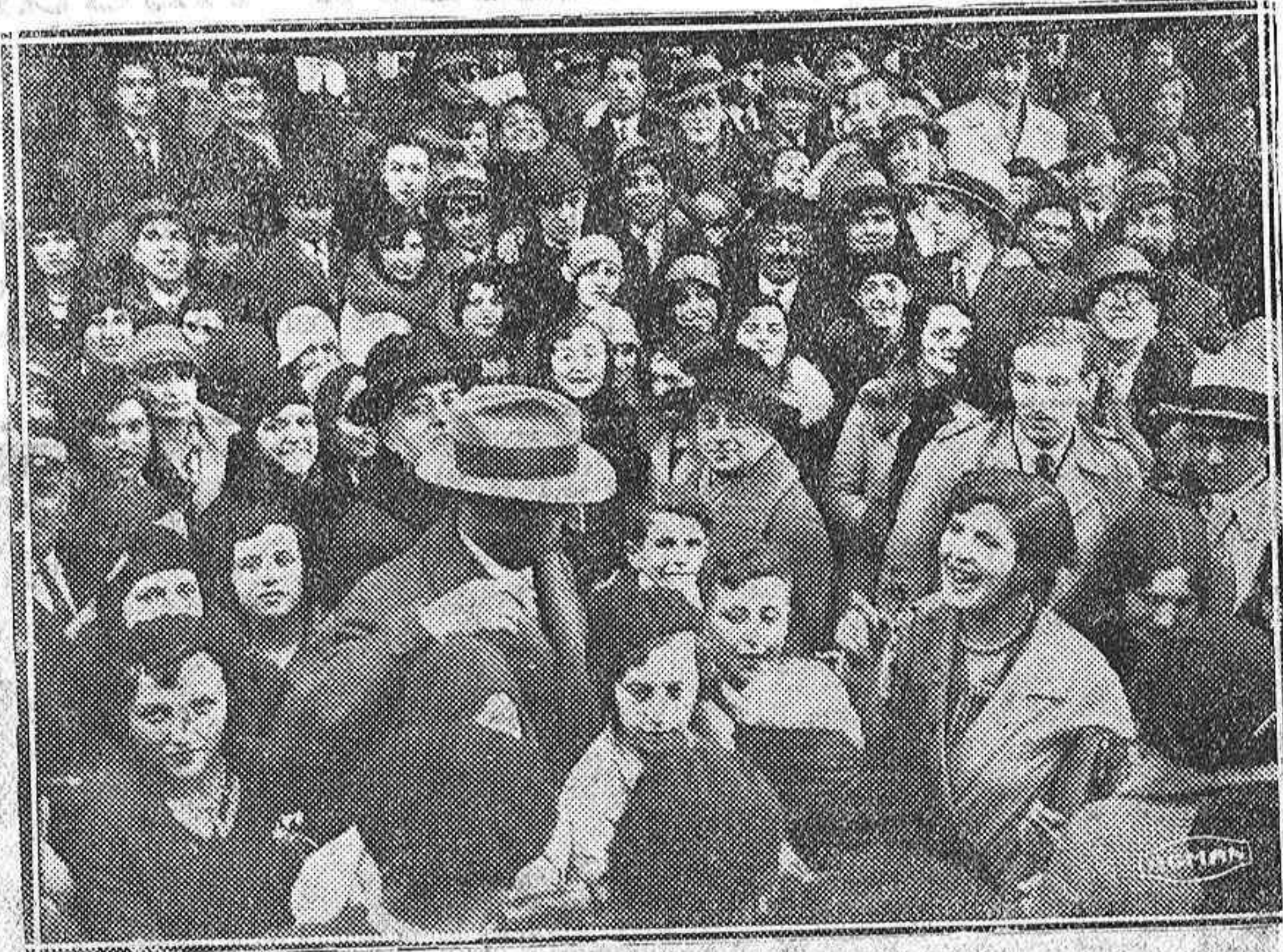
Los leoneses son recibidos con gran entusiasmo

Y suenan con dolor las campanitas porque ha muerto en un cuarto de París «un verdadero español».