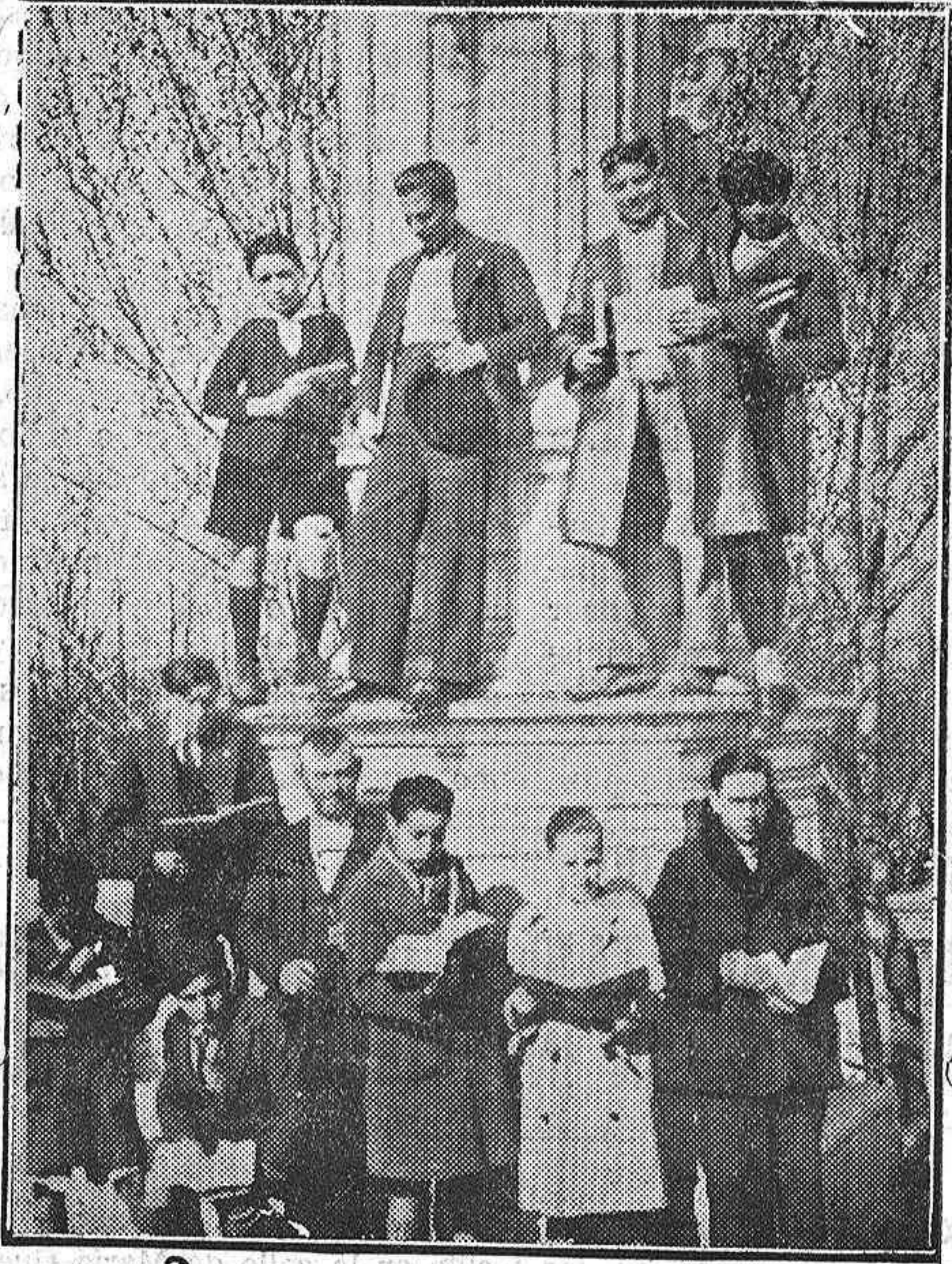
Ved a este grupo de estudiantes, que se han propuesto ocupar un puesto elevado, y por fin lo han conseguido

También ha dicho el alcalde que se ocupará a muchos obreros en la barriada de casas baratas que la Compañía Telefónica va a empezar a construir en la calle de Bravo Murillo.