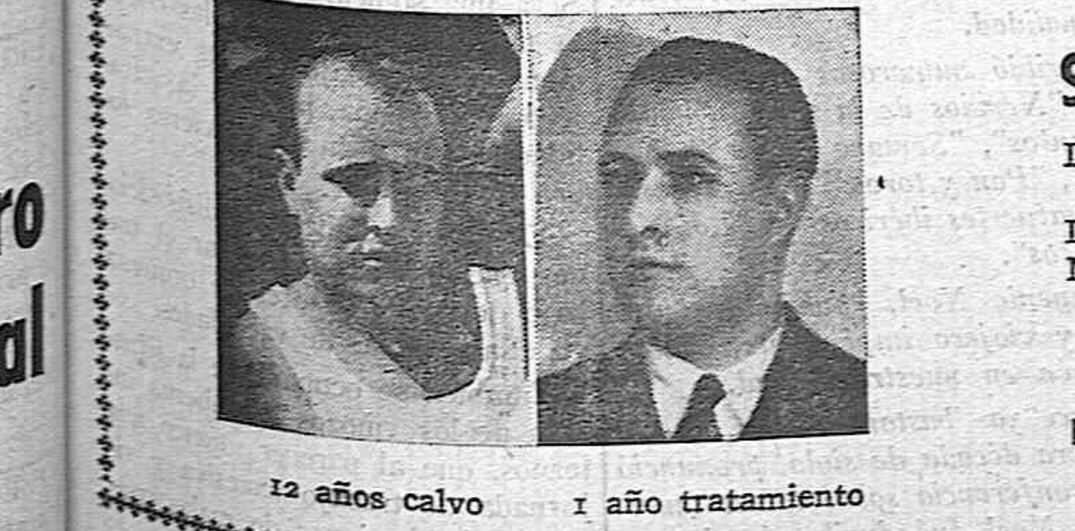
12 años calvo 1 año tratamiento