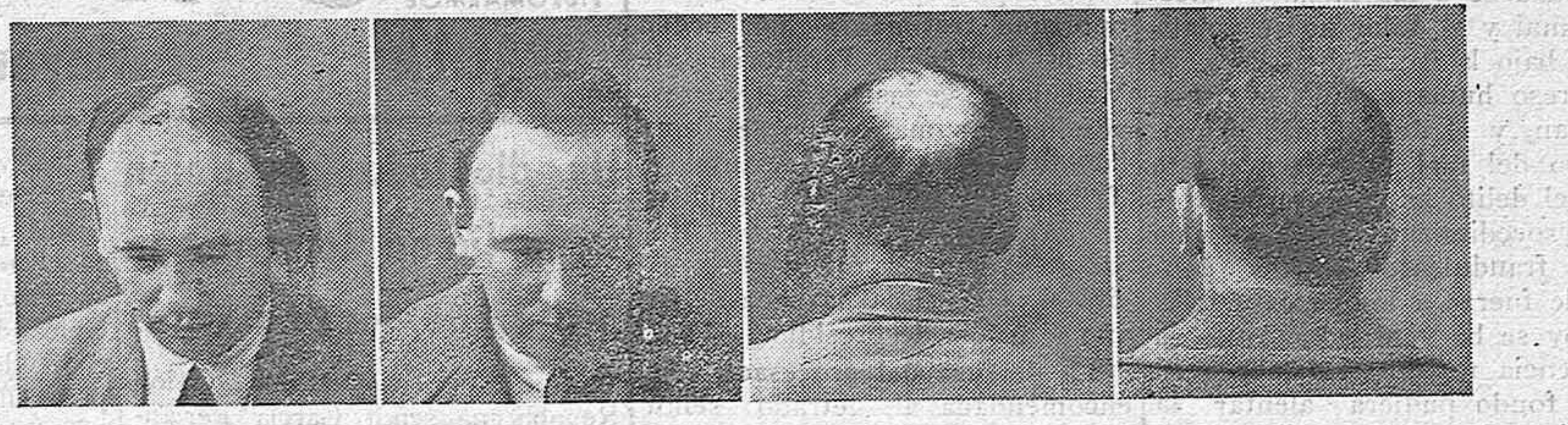
10 años calvo 5 meses tratamiento 10 años calvo 5 meses tratamiento