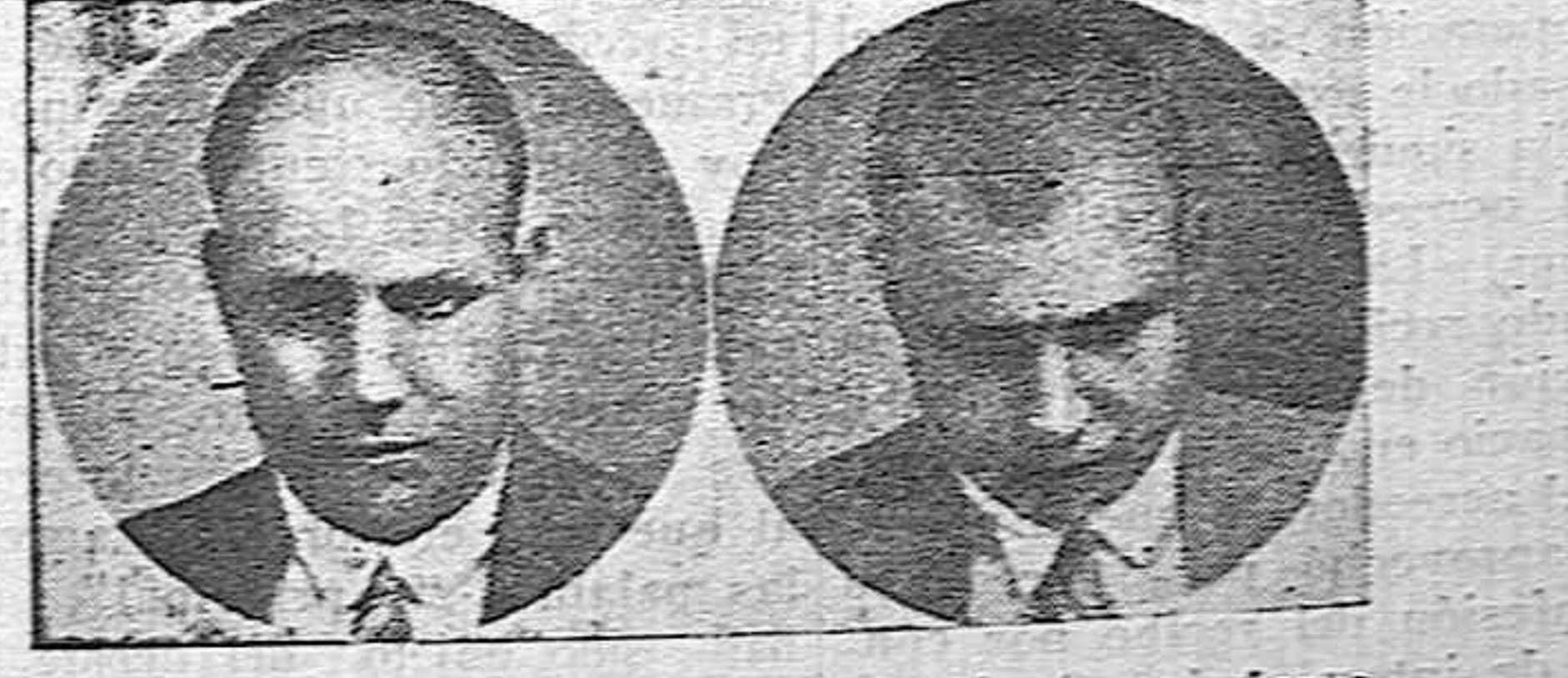
4 años calvo 5 meses tratamiento

Sistema de aplicación para la curación radical y rápida Desinfectante, 10 pesetas. Capilar, 20 pesetas. Curación completa de la caída de pelo, 5 frascos y el regalo uno de capilar. Ambos productos forman parte del tratamiento Del 1927 al 1936, curados más de 150.000 casos. Distinguido con las más altas recompensas. Nombramiento de miembro honorario del Jurado de Sanidad de Francia y Londres. Registrado en el Instituto Técnico de Comprobación con el número 12.276 e internacional