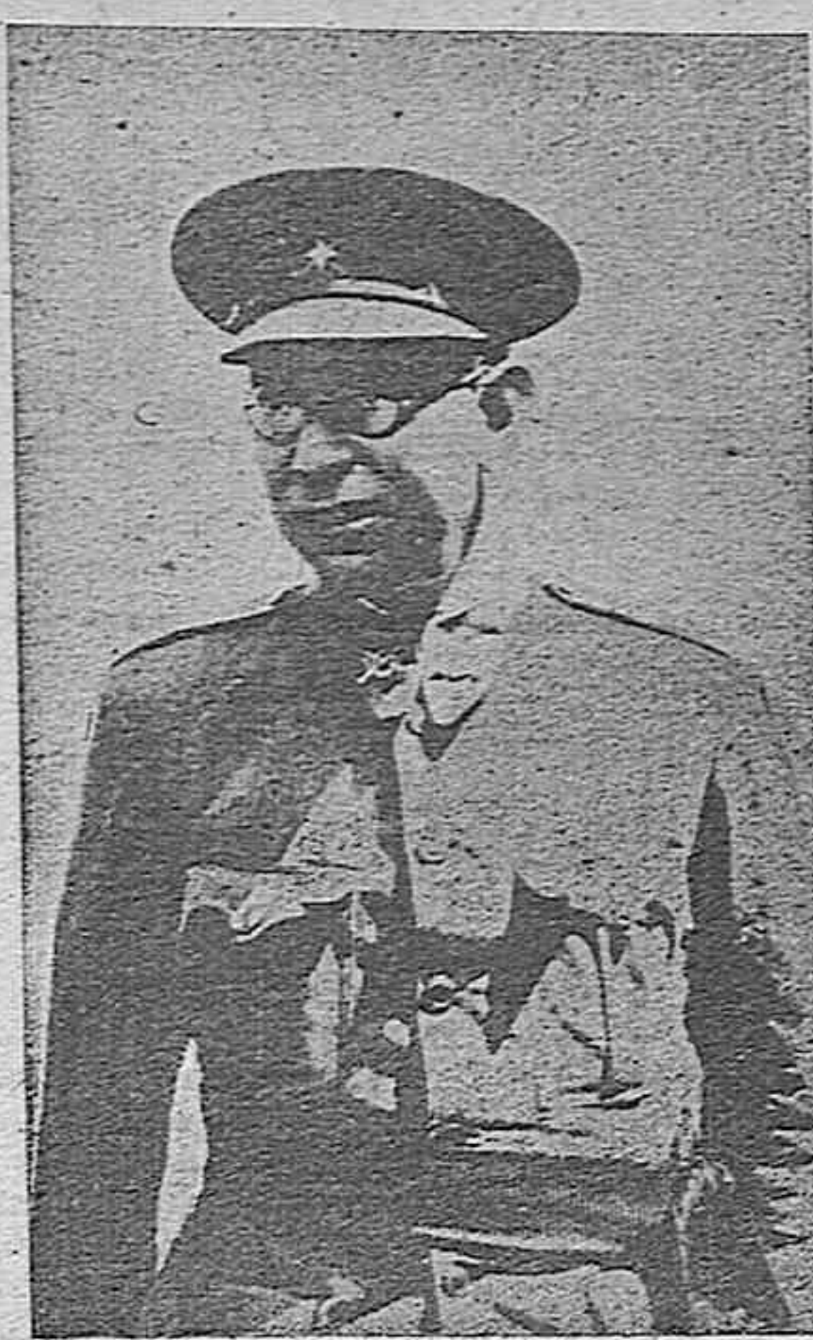
muere el gran Caudillo del Norte, EMILIO MOLA VIDAL

ASISTIERON AL SOLEMNE ACTO, S. E. EL GENERALISIMO, EL GOBIERNO EN PLENO, REPRESENTACIONES DIPLOMATICAS Y ALTAS JERARQUIAS DEL MOVIMIENTO El Caudillo, visiblemente emocionado, saludó en su tribuna a la señora viuda e hijos del llorado General. Mientras el Arzobispo de Burgos oficiaba la Santa Misa, una escuadrilla de aviones surcó el espacio formando una cruz