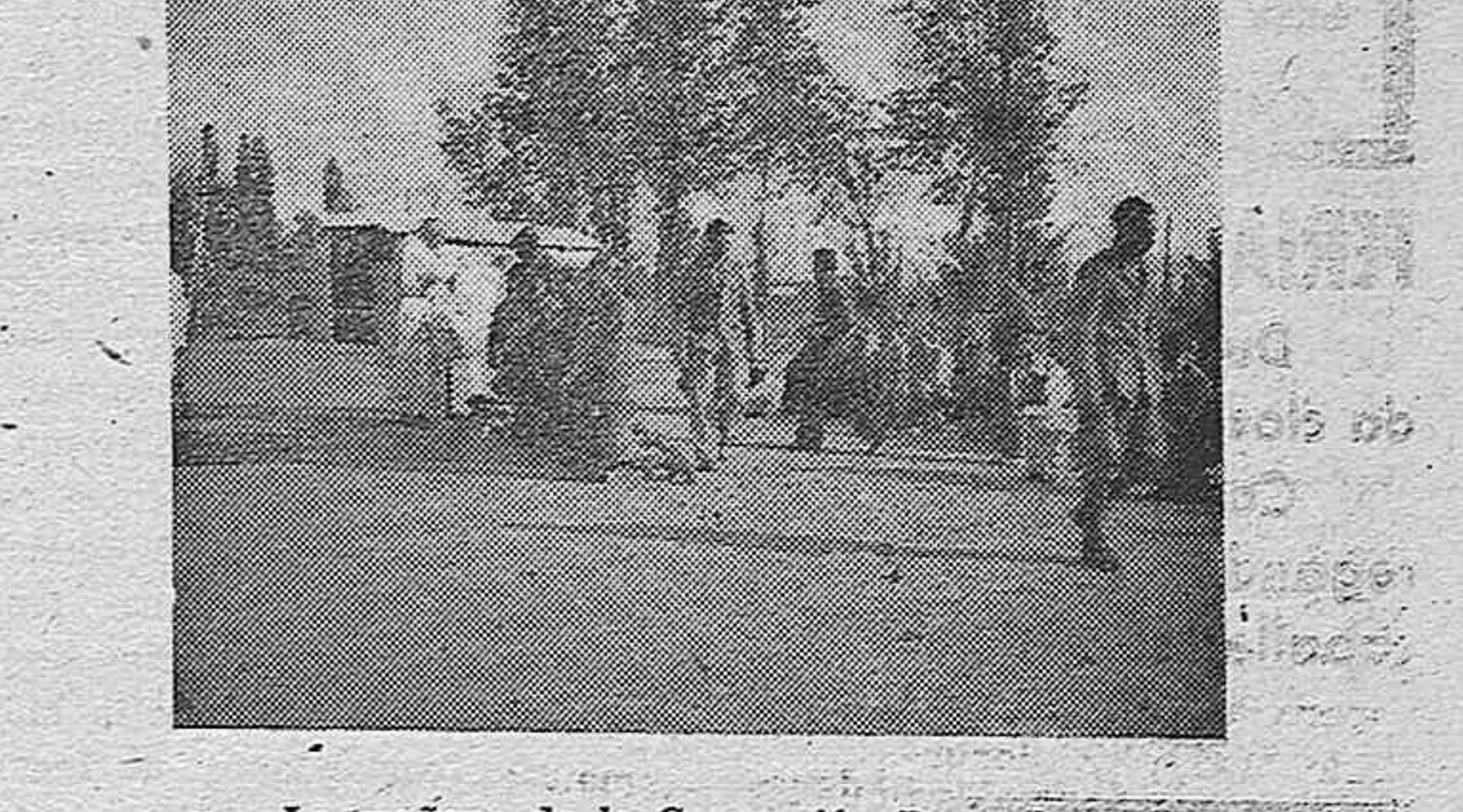
La mañana de la Comunion Pascual.