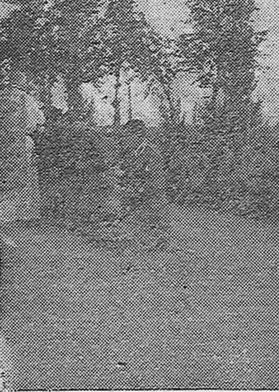
Arco de entrada al gran Campo de prisioneros

—Antes de comer, hacen la formación, y cantan con bastante afinación, "Cara al Sol" "El Legiona-