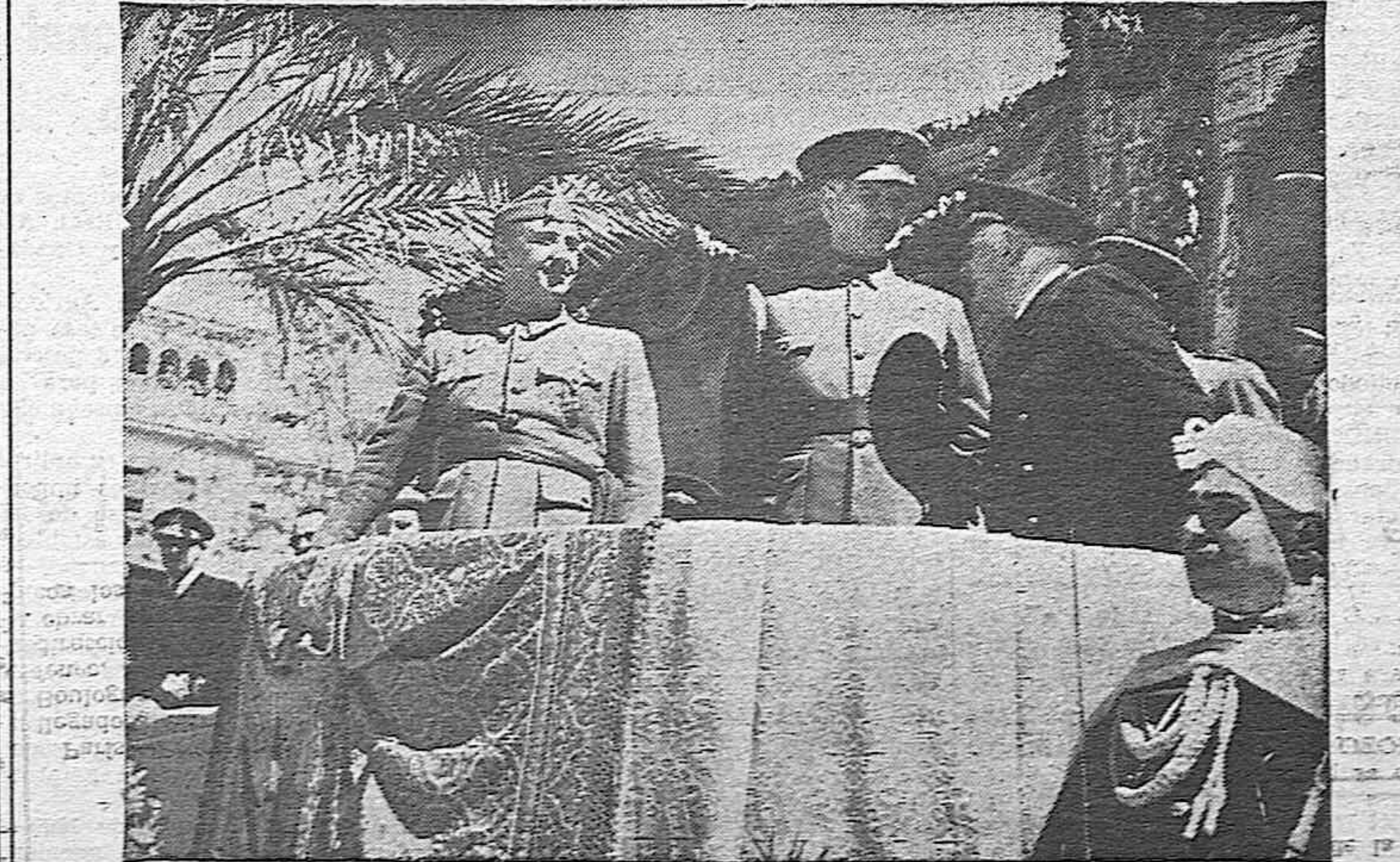
SEVILLA.—El Generalísimo Franco, acompañado del jefe del Ejército del Sur, general Queipo de Llano, y del jefe del Estado Mayor de la Marina, almirante Cervera, presencia el desfile de las tropas desde la tribuna instalada en el Paseo de las Palmeras.