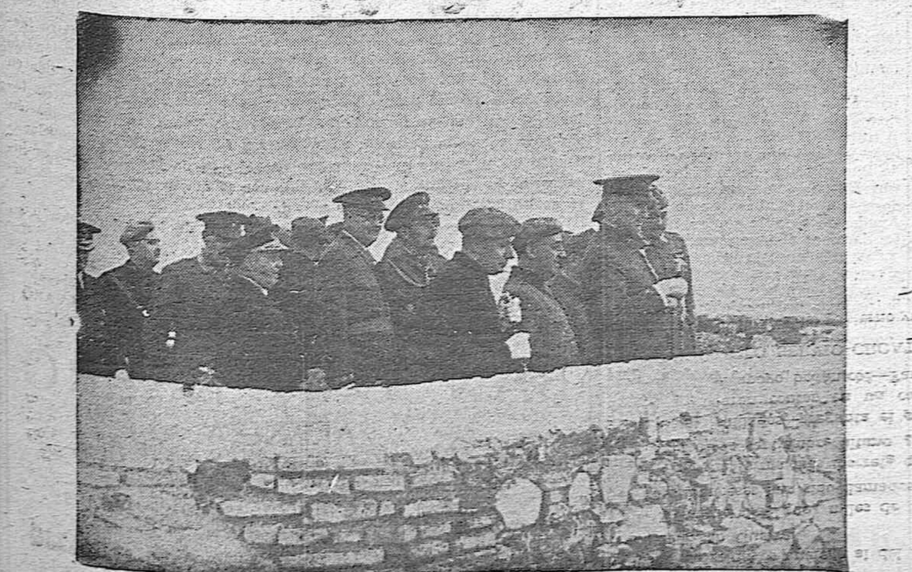
El Generalísimo Franco, acompañado de los generales Dávila y Queipo de Llano y sus respectivos séquitos, visitando al castillo de Gibralfaro durante su estancia en Málaga.

París.—El Embajador de España en París, señor Lequerica, ha hecho declaraciones a la Prensa francesa haciendo resaltar en términos muy enérgicos su protesta contra los que tratan de aumentar la inquietud de la opinión pública y la tirantez contra otras potencias, lanzando noticias fantásticas y tendenciosas tales como la de la amenaza española contra Gibraltar y Tánger. El embajador afirmó nuevamente que esta noticia carece en absoluto de fundamento.—Stéfani.