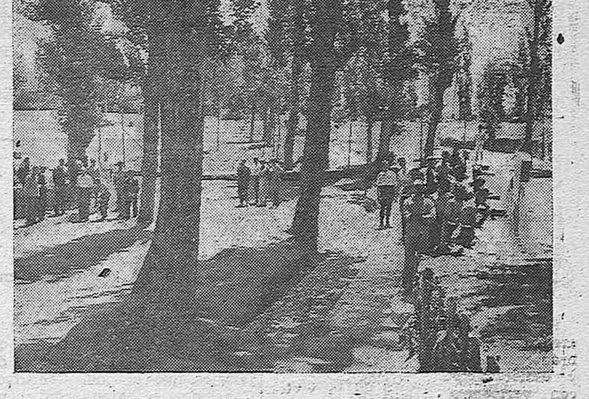
El aseo y el juego en plena campiña.

bién. Huidizo y escamón. De cualquier sospecha mal. Se dormía con facilidad, pero su despertar era terrible. La emprendía a puñetazos con sus compañeros y su manía era tirarlos al Canal. Tuvimos que arrestarle varias veces, y ni por esas. Seguía en sus trece. Bronca tras