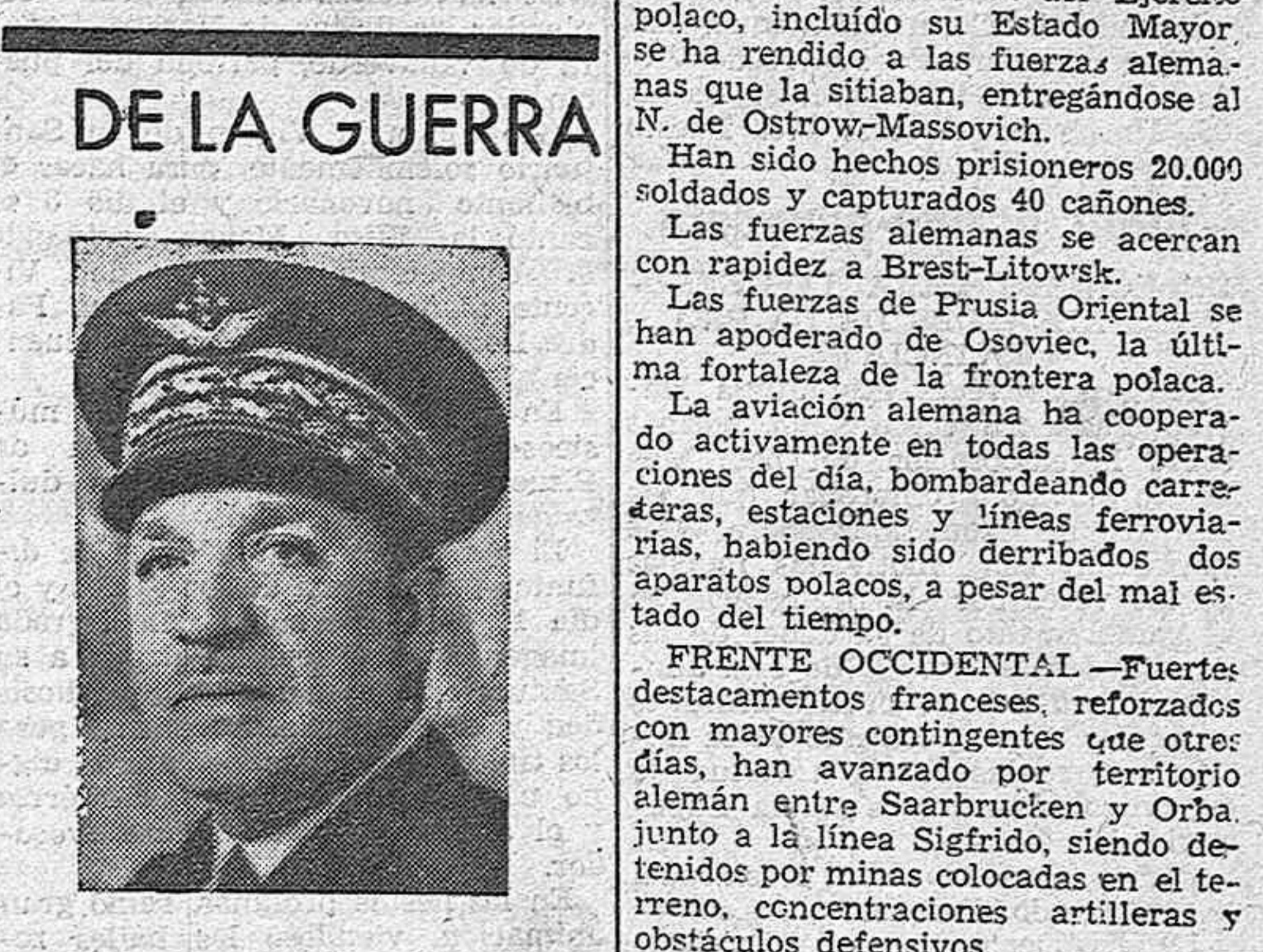
El general Vuillemin, jefe supremo de las fuerzas aéreas de Francia