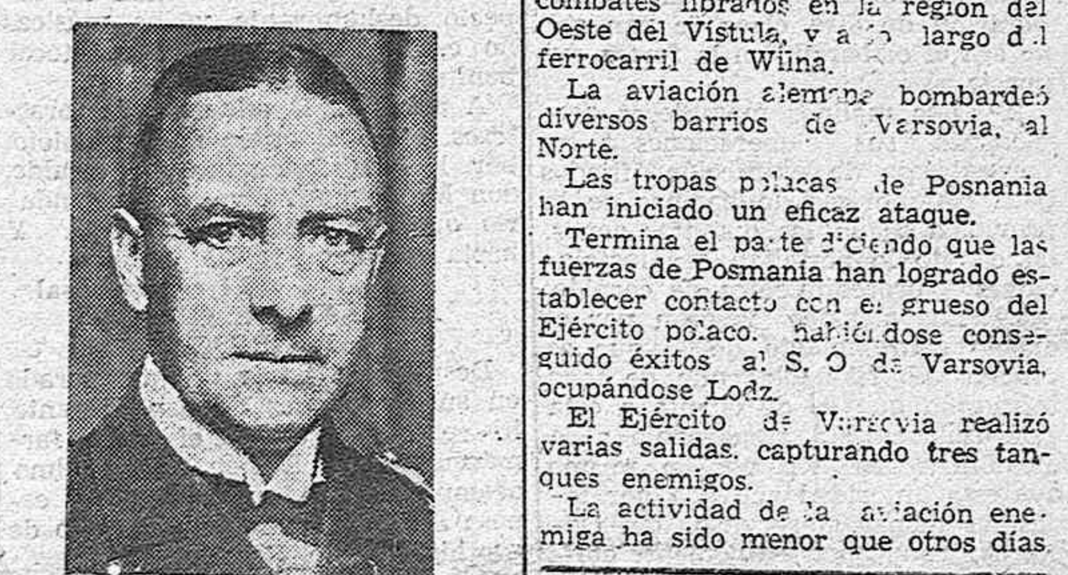
El almirante Raeder, jefe supremo de la flota de guerra alemana