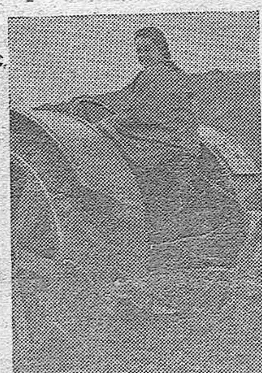
Esta muchacha inglesa del «Ejército del campo», rotura con su tractor las tierras destinadas a las nuevas plantaciones.