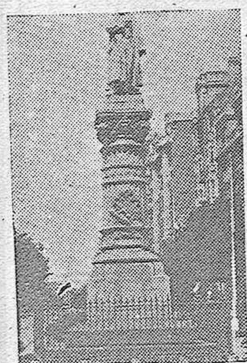
La estatua de Argüelles en Madrid, situada en el cruce de las calles de la Princesa y la del Marqués de Urquijo, será retirada de este lugar, con el fin de facilitar la circulación, extraordinariamente entorpecida actualmente por su enclavamiento.

Por falta de espacio —ya que hemos querido reservar la mayor parte al aspecto internacional—, nos vemos obligados a aplazar la publicación de diversas informaciones de carácter local y nacional. Lo haremos en días sucesivos.